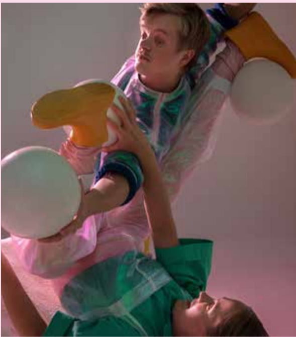
Kompani Giraff Kiseldalen.

Arrangör: Haninge kultur och Haninge Riksteaterförening.