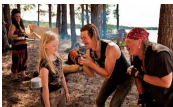
När jag blev stulen andra veckan i juni (Me rosvolat).

Arrangör: Biblioteket i Handen med stöd av finskt förvaltningsområde.