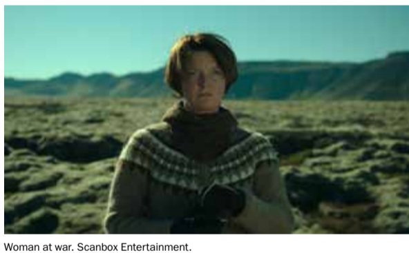
Woman at war. Scanbox Entertainment.