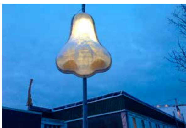
Språkcafé Näsan.

Arrangör: Haninge kultur och Jordbro bibliotek.