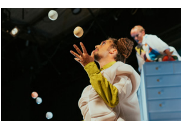
Kompani giraff.

Arrangör: Haninge kultur i samarbete med Haninge Riksteaterförening med stöd av Dans i Stockholms stad och län (DIS).