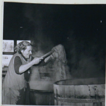
Skutan, tvättstugan. Tvätten lyftes över från kokgrötan till överläkningsåsn. Foto G. Schmidt, 1963.