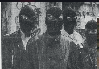
— Vi vägrar flytta. Den senaste tiden har Ultra-huset i Håninge tänker inte ge efter för kommunen, som kräver att de lämna