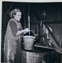
Skutan, tvättstugan. Fru Hultström tar kallt vatten i sköljkarret och slår det i överläkningsåsn. Foto G. Schmidt, 1963.