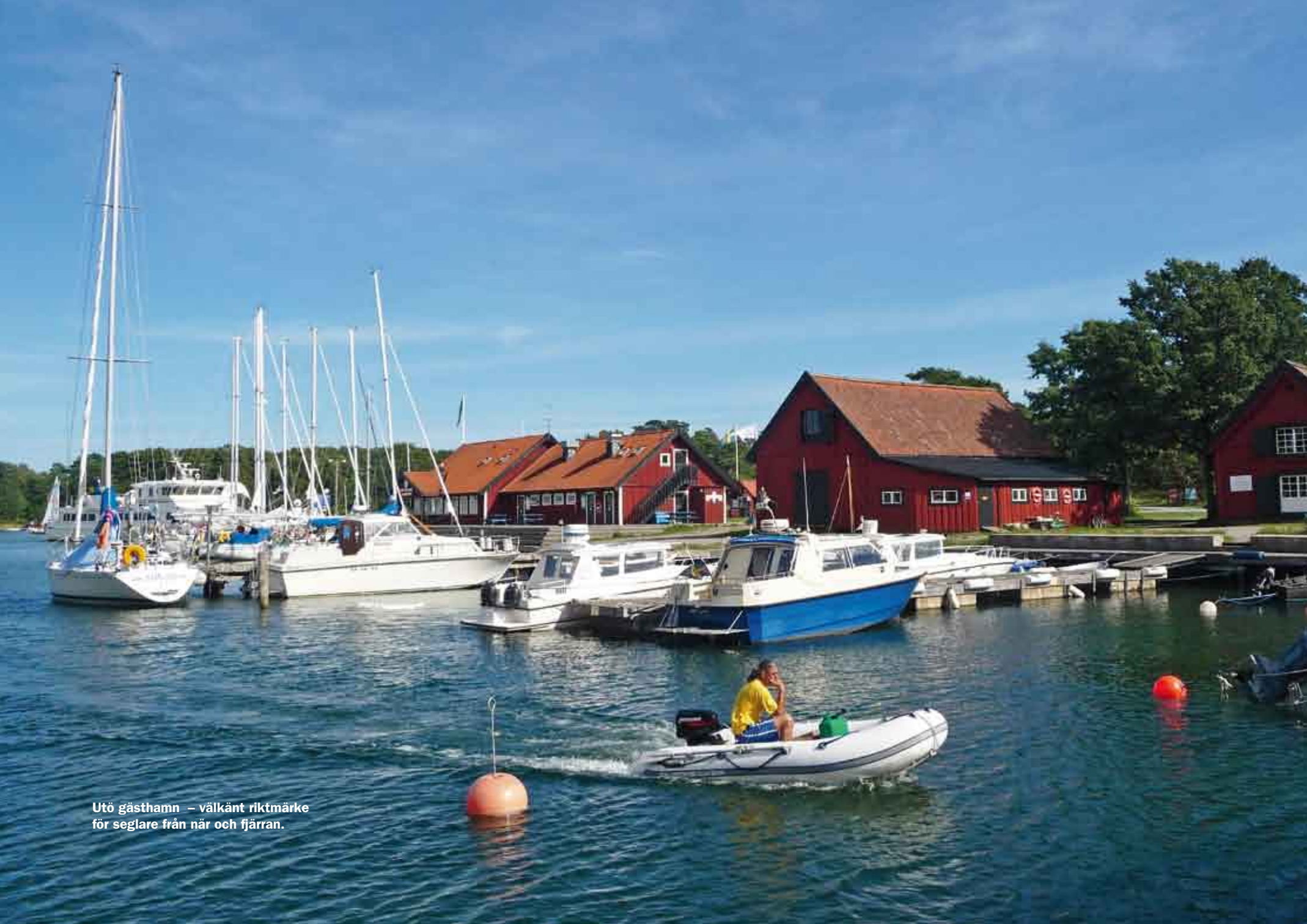
Utö gästhamn – välkänt riktmarke för seglare från när och fjärran.