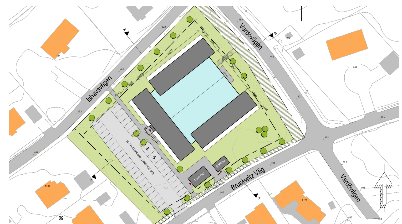
Möjlig placering av ett fierbostadshus (Liljewall arkitekter på uppdrag av Bovieran AB).