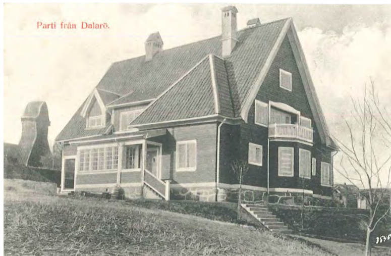
Strand hotells huvudbyggnad tidigt 1900-tal (Dalarö Hembygdskommitté)

den blev då en del av hotellverksamheten under namnet klubbhuset, senare vinterhotellet. Dalarö hotells huvudbyggnad kallades sommarhotellet.