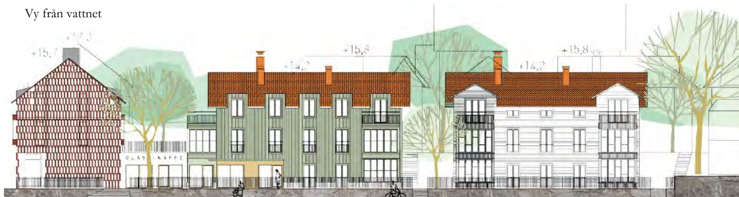
Vy från vattnet

På plankartan redovisas gränsen mellan två typer av kvartersmark B respektive BH samt allmän platsmark ( LOKALGATA ) med linjen användningsgräns. För olika delar av kvartersmarken gäller varierande egenskapsbestämmelser, gränsen mellan områden med olika egenskapsbestämmelser utgörs av en egenskapsgräns.