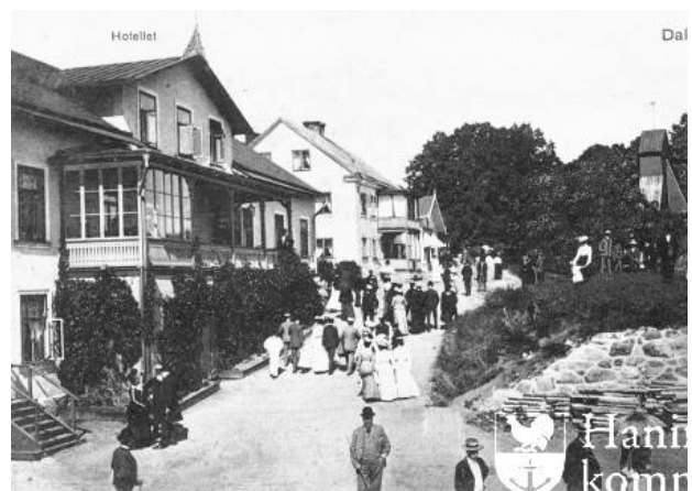
Dalarö hotell, huvudbyggnad och annex

År 1907 uppfördes en stor privatvilla på platsen för nuvarande Strand hotell. Det var en högrest trävilla med brant sadeltak uppfört i nationalromantisk stil. 1913 såldes villan och den blev då en del av hotellverksamheten under namnet klubbhuset, senare vinterhotellet. Dalarö hotells huvudbyggnad kallades sommarhotellet.