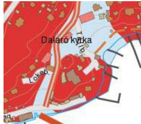
SGU, Översiktlig jordartskarta (röd färg; berg, blå färg; sandig morän)

De geotekniska förhållandena bedöms över lag som goda för grundläggning av föreslagen bebyggelse tack vare ett generellt sett tunt jordlager bestående sandig morän samt närheten till berg. De exakta förhållandena inom planområdet är dock inte kända och kommer behöva studeras inför detaljprojektering. Viktigt att belysa är bland annat marksituationen närmast Dalarö strandväg och vattnet där fastigheten kan vara utfylld.