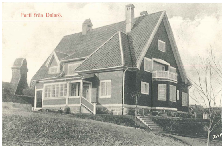
Strand hotells huvudbyggnad tidigt 1900-tal (Dalarö Hembygdsförening)

På 1950-talet minskade intresset för Dalarö som semesterort och hotellet fick problem med sin överlevnad. 1965 revs huvudbyggnaden tillsammans med annexet och några intilliggande hus för att ge plats åt ökad biltrafik. Vinterhotellet/Strand hotell har sedan dess drivits vidare med undantag för några år på 1990-talet då verksamheten låg nere. Efter en brand på 1980-talet har hotelletbyggnaden idag en helt annan skepnad än det nationalromantiska huset det uppfördes som.