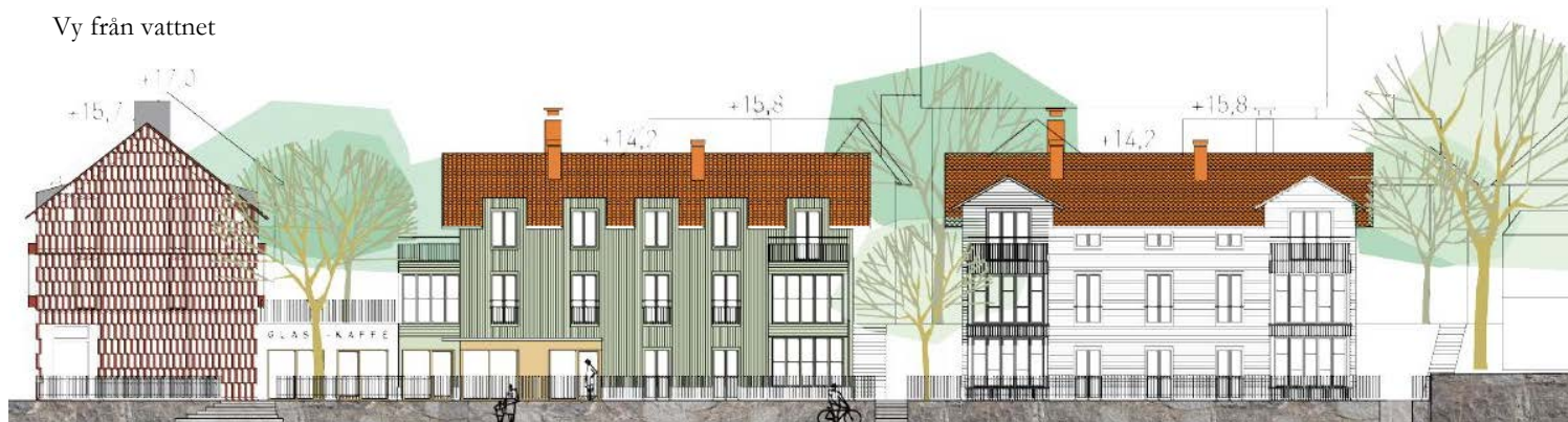
Vy från vattnet

På plankartan redovisas gränsen mellan två typer av kvartersmark B respektive BH samt allmän platsmark ( LOKALGATA samt GCM-VÄG ) med linjen användningsgräns. För olika delar av kvartersmarken gäller varierande egenskapsbestämmelser, gränsen mellan områden med olika egenskapsbestämmelser utgörs av en egenskapsgräns.