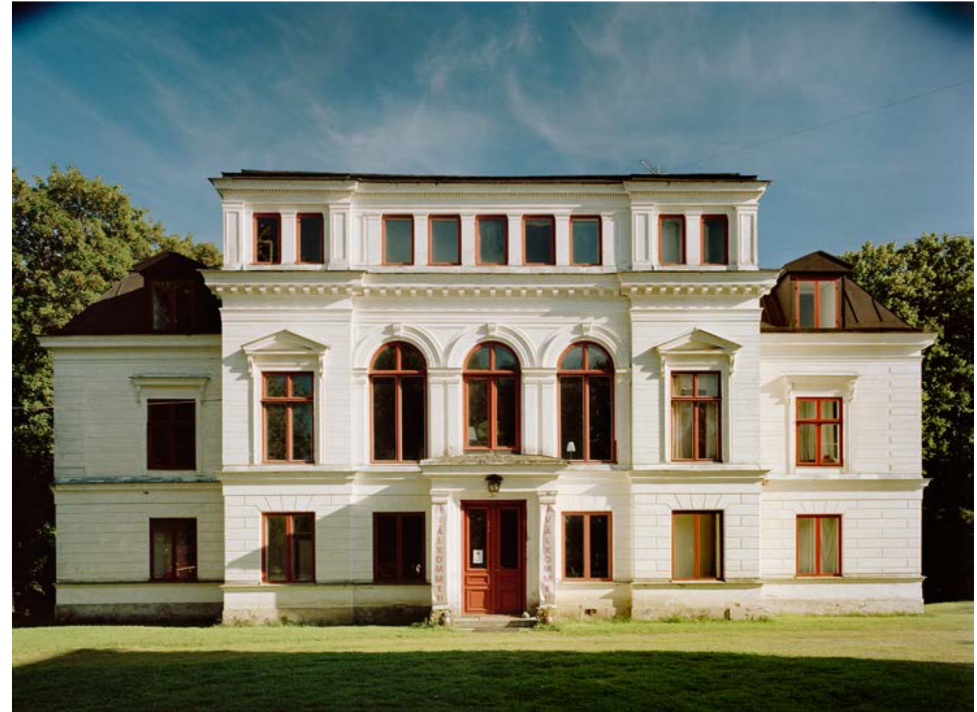
> Corps de logi sett från norr. 6 september 2015