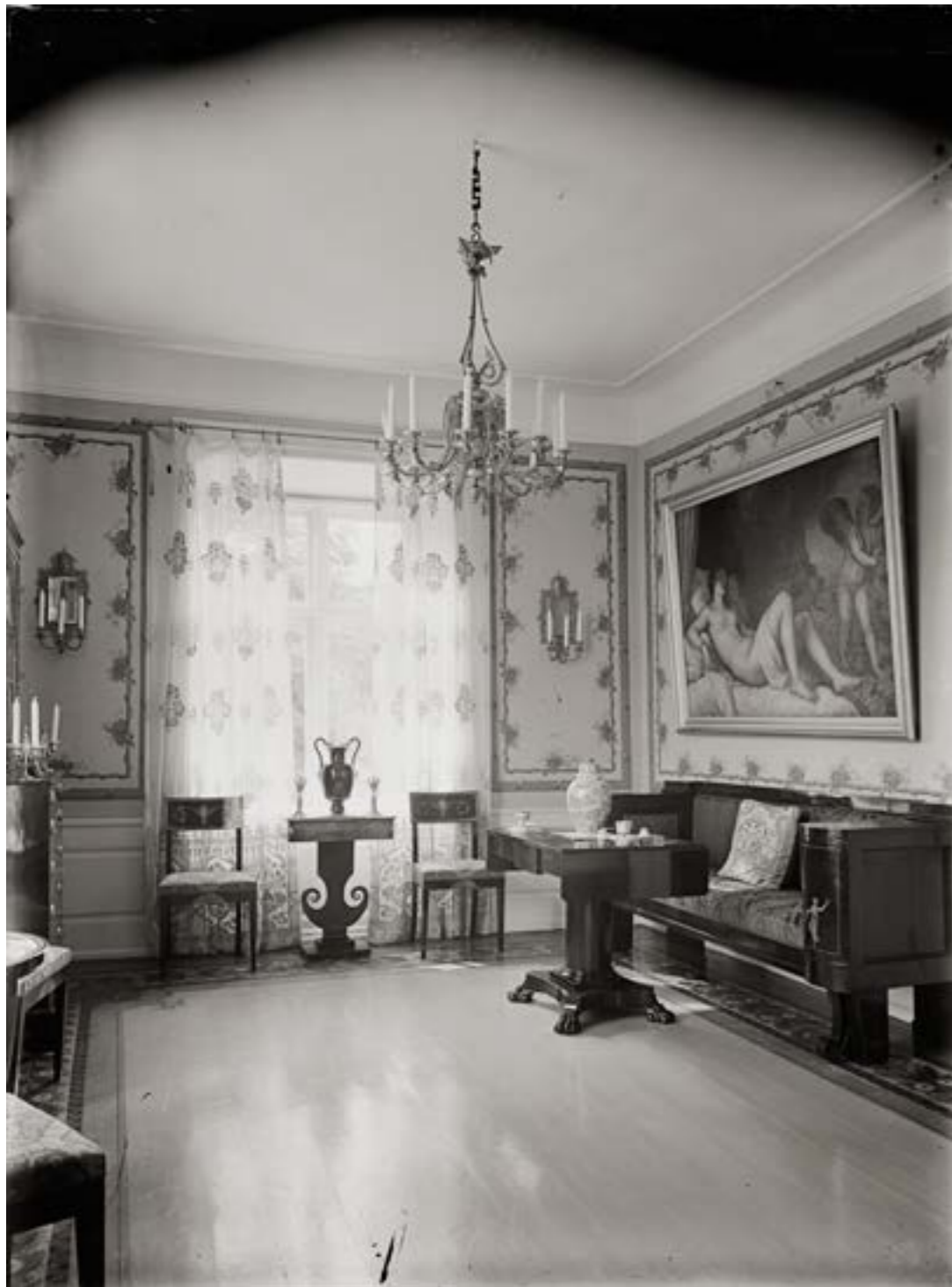
< Empiresalongen 1924.