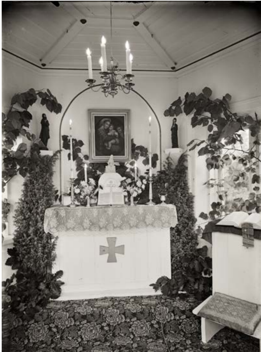
< Katolska Kapellet 1924.