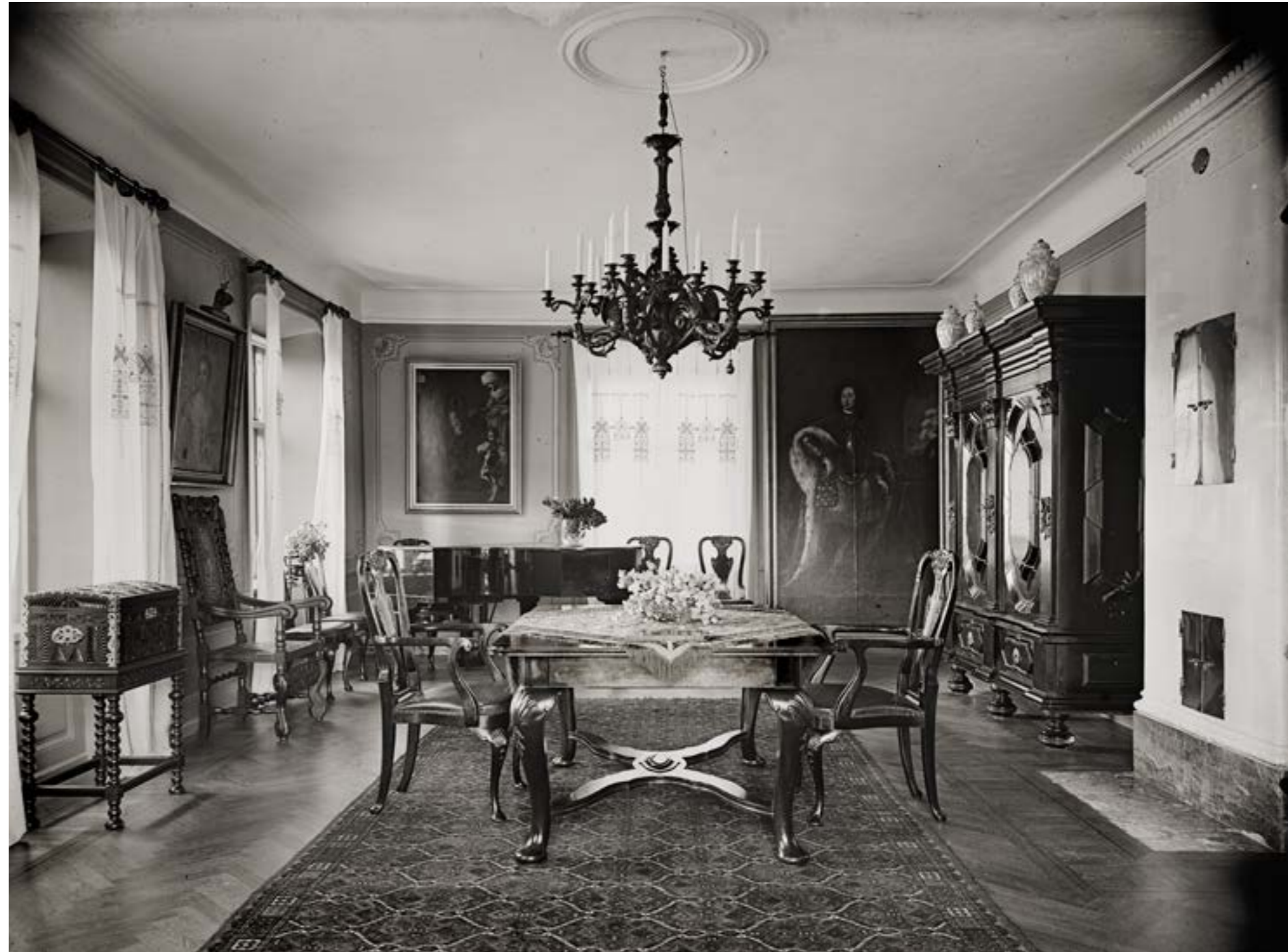
> Stora Matsalen 1924.