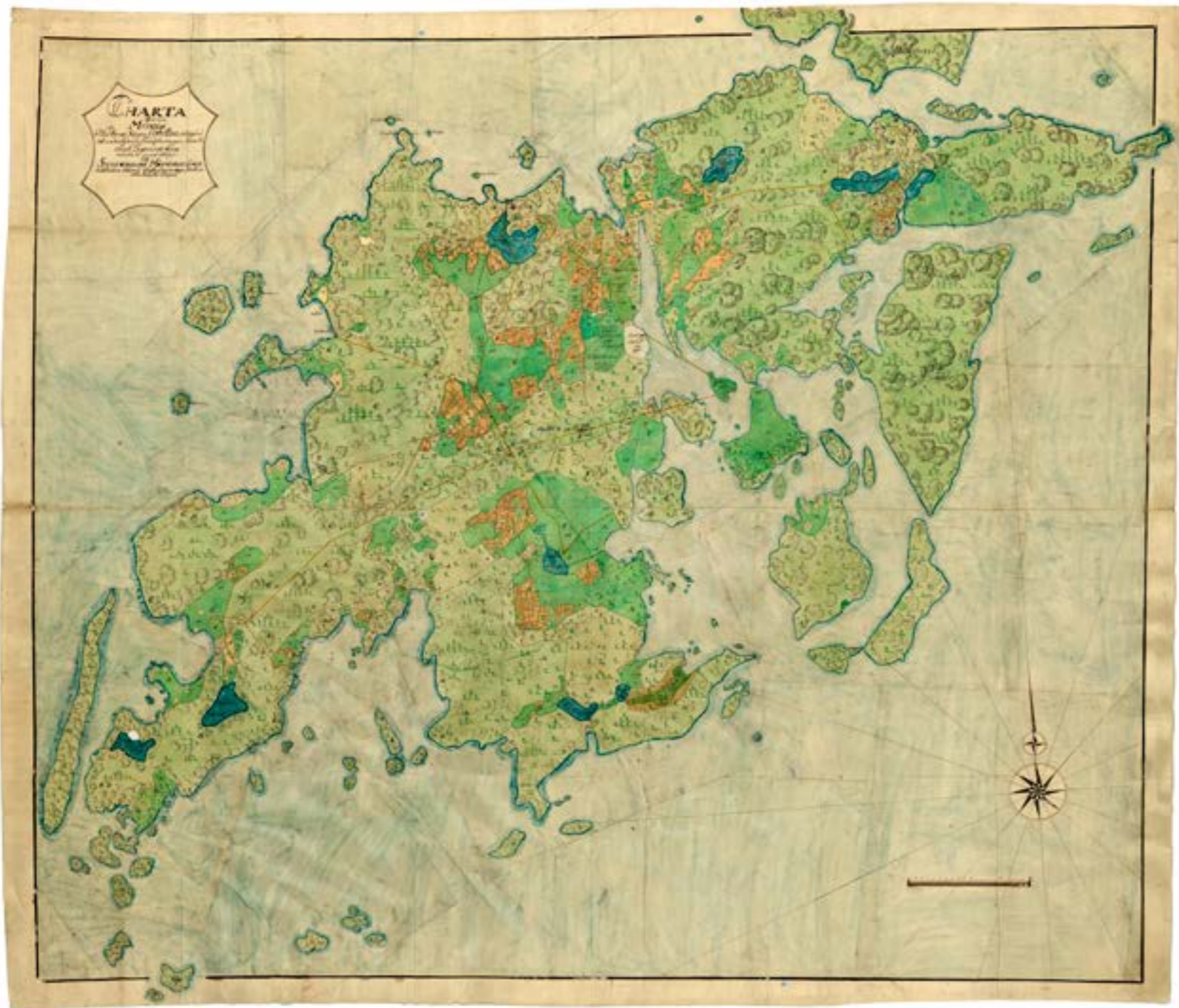
< "Charta öfver hela Muskön". Geometrisk avmätning 1773 av lantmätare Gabriel Boding. Bild: Lantemäteriet/ Haninge kommun.

Muskö ligger i Södertörns inre skärgård skild från fastlandet av Horsfjärden. Namnet lär betyda "den mörka ön" och på håll kan den kuperade ön uppfattas som mörk och hemlighetsfull.