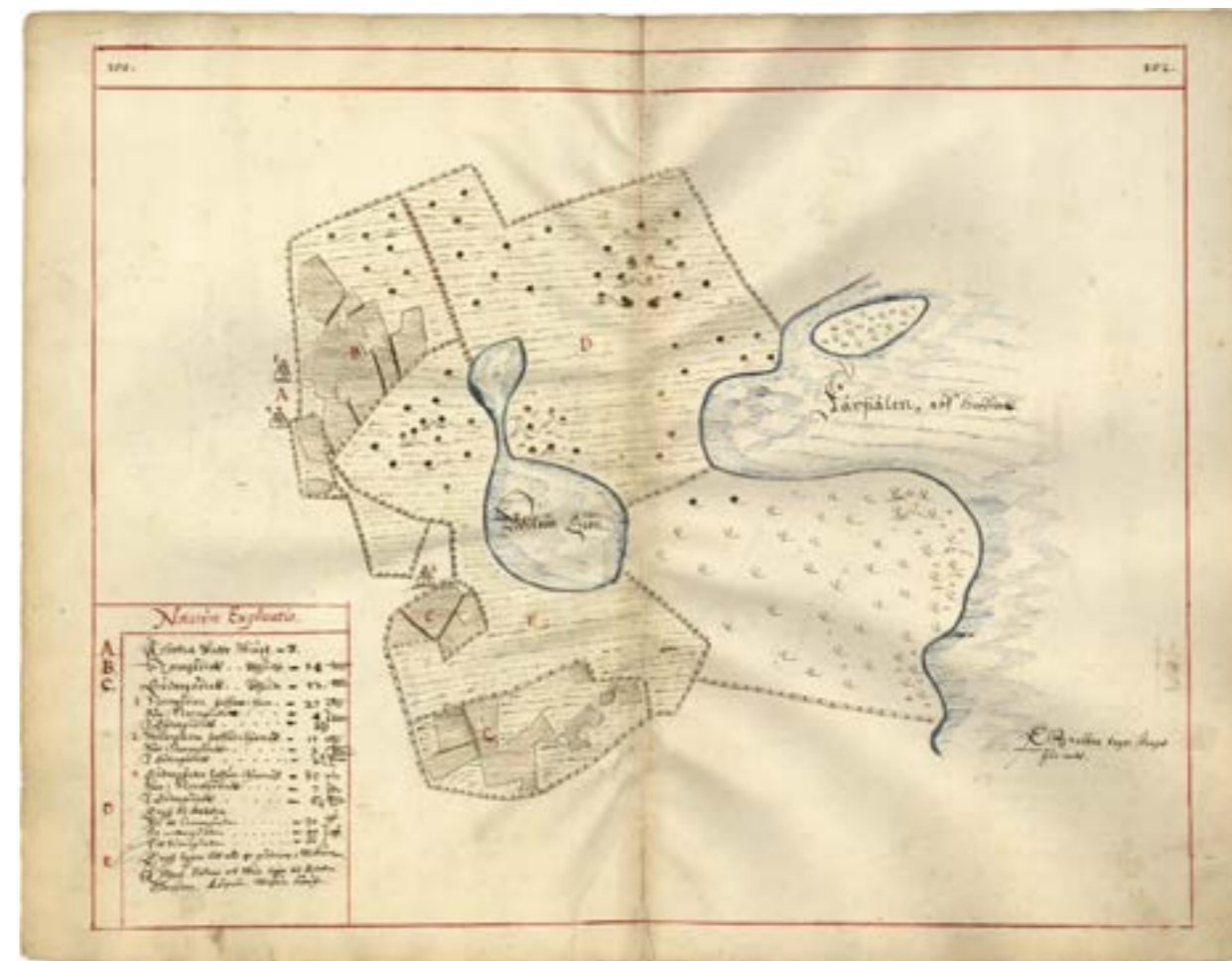
^ Geometrisk avmätning över Arbottna 1638.