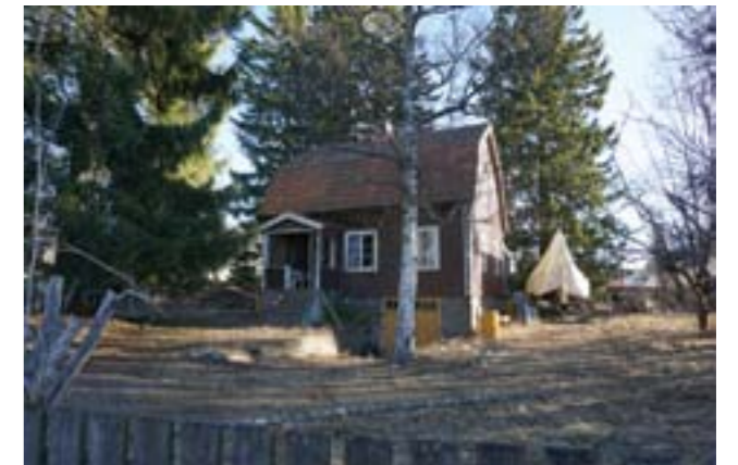
Mycket välbevarad och tidstypisk 1920-tals villa, om än med troligen senare tillkommen garageport.