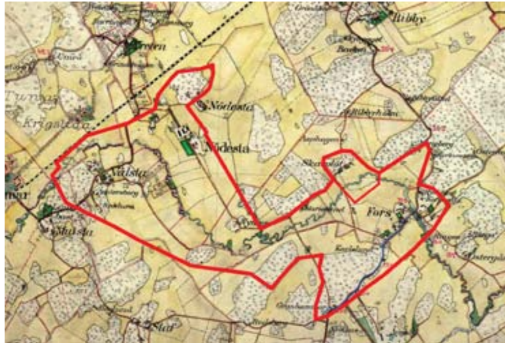
Aktuellt område markerat med rött på Häradskartan från 1901-06. Gamla landsvägen mellan Granhammar och Fors är markerad med blått.