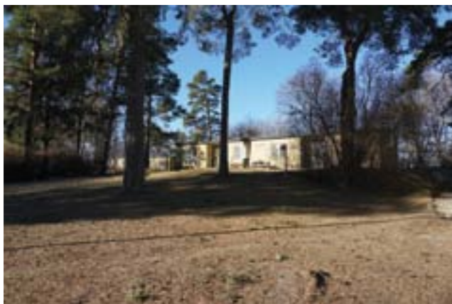
Elevhemmen är omsorgsfullt placerade i bevarad terräng.