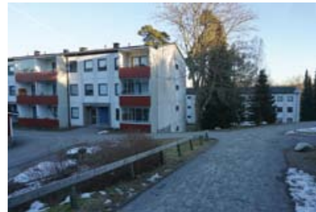
Placeringen är anpassad till terrängens höjdnivåer.