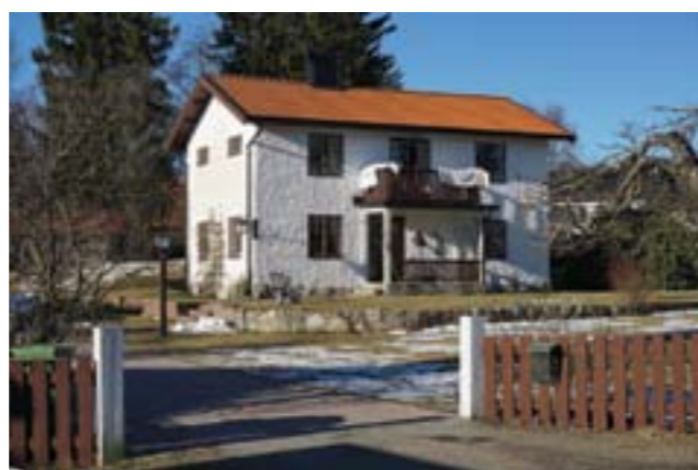
Den forna arrendatorsbostadens södra fasad. Foto: Tobias Mårud. Gaveln ger en viss indikation på att det tidigare varit en magasinbyggnad. Foto: Tobias Mårud.