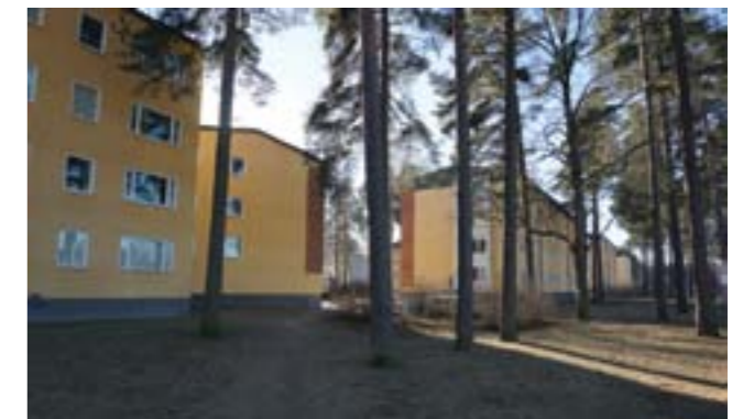
Kontakten mellan bebyggelse och den glesa skogen är påtaglig.