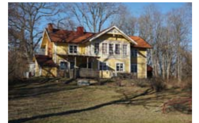
Allén ned mot Ribby gård, från norr, och den nuvarande manbyggnaden på Ribby gård, sedd från söder.