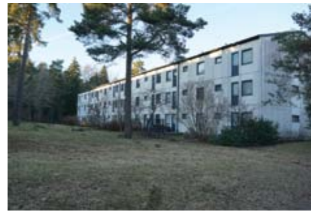
Byggnaderna är placerade med bevarad natur intill.

Befintlig bebyggelse är skyddad av plan och bygglagen (PBL) enligt följande stycken: PBL 2 kap. 6 §, PBL 8 kap. 14 § och PBL 8 kap. 17 §. Förutom de generella skydd som PBL, tillsammans med PBF, MB och KML omfattar så ska miljön, inklusive bebyggelsen, i egenskap av att den är klassad som särskilt värdefull handläggas enligt PBL 8 kap. § 13 och PBL 9 kap. § 4d.