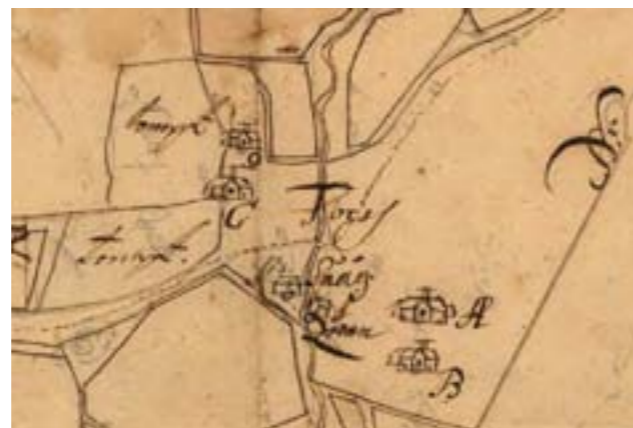
Situationen är den samma på karta från 1694, men gårdarna är tydligare benämnda A, B, C och D.