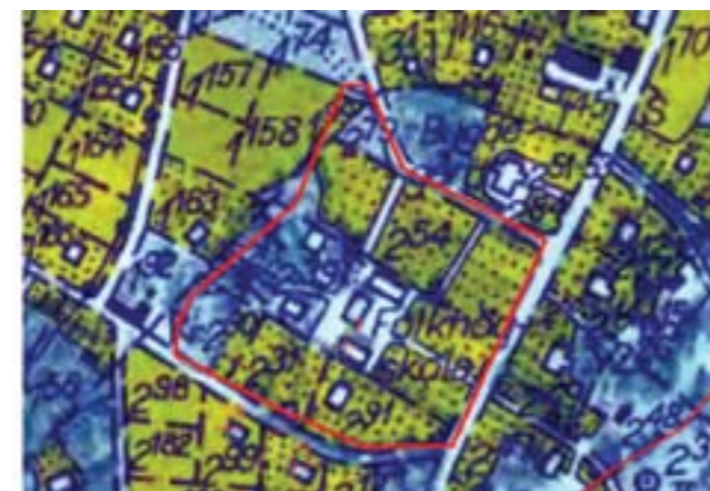
Uppifrån och ned: Det aktuella områdets avgränsning är markerat med rött. Häradskartan 1901-1906. Ekonomen från 1951