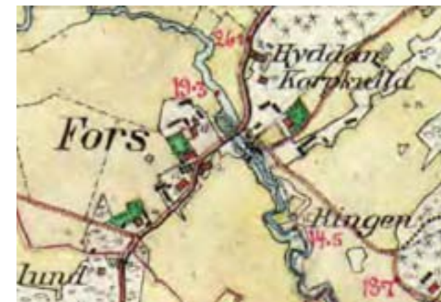
På häradskartan från 1901-06 kan resultatet av laga skiftet uttydas, det finns nu bara två gårdar kvar i byn, även om det finns ett stort antal byggnader och fler än två hemmansdelar.