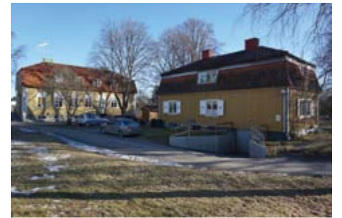
Sörgårdens baksida med södra flygel till vänster i bild.

Gamla skolbyggnaden (södra flygel), f.d. rektorsbostaden, f.d. lärarbostaden och Sörgården är i detaljplan (D-172) angiven som särskilt värdefull bebyggelse och markerade med q. För hela området gäller varsamhetsbestämmelser, markerat med k i detaljplan, och för större delen gäller förbud mot uppförande av ny bebyggelse.