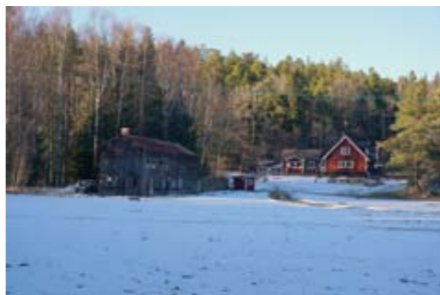
Torkladan sedd från Lyngstavägen.

Det är en stor byggnad i två plan som kombinerade tvättstuga, mangelrum och två torkrum, ett traditionellt med vädringsluckor i fasad och ett med elektriska fläktar. Byggnaden är måhända i behov av exteriört underhåll men anläggningen sägs vara i så gott maskinellt skick att den skulle kunna drivas än idag.