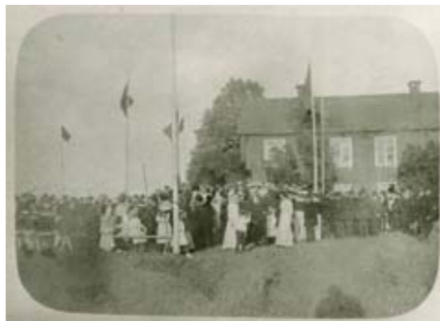
Basar i Tingshuset 1914.