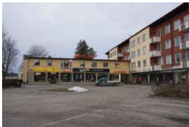
Åbyplan, Västerhaninges första affärscentrum.