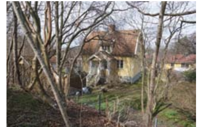
Anneberg är troligen uppfört på 1920-talet, möjligen något sydväst om tidigare plats.

Det är oklart när nuvarande byggnad uppfördes. Möjligen är huset ursprungligen från andra hälften av 1800-talet och senare ombyggt eller så revs det ursprungliga huset och nuvarande uppfördes, troligen under 1920-talet. Tomten omfattade ursprungligen hela kvarteret väster om folkhögskolan.