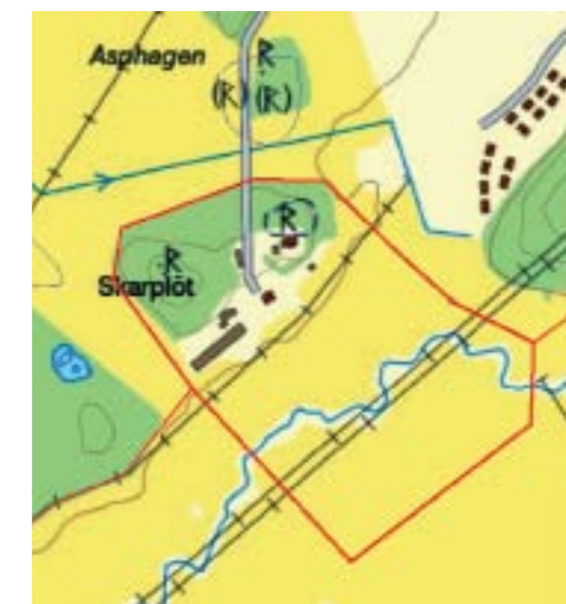
Avgränsning av det identifierade området som utgör en särskilt värdefull kulturmiljö.

Gårdsläget anknötnings till det angränsande järnåldersgravfältet ger en intressant och tankeväckande koppling