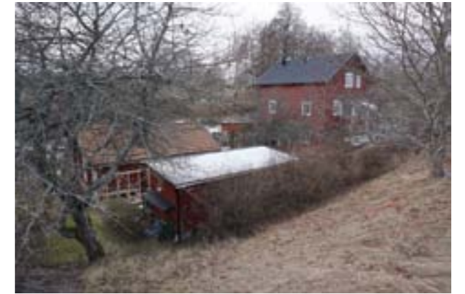
En snårig överblick över kvarnen och mjölnarbostaden från sydöst.

Kvarnbyggnaden som uppfördes ca 1900 är trots genomgående ombyggnad kulturhistoriskt viktig då den redovisar vad som en gång gjorde Fors betydelsefullt. Den intilliggande mjölnarbostaden, eller kvarnstugan är viktig i sammanhanget och förstärker miljöns värde. Kvarnen togs ur bruk 1935 varefter bland annat damm, ränna och drivhjul försvann. Mycket återställdes dock på 1970-talet, om än i delvis ny tappning. Tidigare fanns två kvarnar vid ån, den ena låg på västra sidan och tillhörde Berga, den andra tillhörde Häringe och låg där nuvarande kvarnen är belägen. Båda kvarnarna fanns kvar in på andra hälften av 1800-talet.