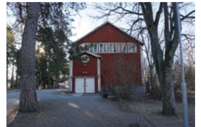
Åbygården. Överst, foto: Ola Elgebrandt. Nedan, två bilder, foto: Tobias Mårud.