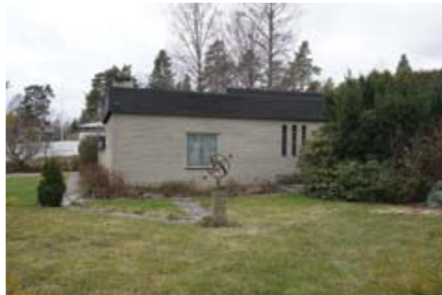
Ännu en ypperligt exempel på 1960-talets arkitektoniska villaideal, nu från senare delen av 60-talet. Betongglasslitsar i fasad, solur, vintergröna växter, hårdgjorda passager och öppna gräsytor.