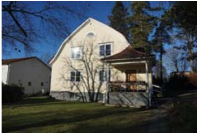
Rektorsbostaden, till vänster skimtar ett nybyggt äldreboende.