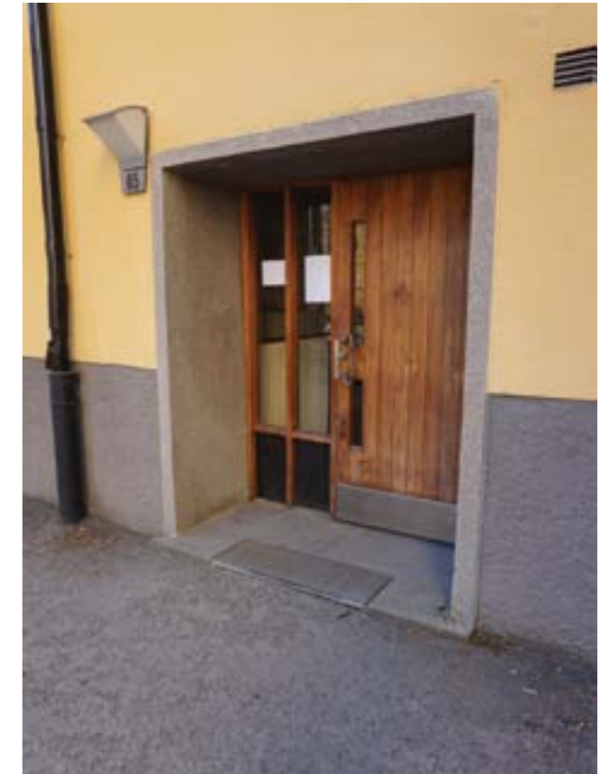
Utsmäckningar utgörs främsta av praktiska detaljer som t.ex. portar, observera de dubbla handtagen som förenklar för barn.