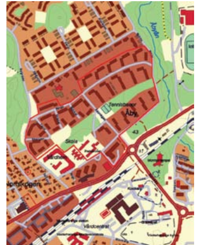
Det aktuella områdets avgränsning är markerat med rött.

Åby har en stadsplan som till stor del är inspirerad av den engelska grannskapsplaneringen med ledord som Neighborhood planning och Community centers. Denna växte fram ur funktionalismen men baserades även på sekelskiftets trädgårdsideal där bostäder, arbetsplatser och social service integrerades i mindre enheter. Tanken var bl.a. att främja social gemenskap och forma den demokratiska medborgaren. Bebyggelsen utgörs i stort av funktionalismens lamellhus men nu i ett mer varierat planmönster, med byggnaderna grupperade kring gårdar.