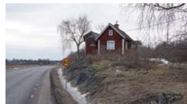
Överst: Gästgivargårdens huvudfasad, delvis förändrad men med bibehållen volym och delvis äldre detaljer. Nederst: Den lilla stugan "Berget" med ateljébyggnaden nästan hängande över gamla riksvägen.