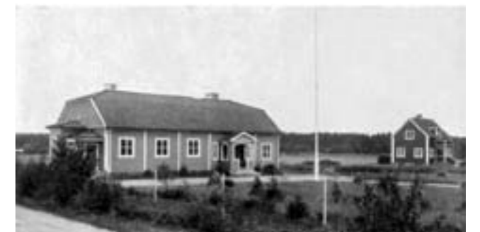
Bygdegården 1935.