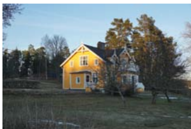
Manbyggnaden på Skarplöt.

Skarplöts tidigaste geografiska placering är oklar, men det är troligt att bebyggelsen låg inom nuvarande område under början av 1800-talet. Marken söder om Skarplöt syns enligt 1638 års karta tillhöra Fors by men impedimentet och möjligen platsen för själva gården ligger då inte inom byns gräns. Vid storskiftet 1773 tillhörde marken gård D i Fors, som var \frac{3}{4} frälsekattehemman under Häringe. På karta över storskiftet är impedimentet tydligt