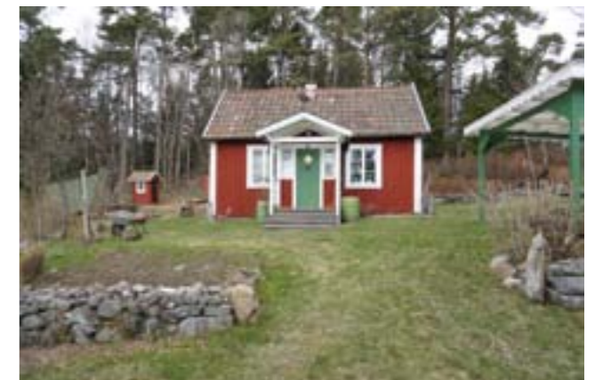
Torpstugan på Övre Marieberg.

Vid Övre Marieberg låg tidigare en smedja. Smedsbostaden finns ännu kvar, här bodde Fors gårds-smed. Smedstugan, som senare har kommit att tillhöra Nedre Marieberg, är kulturhistoriskt mycket intressant med åstak belagt med blandade takplåtar, bland annat smidda, men i stort behov av underhåll.