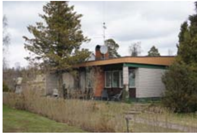
Ett mycket välgestaltat och välbevarat exempel på 1960-talets villaarkitektur.

Mycket tidstypisk villa i nyfunktionalistisk utformning från mitten av 1960-talet. Fasadtegel med medvetna variationer, kontrastverkan mellan fasadteglens olika kulör och sättning men främst mellan den ljusa "mexistenen" och det mörkare träpanelerna samt takfotens gula plåtinklädnad, gröna partier och gröna putsade sockel. Flackt, nästan plant pulpettak samt plantak på vinkelställd byggnadskropp. Tidstypisk trädgårdsplantering med bl.a. vintergröna barrväxter.