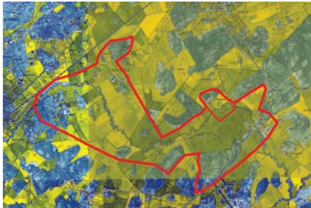
Aktuellt område markerat med rött på Ekonomiskakartan från 1951. Gamla landsvägen mellan Granhammar och Fors är markerad med blått.

karta av ”mossig” äng med skog. Fors har haft stora delar av sina inägor/åkrar söder om bytomten, d.v.s. under och söder om motorvägen, ytor som därför inte inkluderats i det aktuella kulturmiljöområdet.