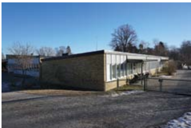
Den nya skolbyggnaden, uppförd 1962.