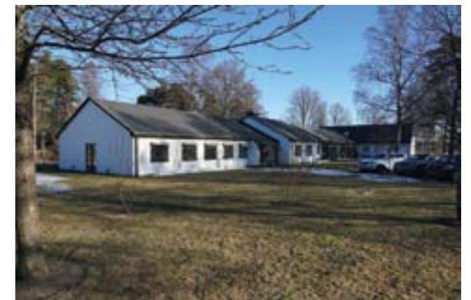
Vänster, överst: Kyrkans norra fasad, med opputsad tillbyggnad från 2005. Foto: Tobias Mårud. Underst: Interiör, foto: Calle Strandh. Höger, uppifrån och ner: Vykort över Västerhaninge 1910, Haninge hembygds-gille. Begravningskapellet från väster med glasad vestibul. Församlingshemmet från sydost. Foto: Tobias Mårud.