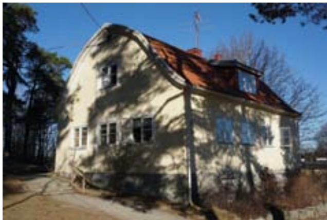
Lärbostaden kan möjligen vara äldre än rektorsbostaden trots liknande utseende.