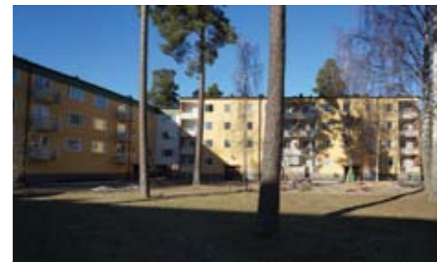
Den andra etappen bildar halvslutna kvarter.