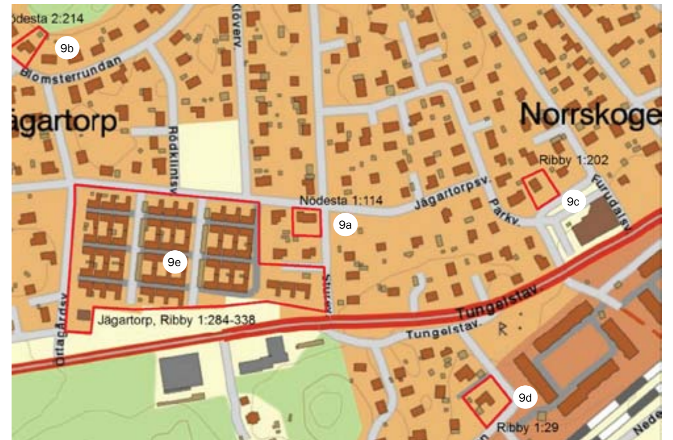
Kartan visar ett utsnitt av centrala Västerhaninge, de aktuella områdena markerat med rött.