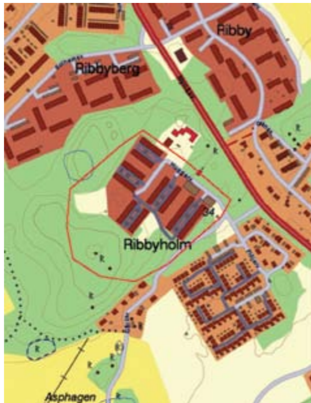
Det aktuella områdets avgränsning är markerat med rött.

Planeringen är något motsägelsefull då den kombinerar ett traditionellt exploateringsstänkande med placering av bebyggelse på impediment, en anpassning till terräng och miljö i utformning och skala samtidigt som området i plan är typiskt för tiden. Det är en modernare tillämpning av det för smalhusbebyggelsen karaktäristiska begreppet ”hus i park” även om terrängen här har bearbetats i högre grad än vad som var brukligt under 1930- och 1940-talet. Den