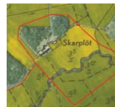
Ekonomien 1951.