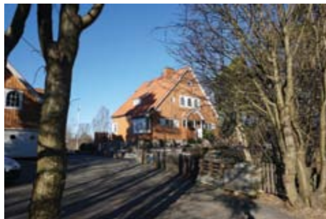
På en liten höjd något skymd av en trädridå och indragen från Nynäsvägen ligger Villa Utansjö, en av Västerhaninges arkitektoniskt mest intressanta byggnader.