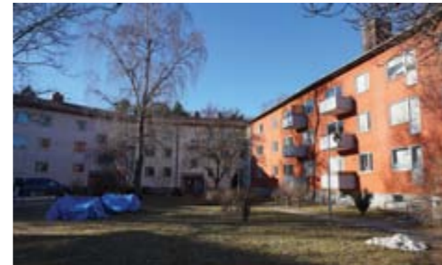
De tidiga byggnaderna bildar nästan slutna kvarter.