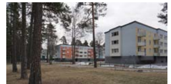
Den tredje etappens byggnader är en tillbakagång till parallellt ställda lameller. Kontakten med skogen och naturen är fortfarande påtaglig.