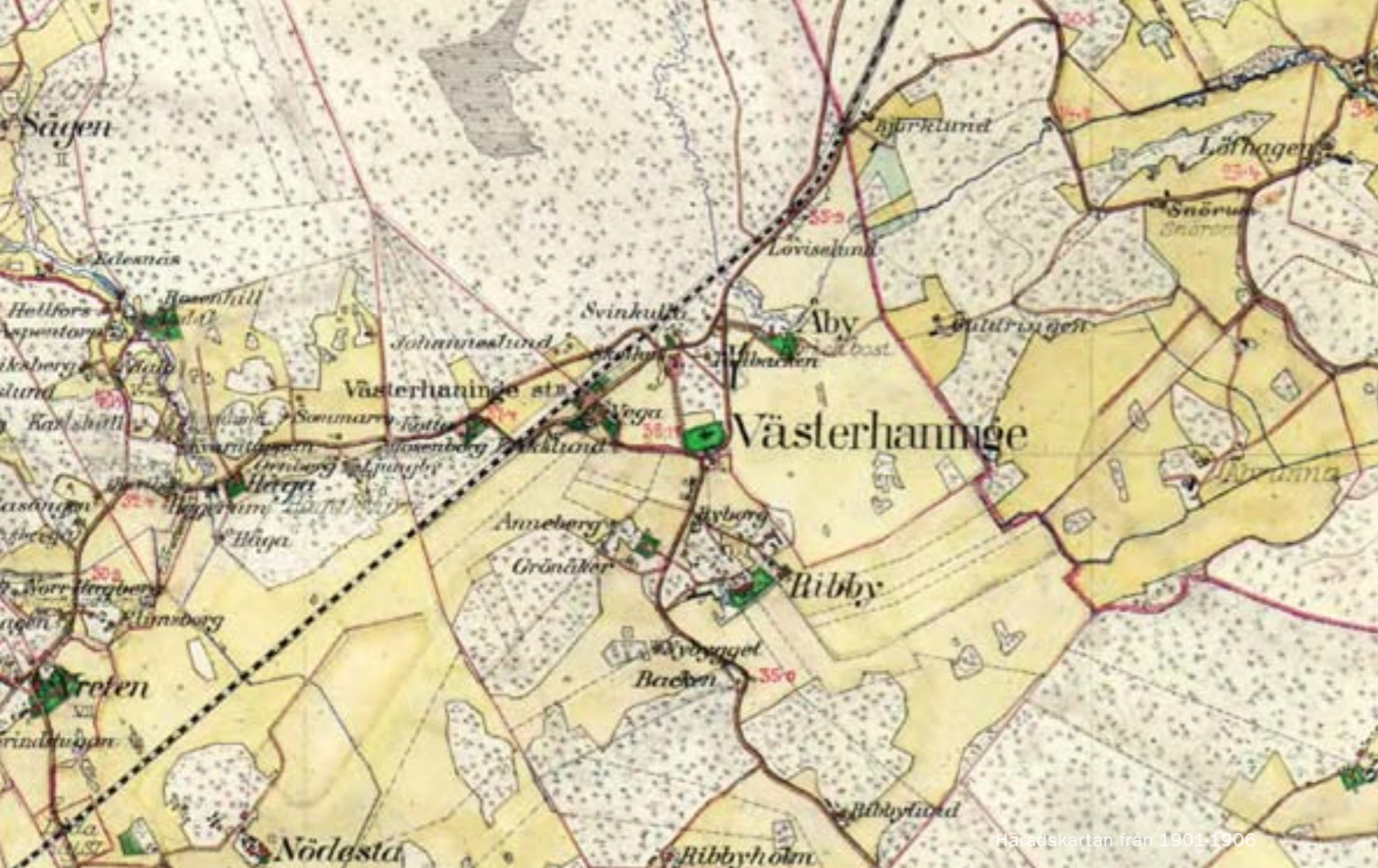
Häradskartan från 1901-1906