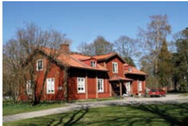
Överst: Kyrkskolan, tidigt 1900-tal, foto: Haningearkivet. Underst: Klockargården idag, foto: Anders Backlund.