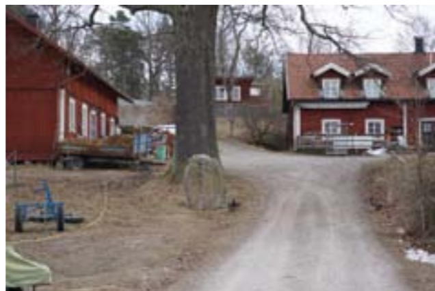
Överste: Manbyggnaden på Fors 1, kallad "Herrgården", skiljer sig markant från övrig bebyggelse med sina putsade fasader och 1930-tals utförande. Nederst: På bilden syns stallet till vänster, "magasinet" till höger och emellan dessa runstenen framför trädet.