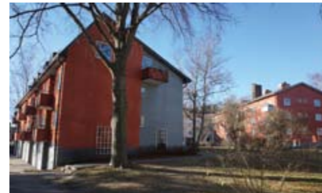
Höjdskillnader har nyttjats för bl.a. garage.