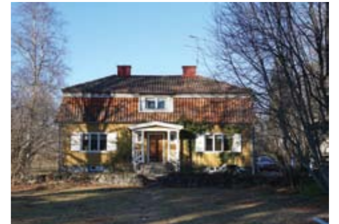
Sörgården från framsidan.