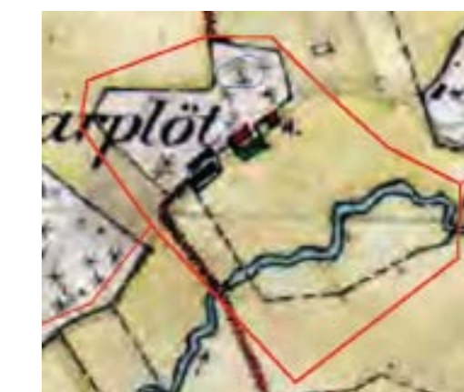
Häradskartan 1901-06.