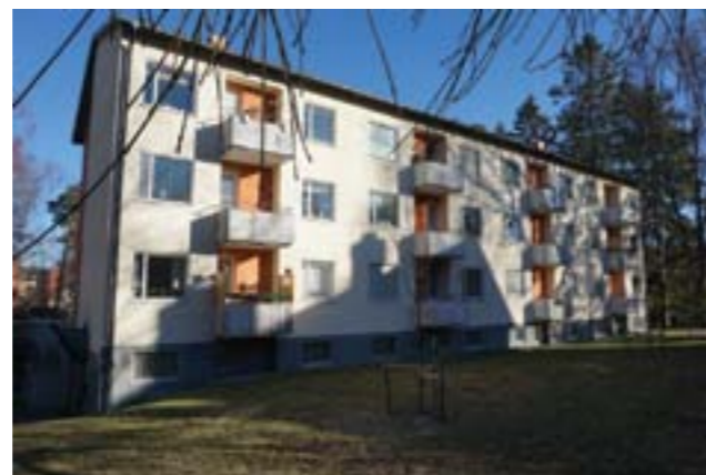
En av byggnaderna från den första etappen.