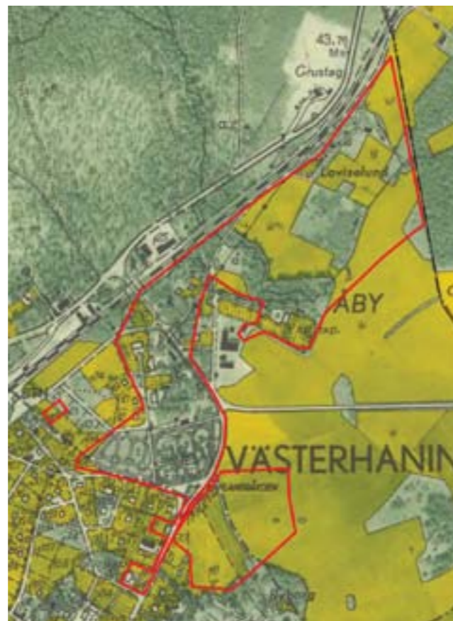
Överst: Det aktuella områdets avgränsning markerat med rött. Nederst: Avgränsningen på Ekonomiska kartan från 1951.

Västerhaninge sockencentrum är en mångfasetterad kulturmiljö med stort tidsdjup och kulturell bredd. Området återspeglar åssträckningens ceremoniella, rituella och praktiska betydelse under mer än 1500 år. Från det förhistoriska Åbygravfältet, etablerat under äldre järnålder, till kyrkans etablering under tidig medeltid, sockencentrumets bevarade bebyggelse med bl.a. ortens första skola och Sotholms tingshus, prästgården, och sedan kommunens övertagande av delar av sockenadministrationen genom gamla kommunhuset. Det finns även en rituellt-ceremoniell kontinuitet in i nutid genom mormontemplet uppförande i närhet till kyrkan.