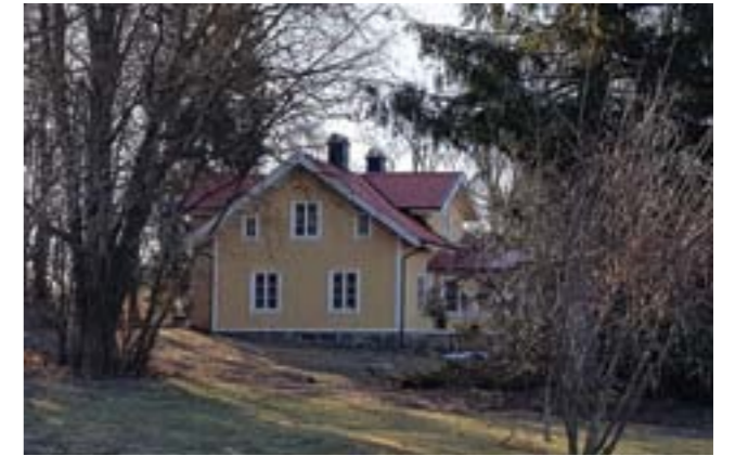
Magnusborg är en relativt stor villa med klassiskt återblickande utseende.

Magnusborg användes under en period av Folkhögskolan som undervisningslokaler.