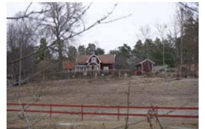
Korpkulla sett från sydväst.

Nuvarande byggnad uppfördes 1927, efter att den tidigare torpstugan Korpkulla revs. Byggnaden är uppförd av "Millimeter-Kalle", lokalt känd för sin noggrannhet och yrkesskicklighet, med samma teknik som i hans egna hus på Tungelstavägen. Han monterade ihop väggsektioner av stående, drevat timmer liggandes på marken, vilka sedan restes och fogades samman. Delar av det rivna torpet återanvändes, bland annat till innerväggar.