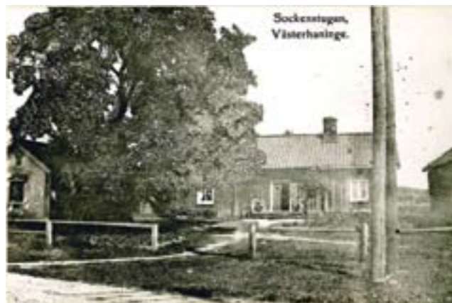
Sockenstugan, riven 1970.