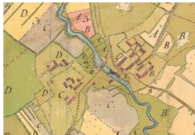
På karta från 1772 finns de fyra gårdarna tydligt benämnda och nu finns även de enskilda byggnaderna utritade.

Häringe och gästgiveriet låg i gården Fors C. Fors B, sedermera kallat Fors 2 eller Östergården flyttade vid laga skiftet mot sydöst, ut från den tidigare bystrukturen. Fors D, vid skiftet benämnt Fors 4 och senare Nyfors flyttade ut till en åkerholme intill nuvarande reningsverket (gården kom längre fram att försvinna men låg innan dess under Berga).