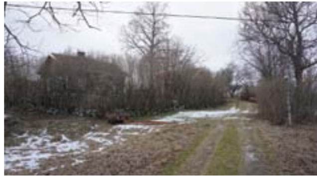
Lindbomsgården till vänster och Minas stuga till höger kan anas bakom växtligheten.

Ursprungligen en av gårdarna på Fors 3, belägen norr om Gästgivargården. Har fått sitt namn efter en familj som brukade gården under många år. På senare tid bodde här skomakaren Nils Rasmussen. Huset intill kallas Minas stuga och ursprungligen var det troligen drängstuga till Lindbomsgården.