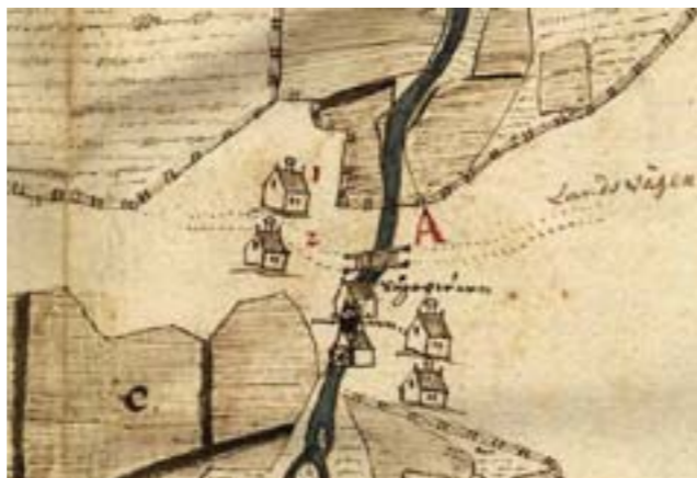
Fyra gårdar, en såg och en kvarn är tydligt utritade på 1638 års karta över Fors.

Fors bestod från åtminstone 1630-talet av fyra gårdar, A och B öster om forsens, C och D väster om den samma. Så förhöll det sig i stort fram till laga skiftet, vilket genomfördes i omgångar mellan ca 1830 och 1860, även om strukturen delvis hade förändrats genom bland annat hemmansklyvningar och storskifte. Även om gården Fors A traditionellt ses som huvudgården i Fors så har de andra gårdarna varit av stor betydelse. Exempelvis så hörde kvarnen under lång tid till gården Fors B, vilken rådde under