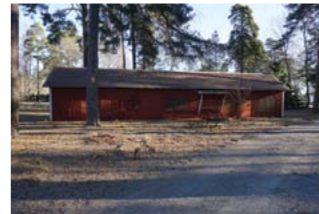
Åby lada.