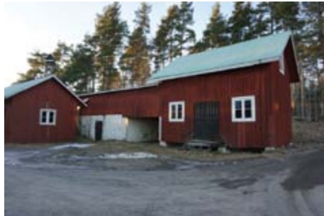
Manbyggnaden och ekonomibyggnader på Skarplöt.