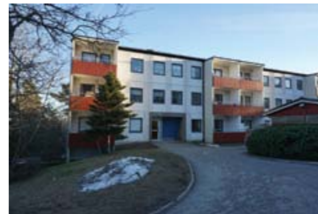
Entrésidorna är försedda med utanpåliggande, inbyggda balkonger.