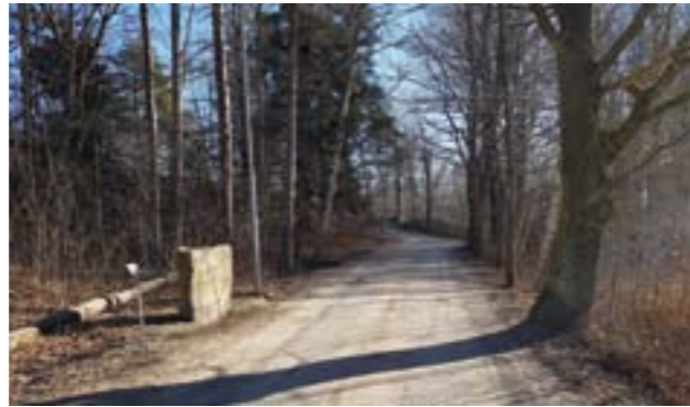
Runstenen vid Blåkullavägen indikerar att sträckningen av vägen till Ribby är den samma som för 1000 år sedan.

Förutom de generella skydd som PBL, tillsammans med PBF, MB och KML omfattar så ska miljön, inklusive bebyggelsen, i egenskap av att den är klassad som särskilt värdefull handläggas enligt PBL 8 kap. § 13 och PBL 9 kap. § 4d.