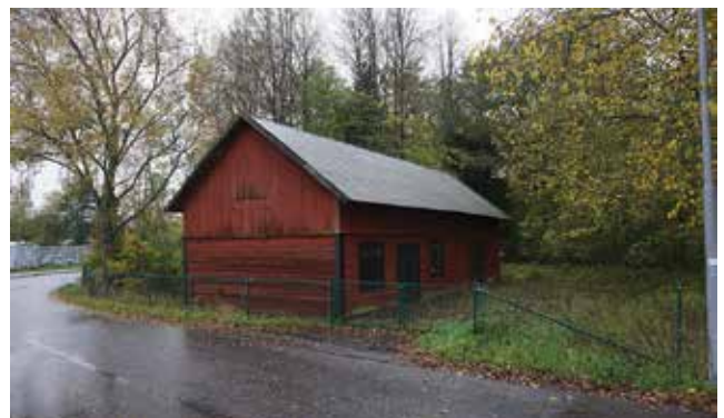
Ekonomibygnad intill Allévågen (Hammar 1:12).