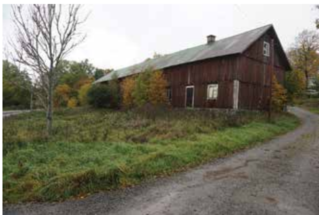
Ekonomibyggnad som tillhört Krigslida gård.

Krigslidas tidigare huvudbyggnad, byggd 1784 (med anor från 1600-talet) av dåvarande komministern i Västerhaninge Peter Lodin, förstördes i en brand på 1990-talet. Av gårdens bebyggelse finns idag två ekonomibyggnader kvar.