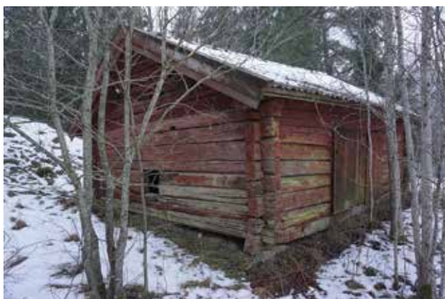
Ekonomibygnad intill Söderbyvägen (Tungelsta 1:5).