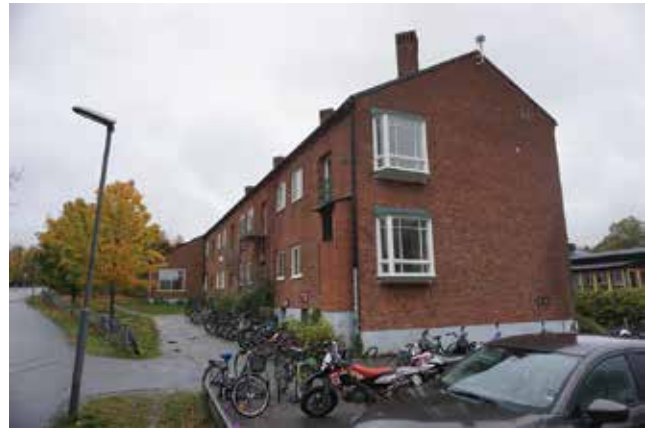
Tungelsta skola.

Tungelsta skola uppfördes 1951. Sedan dess har byggnaden byggts om och till i omgångar och flera nya byggnader har tillkommit. Den äldsta delen har dock mycket av sin karaktär bevarad och detaljer som franska balkonger med fint utformade smidesräcken och burspråk. Karaktäristiskt är också de röda tegelfasaderna, skorstenarna och sadeltaket.