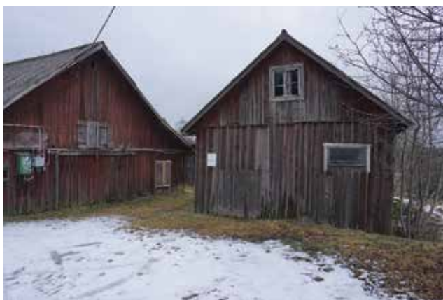
Two tvärställda lador med iögonfallande placering intill Söderbyvägen (Tungelsta 2:10).