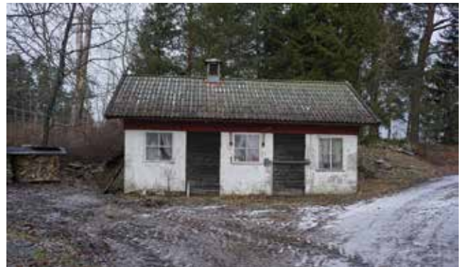
Svinstia och höns hus, Tungelsta 9:1.