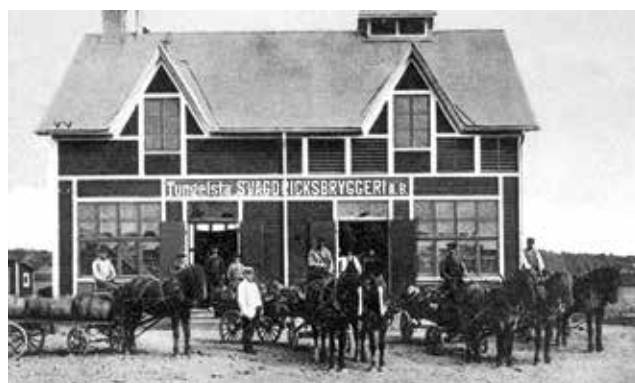
Tungelsta svagdrycksbryggeri 1913.

Under andra hälften av 1900-talet kom förutsättningarna för trädgårdsnäringen att förändras. Antalet trädgårdsmästerier minskade successivt, växthusen förföll och många revs till förmån för nyetablerade bostadsområden. Norr om järnvägen har bebyggelsen idag