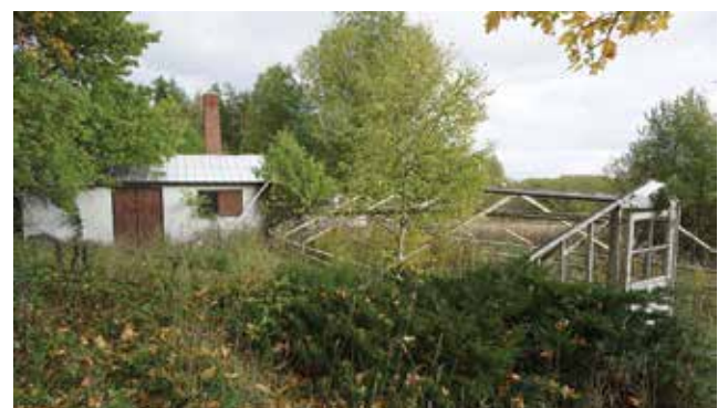
Växthusrester vid Stenvreten, Tungelsta 1:20.