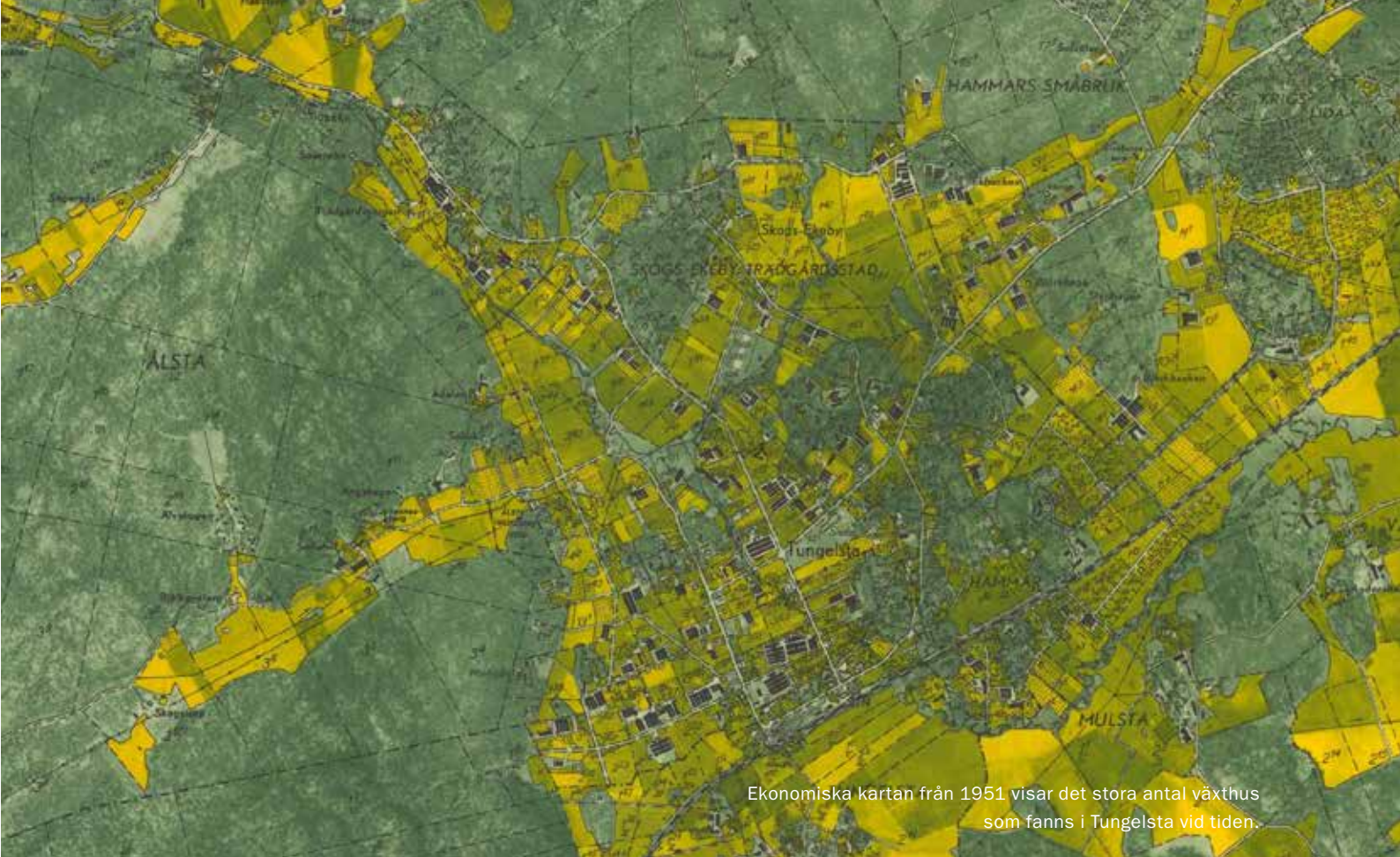
Ekonomiska kartan från 1951 visar det stora antal växthus som fanns i Tungelsta vid tiden.

sina varor in till Stockholm. Några år efter järnvägens invigning började Hem på Landet köpa upp mark i och kring Tungelsta för att sälja tomter till handelsträdgårdar och egna hem. Tungelsta stationshus har både ett arkitekturhistoriskt värde och ett samhällshistoriskt värde. Byggnaden är ritad av Ferdinand Boberg (1860-1946) som var en av sin tids mest framstående arkitekter.