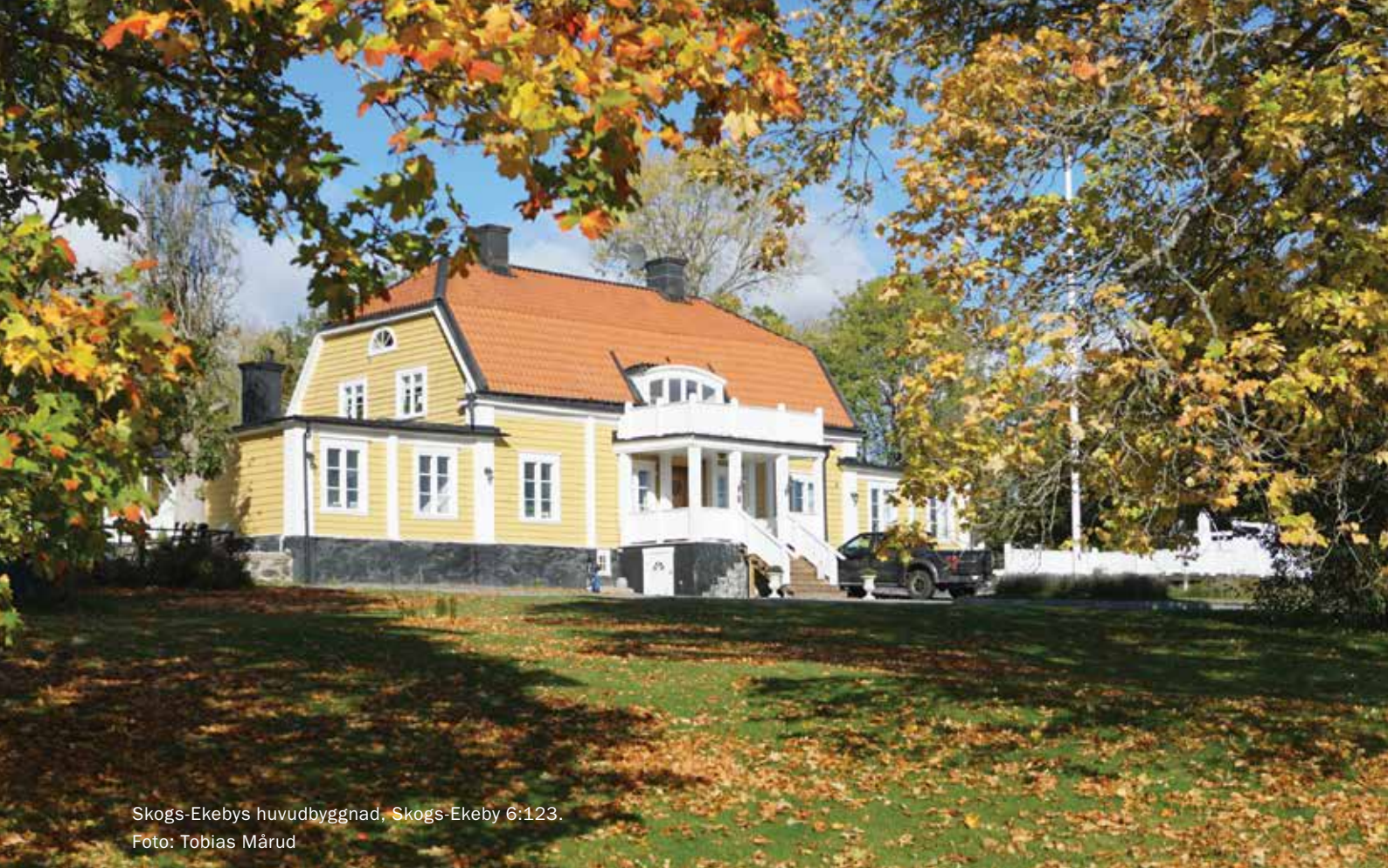
Skogs-Ekebys huvudbyggnad, Skogs-Ekeby 6:123.

och marken såldes till Hem på Landet som sedan sålde tomter fram till 1920-talet i det som blev Skogs-Ekeby trädgårdsstad. Huvudbyggnaden har genomgått flera förändringar. Karaktäristiskt är bland annat det valmade mansardtaket, skorstenarnas placeringar och de låga flygeltillbyggnaderna. I trädgården finns bland annat hamlade träd.