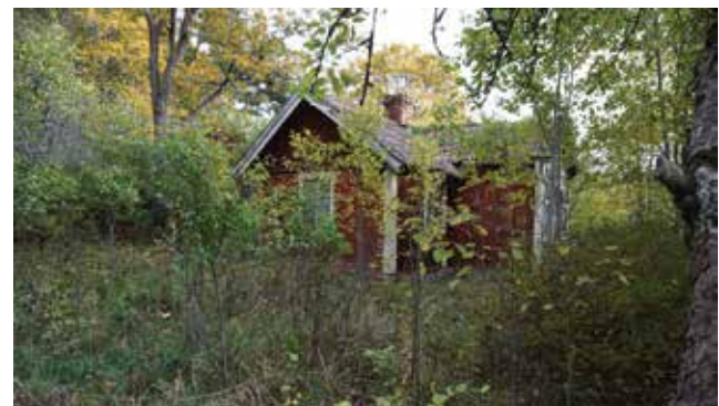
Boningshus på Stenvreten.

Vid Stenvreten finns ett mindre boningshus, en ekonomibyggnad, en källarbod och delar av växthus med tillhörande pannhus. Boningshuset, källarboden och ekonomilängan syns på den häradsökonomiska kartan från tidigt 1900-tal. Stenvreten är ett exempel på ett för Haninge typiskt blandbruk där alla inkomstkällor tillvaratagits, i det här fallet växthusodling.