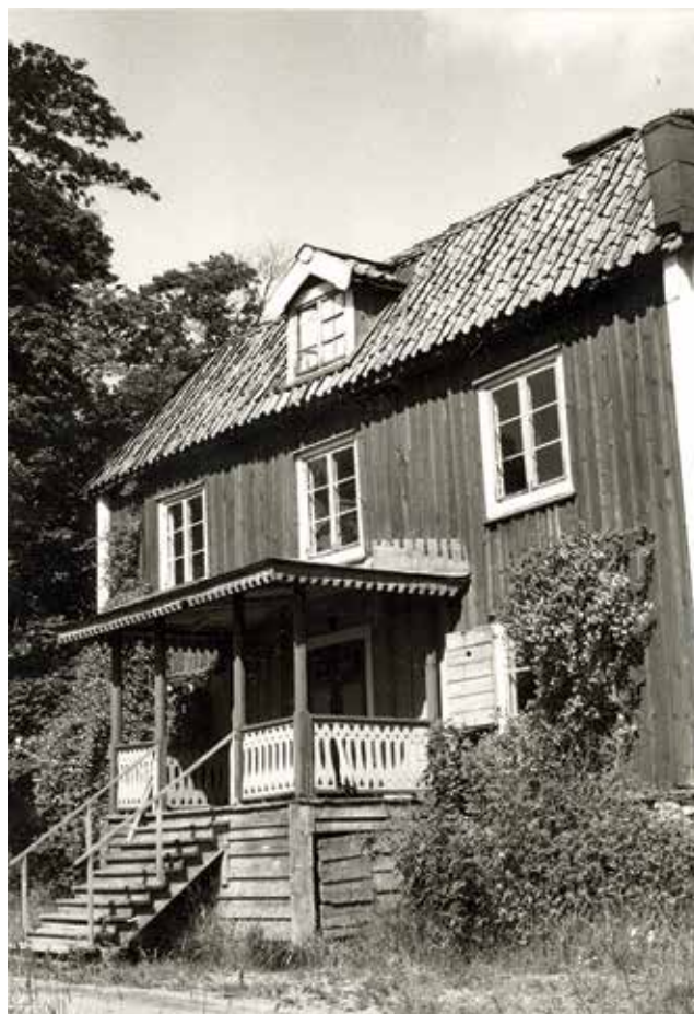
Huvudbyggnaden på Krigslida gård, fotograferad 1965.