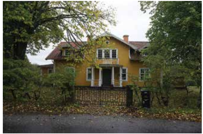
Ålsta 3:54, fotograferat från Kvarnvägen.