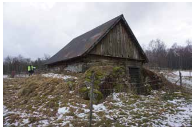
Källarbod på Välsta 2:16.