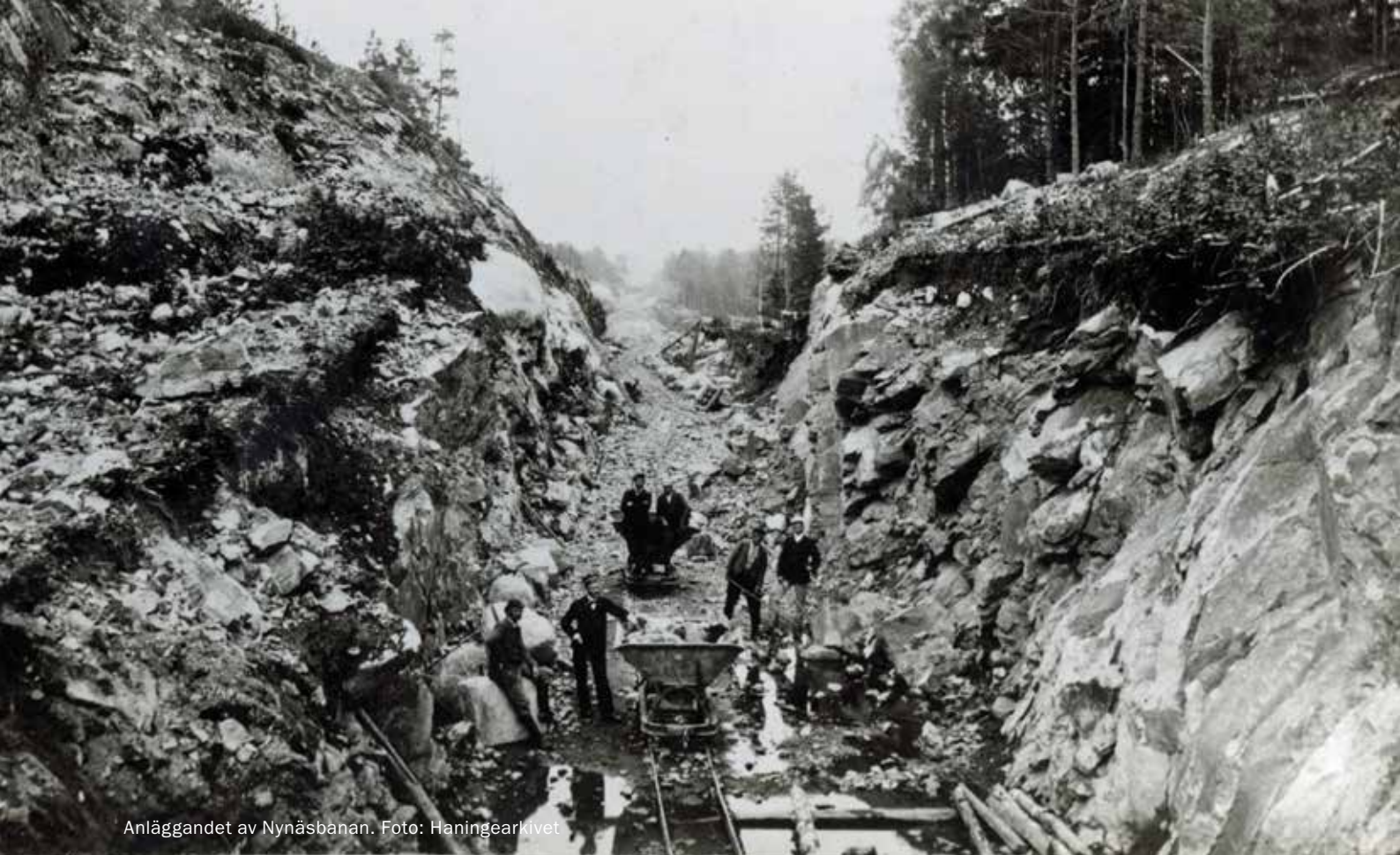
Anläggandet av Nynäsbanan.