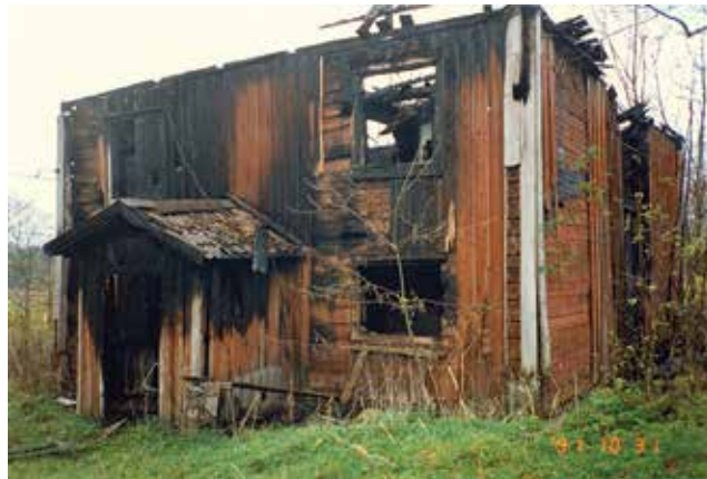
Huvudbyggnaden brann ner 1991.