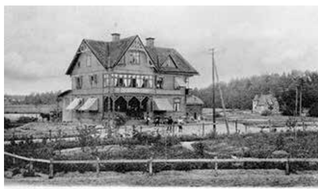
Carlssons villa i Tungelsta, ca 1900.

en varierad struktur, blandad med tonvikt på småhus. Begränsade områden med högre exploateringsstal ligger som enklaver på mark som tidigare rymt växthus. Äldre strukturer, om än från olika tidsperioder, är uttydbara kring främst Skogs Ekeby och Hammar.