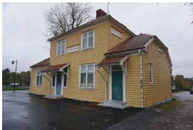
Tungelsta stationshus.