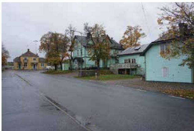
Vy mot stationen från Södertäljevägen. Mitt i bild syns den f.d. affären, Ålstalund (Ålsta 8:1), som är kraftigt ombyggt.