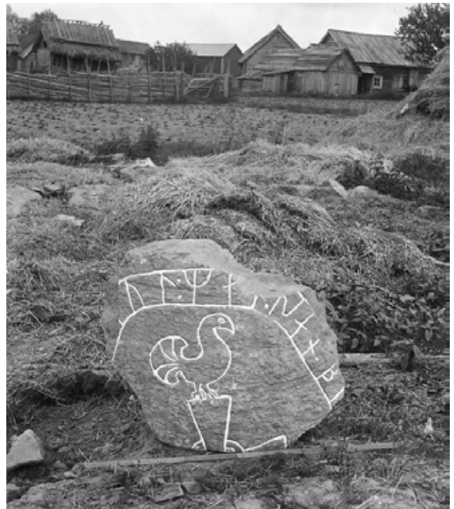
Tungelsta by och runstensfragmentet Sö 245. Foto: Erik Brate, ca 1900 (Kulturmiljöbild).

Vägen har troligen anor från järnåldern och utgör en del av det gamla landsvägsnätet genom socknen. Under sin sträckning genom bygden passerar vägen flera fornlämningar och historiska lämningar som troligen har anlagts på dessa ställen just som ett resultat av vägens sträckning.