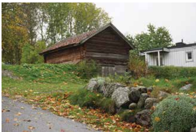
Ekonomibyggnad (Hammars småbruk 30:4) som tillhört Krigslida gård. Modern bostadsbebyggelse har uppförts intill.