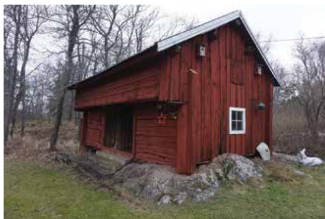
Loftboden vid Oppgården (Mulsta 2:3).