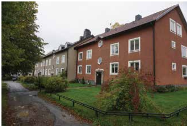
Krigslida 7:1.

Exempel på en villa uppförd efter ritningar daterade 1964. Tidstypiskt och karaktäristiskt är att byggnaden är i ett plan med källare och entré en halvtrappa upp, sadeltak, gul tegelfasad, trappans smidesräcke, ursprunglig ytterdörr och fönstrens form och placeringar.