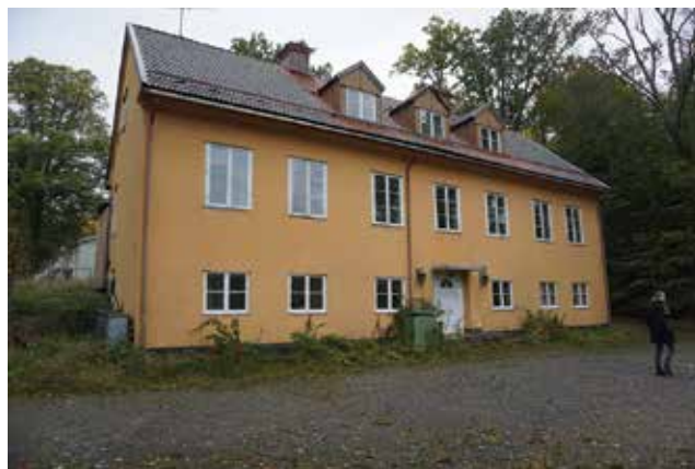
Hammarbo (Hammar 1:11).