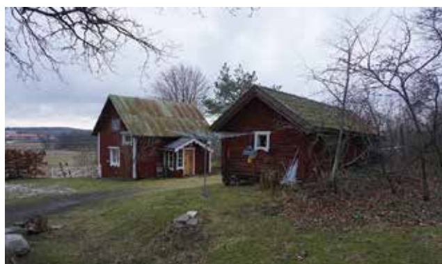
Den timrade boden vid Oppgården framför ett mindre bostadshus (Mulsta 2:7).