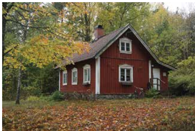
Vreta 1:58.

Torp med bevarade äldre, enkel karaktär. Karaktäristiskt är det tegelklädda sadeltaket, rödfärgad panel, naturstensgrund och befintliga fönster med tillhörande snickerier.