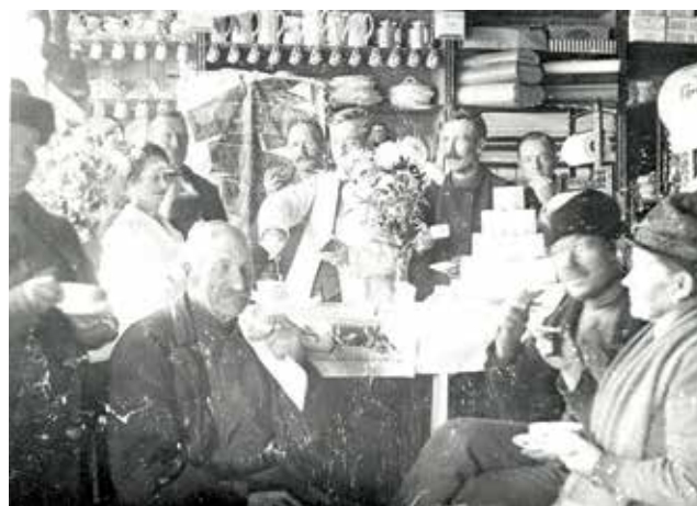
Handelsboden i Tungelsta ca 1900.

Förutom de generella skydd som PBL, tillsammans med PBF, MB och KML omfattar så ska miljön, inklusive bebyggelsen, i egenskap av att den är klassad som särskilt värdefull handläggas enligt PBL 8 kap. § 13 och PBL 9 kap. § 4d.