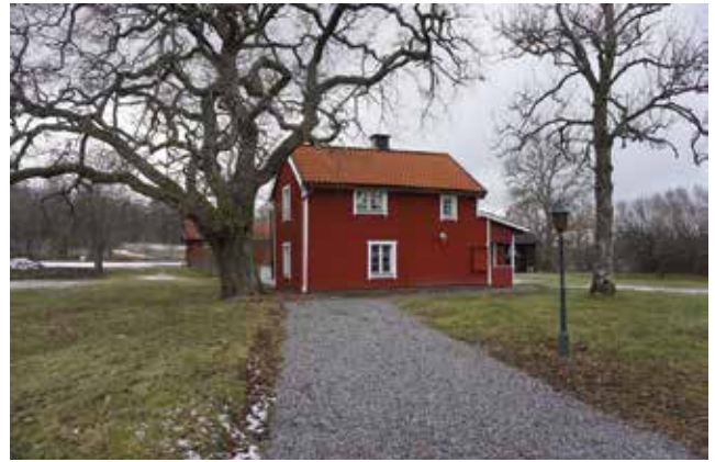
Äldre bostadshus med moderniserat skal (Välsta 2:16).

Bebyggelsen på Södergården är till största delen ersatt med moderna hus. Undantaget är en välbevarad parstuga från andra hälften av 1800-talet (Välsta 4:3) samt tre ekonomibyggnader. Boningshuset, som täcks av ett mansardtak klätt med enkupigt tegel, står på en naturstensgrund och