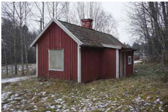
Ett litet bostadshus på Tungelsta 2:10.

På södra sidan vägen men på samma fastighet ligger två mindre bostadshus och en bit ifrån en enkel kombinerad tvättstuga och torklada vilken uppvisar spår av enklare maskinell drift. I anslutning till bebyggelsen på Tungelsta 2:10 finns en välbevarad timrad bod på södra sidan av Söderbyvägen, fastigheten Tungelsta 1:5 är dock uppkommen ur Västergården.