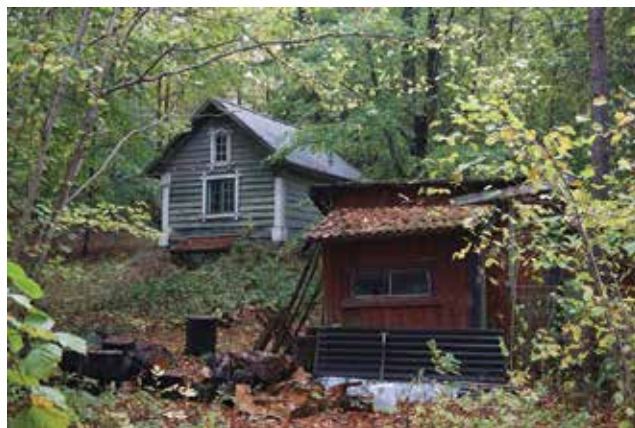
Byggnad med grönmålad panel och profilsågade snickerier (Hammar 1:12).

1832 uppfördes ett bostadshus, Hammarbo (Hammar 1:11), strax väster om Hammars huvudbyggnad. Det styckades av från Hammar 1914 och har sedan 1920-talet fungerat som bl a pensionat, vårdhem och behandlingshem. Byggnaden har genomgått flera förändringar men har ett miljöskapande värde. I trädgården, som har sträckt sig från byggnaden och ner till Allévägen, finns bland annat fruktträd.