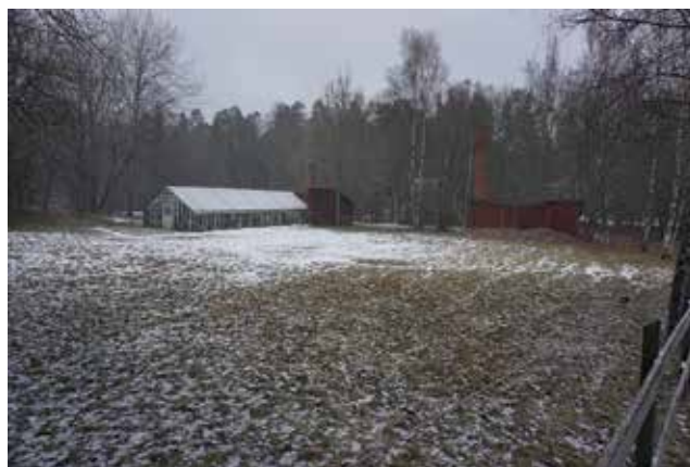
Bild. Växthus på Vreta 1:9. Foto taget från Tungelstavägen.

En bevarad torklada finns vid Fridhem (Hammars småbruk 33:1). Byggnaden har de karaktäristiska vädringsluckorna i fasaden. Boningshuset uppfördes enligt uppgift 1922.