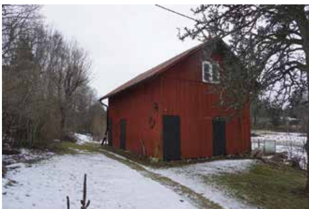
En multifunktionell ekonomibygnad vid Östergården (Tungelsta 2:140).