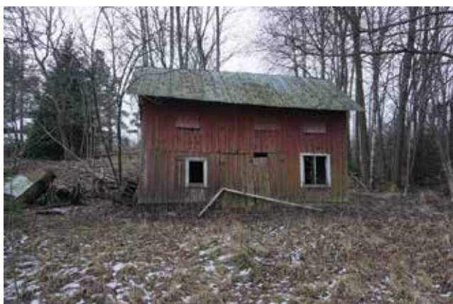
Tvättstuga med tork på övervåningen (Tungelsta 2:10).