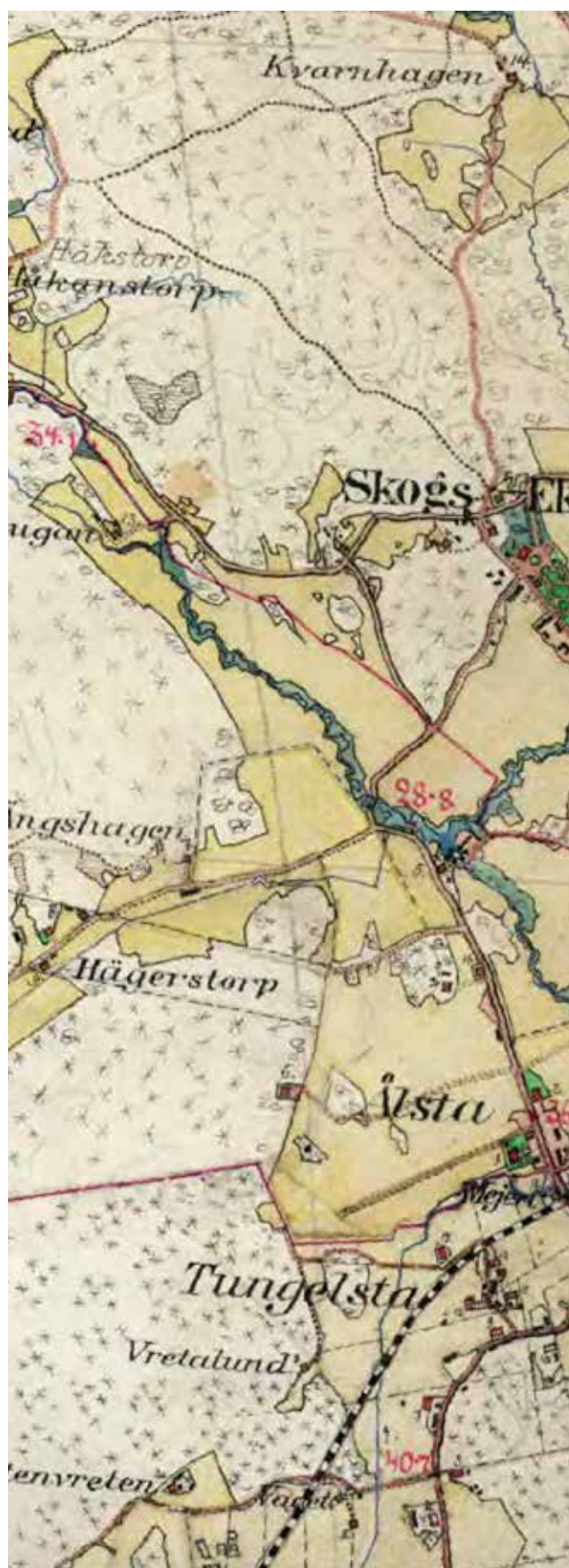
Häradsekonomska kartan från 1901-1906.

Området delades under tidig historisk tid av ett antal byar och gårdar, Tungelsta by i söder, Vålsta och Mulsta i sydöst, Ålsta i nordväst, Skogs Ekeby i norr och Tuna