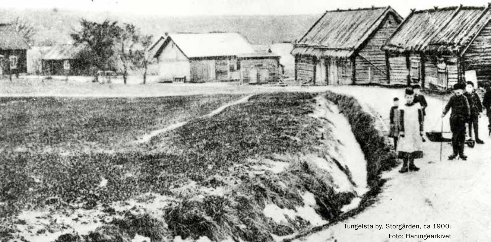
Tungelsta by, Storgården, ca 1900.