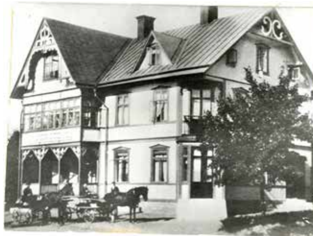
Ålsta 8:1, tidigt 1900-tal.