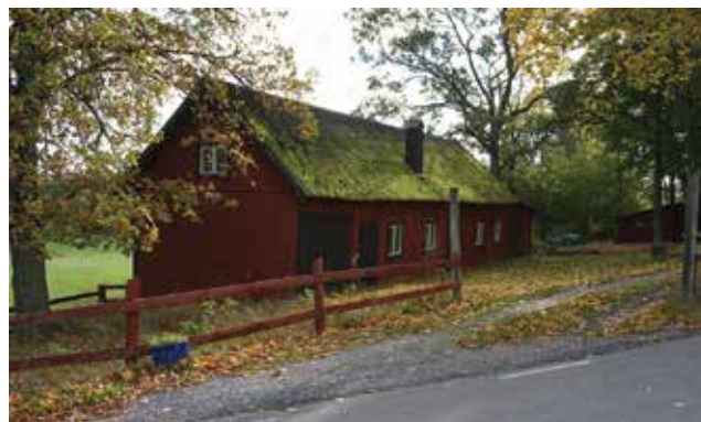
Ekonomibygnad längs Skogs-Ekebyvägen (Skogs-Ekeby 6:126).