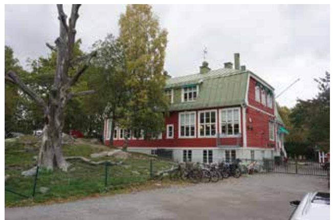
Bild. Tungelsta gamla skola, Skogs-Ekeby 6:78.

Byggnaden är i en och en halv våning med källare. Taket är brutet och valmat och täckt med plåt. Fasaden är klädd med liggande röd panel. Knutar, våningsband och fönstersnickerier är vita. Byggnaden karaktäriseras av de stora fönstren, som är ursprungliga och skulle förse klassrummen med rikligt dagsljus. Byggnadens utformning är typisk för både sin funktion och tid och används fortfarande som skola.