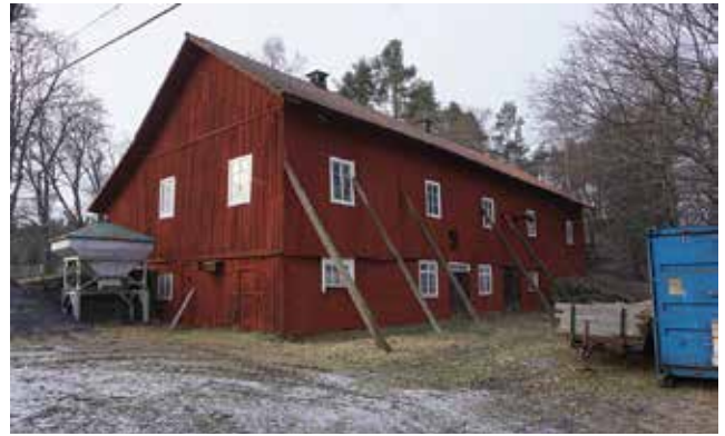
Ladugård och loge, Tungelsta 9:1.

Lägenheten Vadet styckades av från Tungelsta och Ålsta 1909. På den häradsekonomska kartan från tidigt 1900-tal finns endast två boningshus i Vadet, men under 1900-talet har flera byggnader tillkommit. Idag finns några välbevarade ekonomibygnader kvar, uppförda en bit in på 1900-talet. En av dessa är en ladugård och loge med rödfärgad träpanel och tegelklätt sadeltak. En mindre byggnad har fungerat som svinstia och höns hus. Ytterligare två ekonomibygnader har en äldre karaktär bevarad.