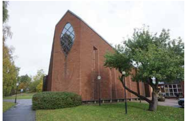
Tungelsta kyrka.

Kyrkan har en kvadratisk planform med avfasade hörn i söder och norr, vilket ger byggnaden dess karaktäristiska form. Rosen, ett motiv kopplat till Tungelstas handels-trädgårdar, återkommer i kyrkan, till exempel i det södra fönstret och i den södra fasadens murverk. En öppen klockstapel i trä står söder om kyrkan.