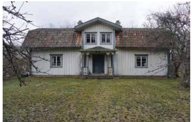
Det bevarade äldre bostadshuset på Södergården, parstuga på Välsta 4:3.