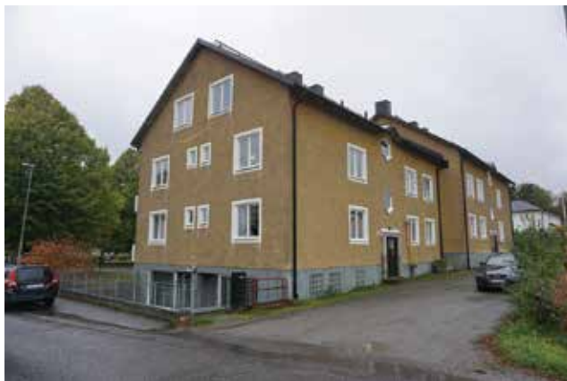
Krigslida 5:21.