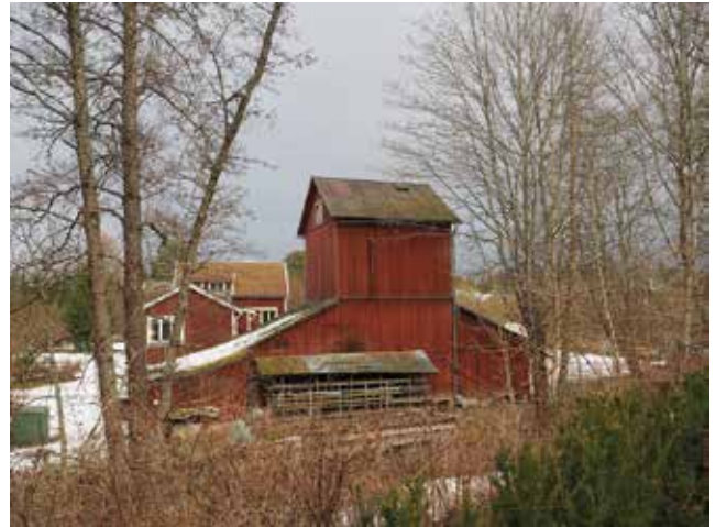
Vattentornet som försåg växthuset med vatten, Ålsta 1:22. Foto taget från kyrkogården i väster.