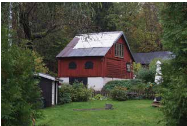
Byggnad på Hammar 11:2.