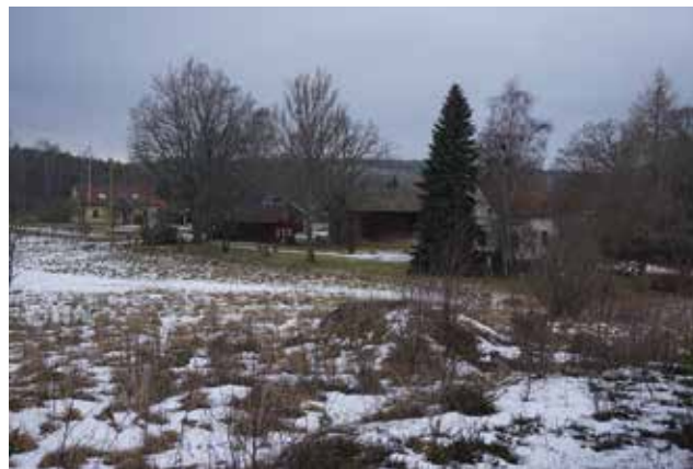
Vy ned mot Västergården.