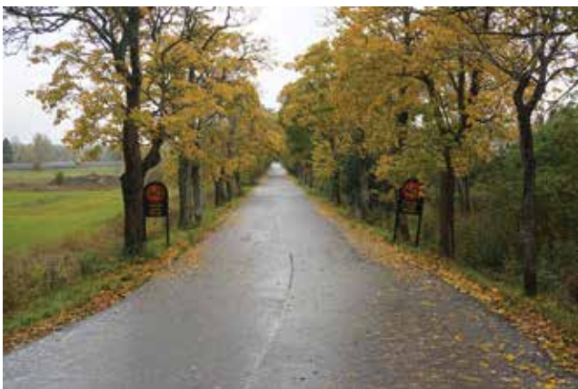
Allén mellan Hammar och Krigslida som planterades under 1800-talet. Foto taget mot väster.

På intilliggande fastighet (Hammar 11:2) finns ytterligare några äldre byggnader bevarade, bland annat en magasinsbyggnad.