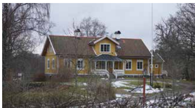
Länsmansbostället (Mulsta 1:7).