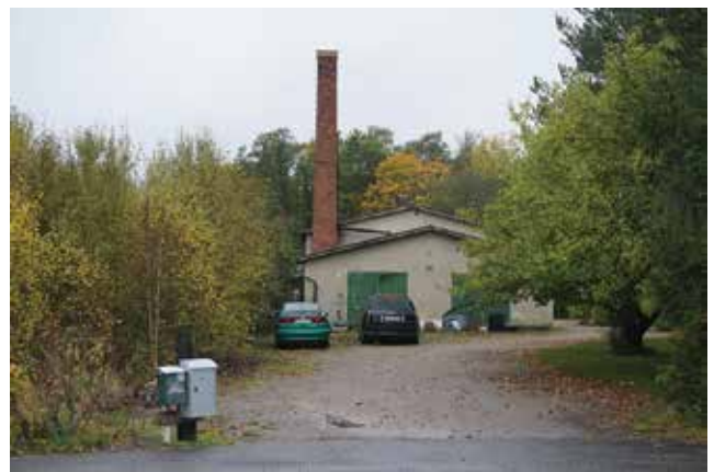
På Ålsta 1:22 finns spår av den handelsträdgård som tidigare bedrevs här.