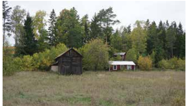
Torklada och två mindre byggnader på Hammars småbruk 33:1.

PBL 2 kap. 6 §, PBL 8 kap. 14 § och PBL 8 kap. 17 §.