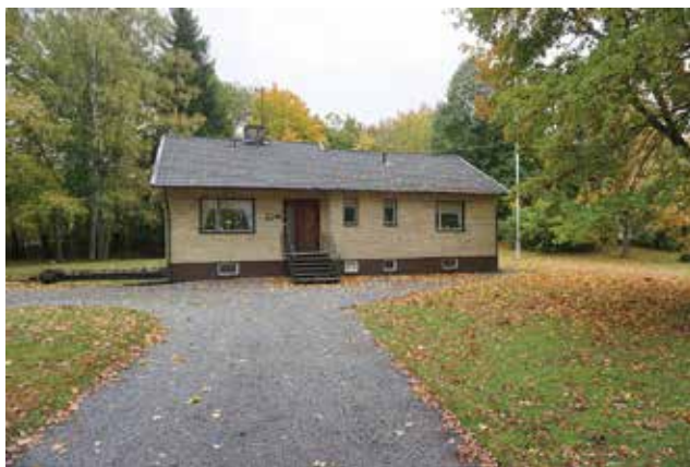
Skogs-Ekeby 4:1.