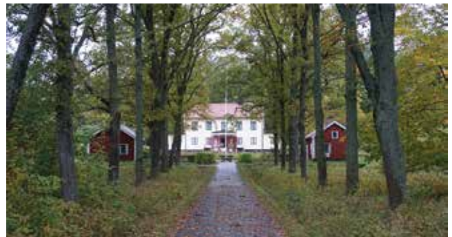
Huvudbyggnaden och flyglarna på Hammar (Hammar 1:12).

Utöver den bevarade huvudbyggnaden med flyglar finns också en liten byggnad med grönmålad liggande panel och profilsågade snickerier, en magasinsbyggnad och en timrad rödfärgad ekonomibygnad intill Allévågen kvar av gårdens bebyggelse (Hammar 1:12). På tomten finns också en minnessten som Frans Upmark lät resa över