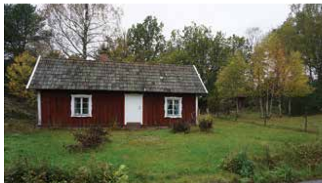
Hagstugan, eller Kroken, Skogs-Ekeby 6:37.

Skogs Ekebyvägen är en del av den gamla häradsvägen och har till stor del kvar sin äldre sträckning. Längs med vägen går det att följa utvecklingen i Skogs-Ekeby och i Tungelsta i stort. Här finns några äldre ekonomibygnader bevarade (bland annat Skogs-Ekeby 6:126) liksom delar av jordbrukslandskapet. En bit norr om Skogs-Ekebys huvudbyggnad finns en aktiv handelsträdgård med växthus (Skogs-Ekeby 6:15) som visar den utveckling som skedde under 1900-talets första hälft.