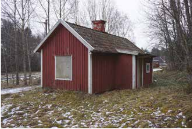
Ett litet bostadshus på Tungelsta 2:10.

På södra sidan vägen men på samma fastighet ligger två mindre bostadshus och en bit ifrån en enkel kombinerad tvättstuga och torklada vilken uppvisar spår av enklare maskinell drift. I anslutning till bebyggelsen på Tungelsta 2:10 finns en välbevarad timrad bod på södra sidan av Söderbyvägen, fastigheten Tungelsta 1:5 är dock uppkommen ur Västergården.