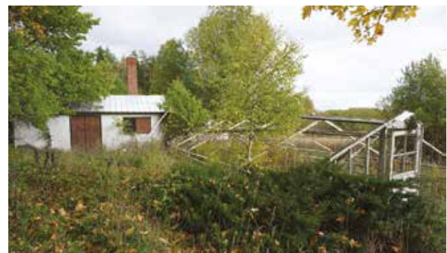
Växthusrester vid Stenvreten, Tungelsta 1:20.