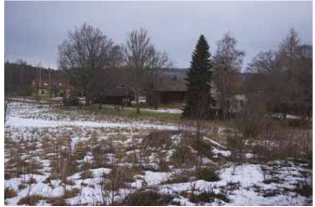
Vy ned mot Västergården.