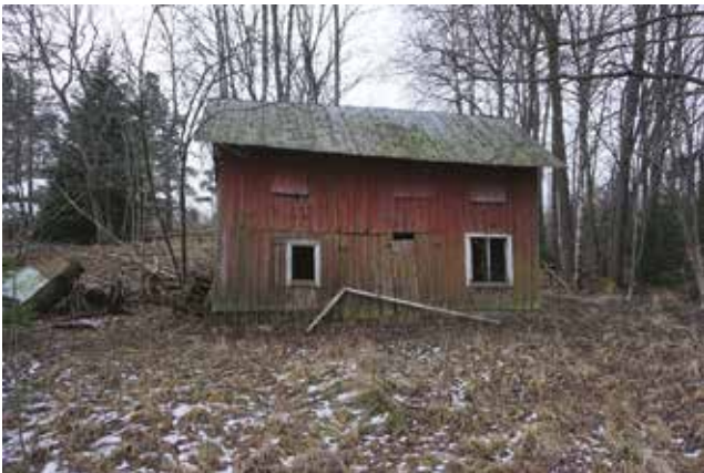
Tvättstuga med tork på övervåningen (Tungelsta 2:10).