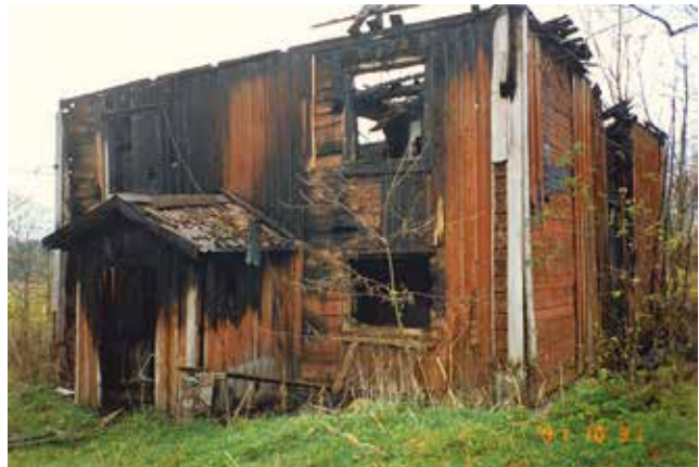
Huvudbyggnaden brann ner 1991.