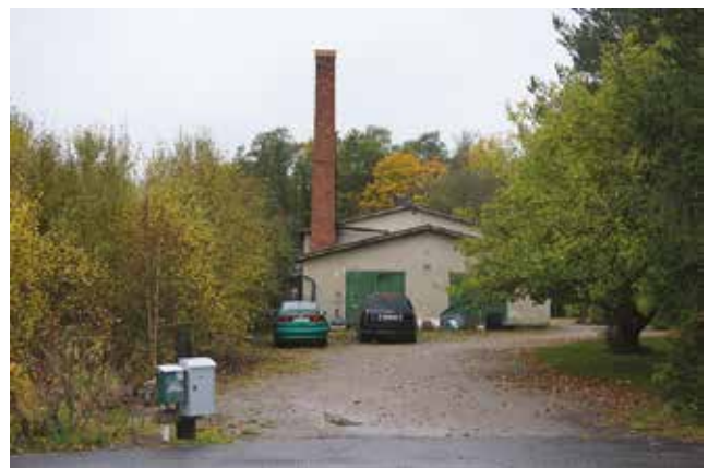
På Ålsta 1:22 finns spår av den handelsträdgård som tidigare bedrevs här.