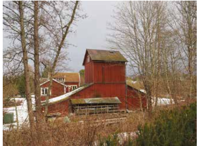
Vattentornet som försåg växthuset med vatten, Ålsta 1:22. Foto taget från kyrkogården i väster.