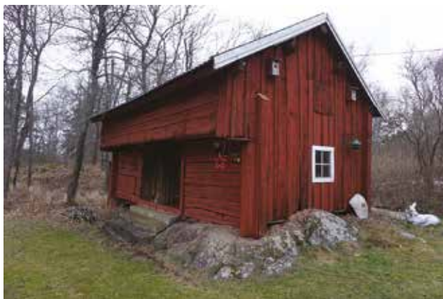
Loftboden vid Oppgården (Mulsta 2:3).