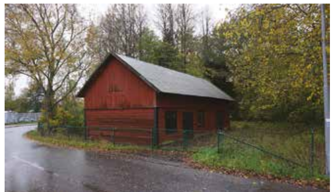
Ekonomibygnad intill Allévågen (Hammar 1:12).