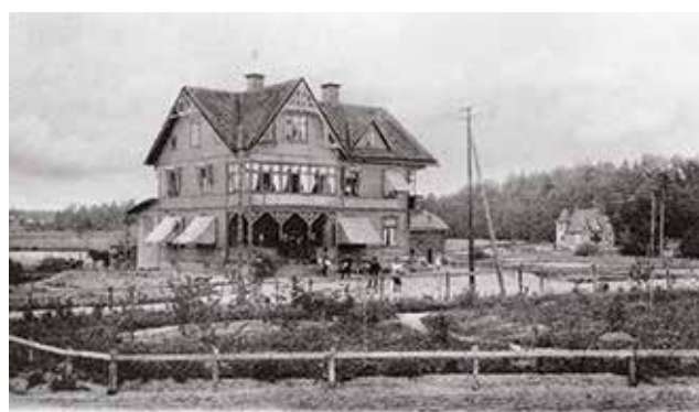
Carlssons villa i Tungelsta, ca 1900.

som enklaver på mark som tidigare rymt växthus. Äldre strukturer, om än från olika tidsperioder, är uttydbara kring främst Skogs Ekeby och Hammar.