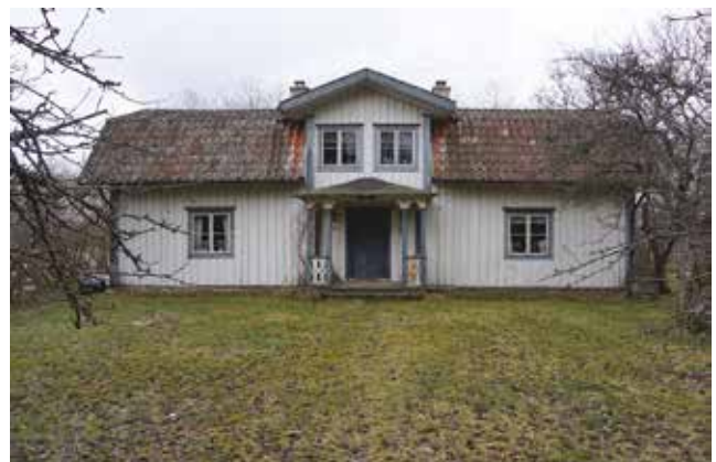
Det bevarade äldre bostadshuset på Södergården, parstuga på Vålsta 4:3.