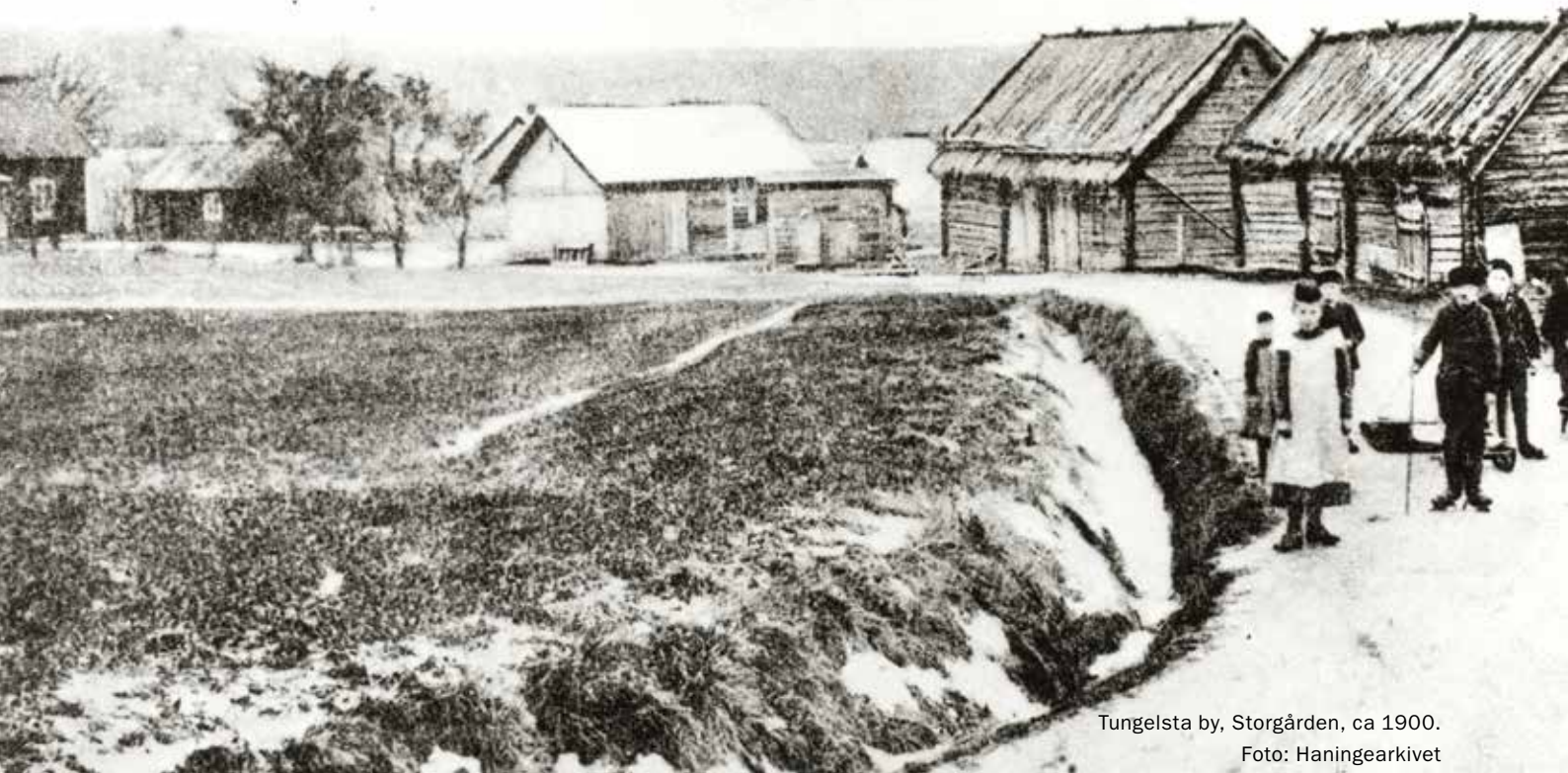
Tungelsta by, Storgården, ca 1900.