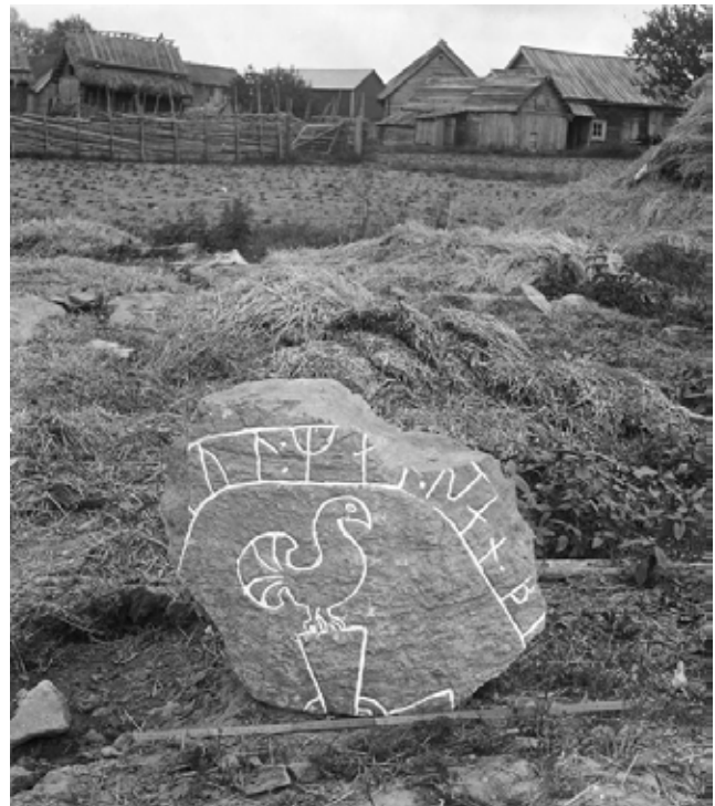
Tungelsta by och runstensfragmentet Sö 245. Foto: Erik Brate, ca 1900 (Kulturmiljöbild).

Väster om Lillgården, vid Vadet, passerar vägen mellan två gravfält – troligen tillhörande Tungelsta by – med åtta och