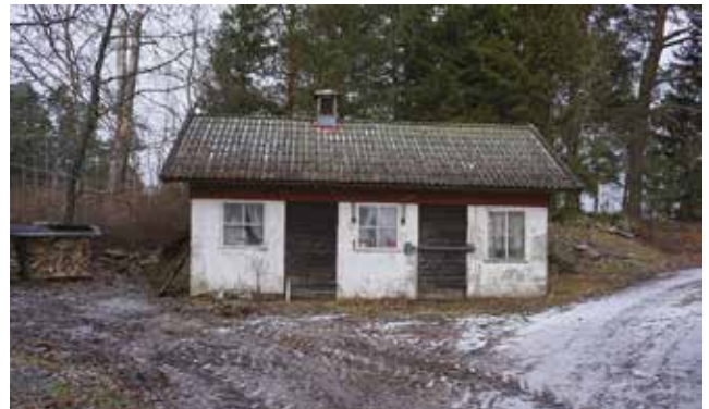
Svinstia och höns hus, Tungelsta 9:1.