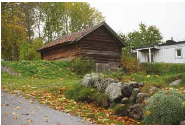
Ekonomibyggnad (Hammars småbruk 30:4) som tillhört Krigslida gård. Modern bostadsbebyggelse har uppförts intill.