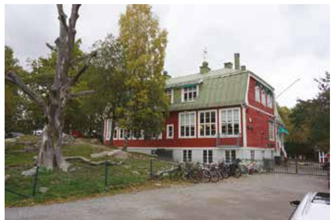
Bild. Tungelsta gamla skola, Skogs-Ekeby 6:78.

Byggnaden är i en och en halv våning med källare. Taket är brutet och valmat och täckt med plåt. Fasaden är klädd med liggande röd panel. Knutar, våningsband och fönstersnickerier är vita. Byggnaden karaktäriseras av de stora fönstren, som är ursprungliga och skulle förse klassrummen med rikligt dagsljus. Byggnadens utformning är typisk för både sin funktion och tid och används fortfarande som skola.