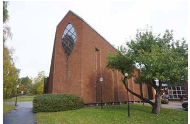
Tungelsta kyrka.

Kyrkan har en kvadratisk planform med avfasade hörn i söder och norr, vilket ger byggnaden dess karaktäristiska form. Rosen, ett motiv kopplat till Tungelstas handels-trädgårdar, återkommer i kyrkan, till exempel i det södra fönstret och i den södra fasadens murverk. En öppen klockstapel i trä står söder om kyrkan.