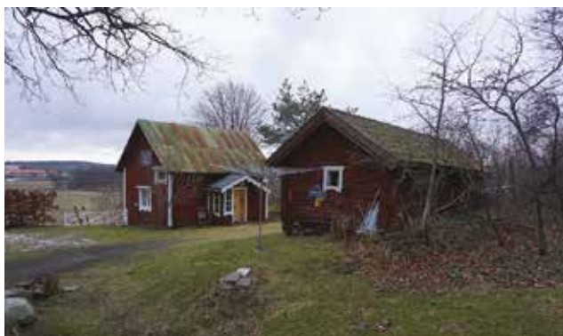
Den timrade boden vid Oppgården framför ett mindre bostadshus (Mulsta 2:7).