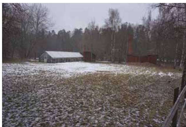
Bild. Växthus på Vreta 1:9. Foto taget från Tungelstavägen.

En bevarad torklada finns vid Fridhem (Hammars småbruk 33:1). Byggnaden har de karaktäristiska vädringsluckorna i fasaden. Boningshuset uppfördes enligt uppgift 1922.