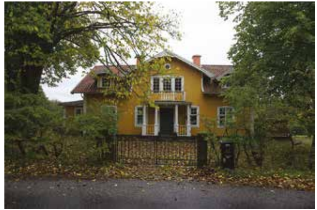
Ålsta 3:54, fotograferat från Kvarnvägen.