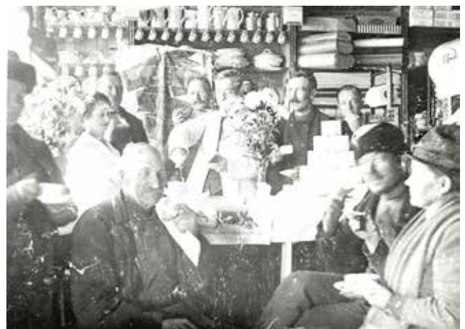
Handelsboden i Tungelsta ca 1900.

Förutom de generella skydd som PBL, tillsammans med PBF, MB och KML omfattar så ska miljön, inklusive bebyggelsen, i egenskap av att den är klassad som särskilt värdefull handläggas enligt PBL 8 kap. § 13 och PBL 9 kap. § 4d.