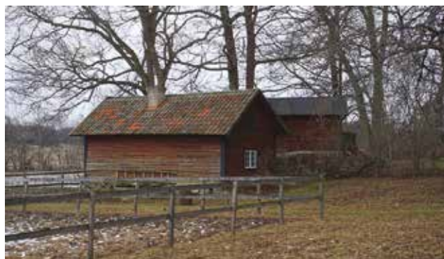
Tvättstuga och drängstuga på Vålsta 4:3 och 4:4.