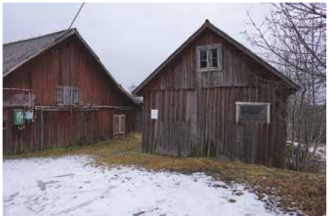
Two tvärställda lador med iögonfallande placering intill Söderbyvägen (Tungelsta 2:10).