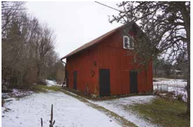
En multifunktionell ekonomibygnad vid Östergården (Tungelsta 2:140).