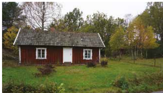
Hagstugan, eller Kroken, Skogs-Ekeby 6:37.

Krigslida bildades senast under 1500-talet och blev