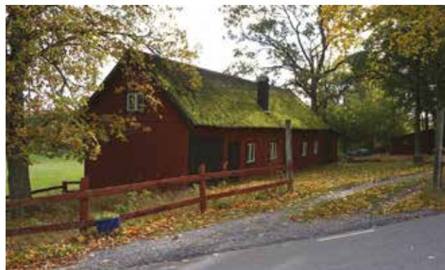
Ekonomibygnad längs Skogs-Ekebyvägen (Skogs-Ekeby 6:126).