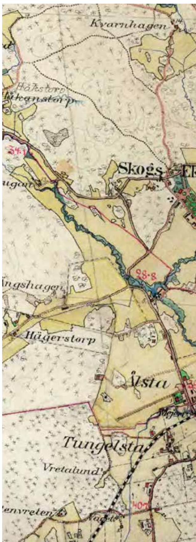
Häradsekonomska kartan från 1901-1906.

Området delades under tidig historisk tid av ett antal byar och gårdar, Tungelsta by i söder, Vålsta och Mulsta i sydöst, Ålsta i nordväst, Skogs Ekeby i norr och Tuna i nordost. Samtliga av dessa hade redan då en lång kontinuitet även om namnet Skogs Ekeby har tillkommit