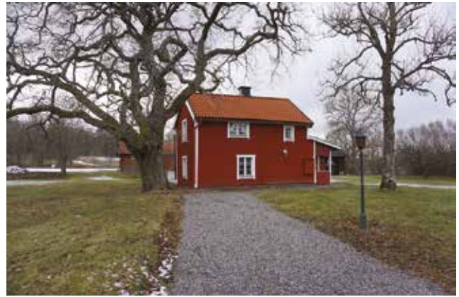
Äldre bostadshus med moderniserat skal (Vålsta 2:16).

Bebyggelsen på Södergården är till största delen ersatt med moderna hus. Undantaget är en välbevarad parstuga från andra hälften av 1800-talet (Vålsta 4:3) samt tre ekonomibyggnader. Boningshuset, som täcks av ett mansardtak klätt med enkupigt tegel, står på en naturstensgrund och har väggar med vitmålad locklistpanel och fönster med beslag av 1800-talstyp. Byggnaden ligger i en äldre