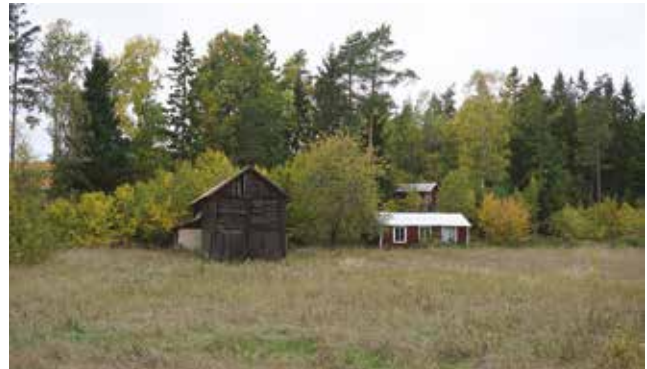
Torklada och två mindre byggnader på Hammars småbruk 33:1.

Befintlig bebyggelse i identifierade särskilt värdefulla miljöer är skyddad av plan och bygglagen (PBL) enligt följande stycken: