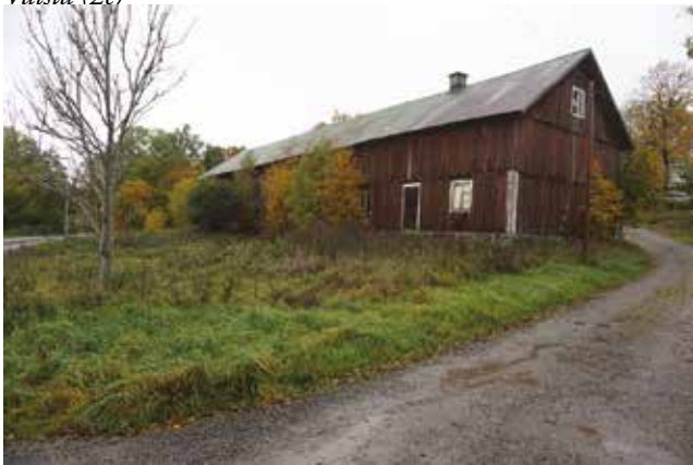
Ekonomibyggnad som tillhört Krigslida gård.