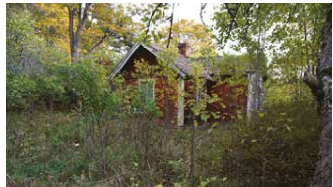
Boningshus på Stenvreten.

Vid Stenvreten finns ett mindre boningshus, en ekonomibyggnad, en källarbod och delar av växthus med tillhörande pannhus. Boningshuset, källarboden och ekonomilängan syns på den häradsökonomiska kartan från tidigt 1900-tal. Stenvreten är ett exempel på ett för Haninge typiskt blandbruk där alla inkomstkällor tillvaratagits, i det här fallet växthusodling.