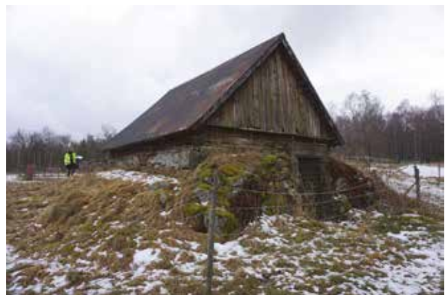
Källarbod på Vålsta 2:16.