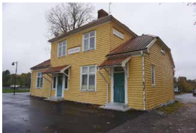
Tungelsta stationshus.