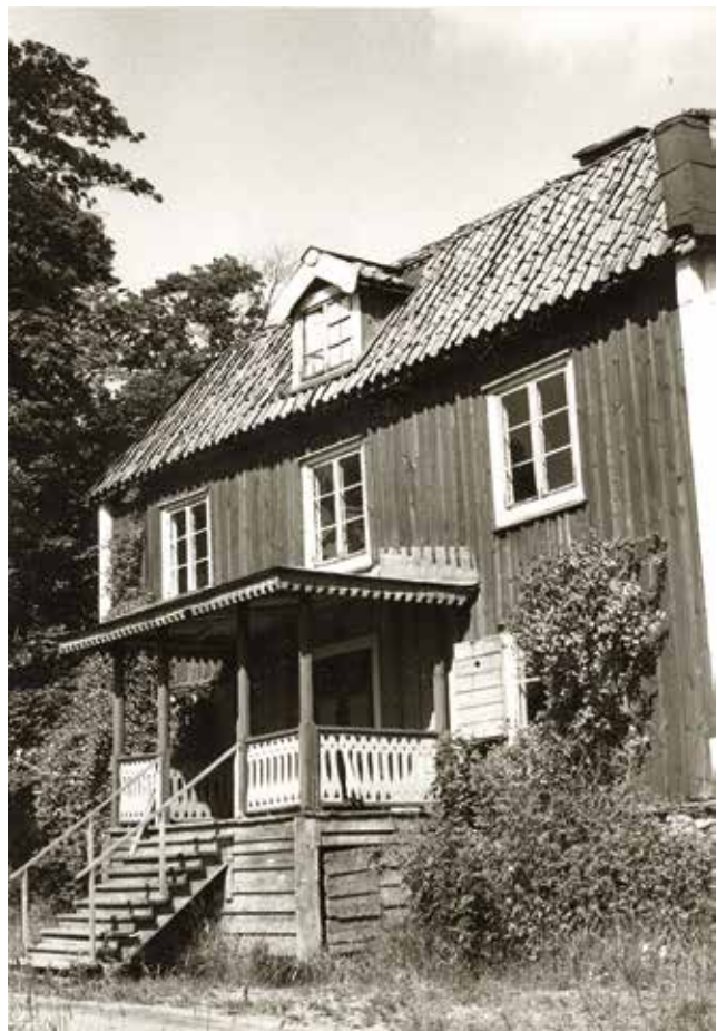
Huvudbyggnaden på Krigslida gård, fotograferad 1965.