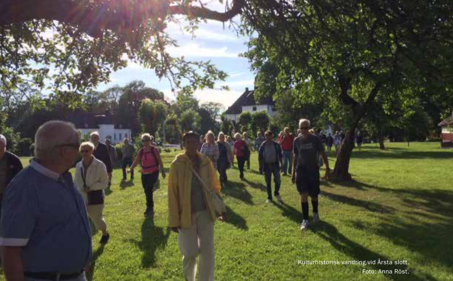
Kulturhistorisk vandring vid Årsta slott.