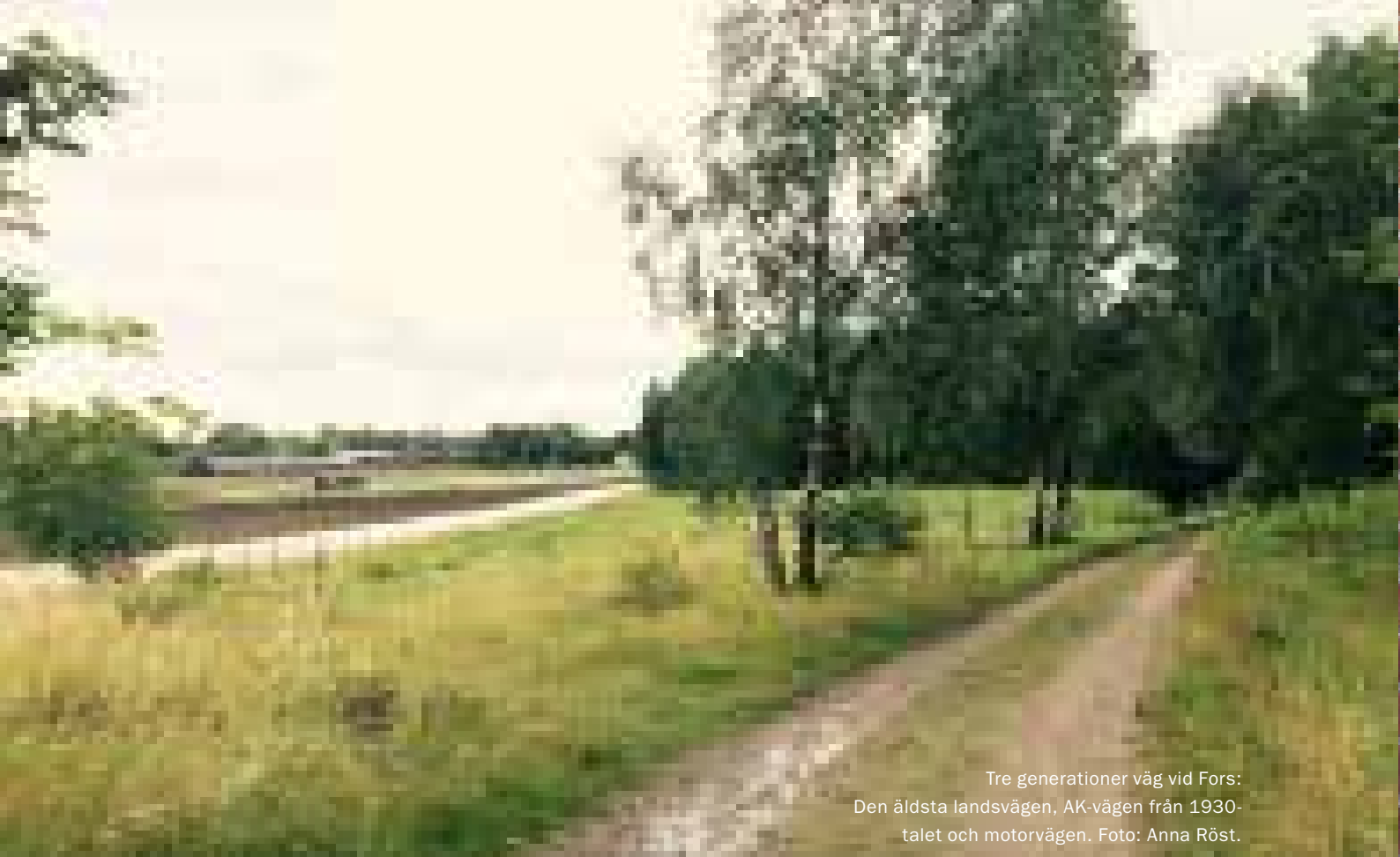
Tre generationer väg vid Fors: Den äldsta landsvägen, AK-vägen från 1930- talet och motorvägen.

tydliggöra landskapets och bebyggelsens kulturvärden, samt ange förhållningssätt.