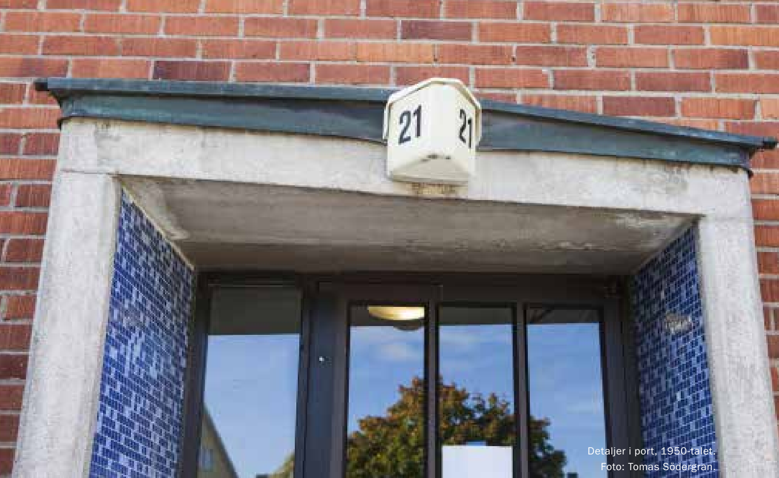
Detaljer i port, 1950-talet.