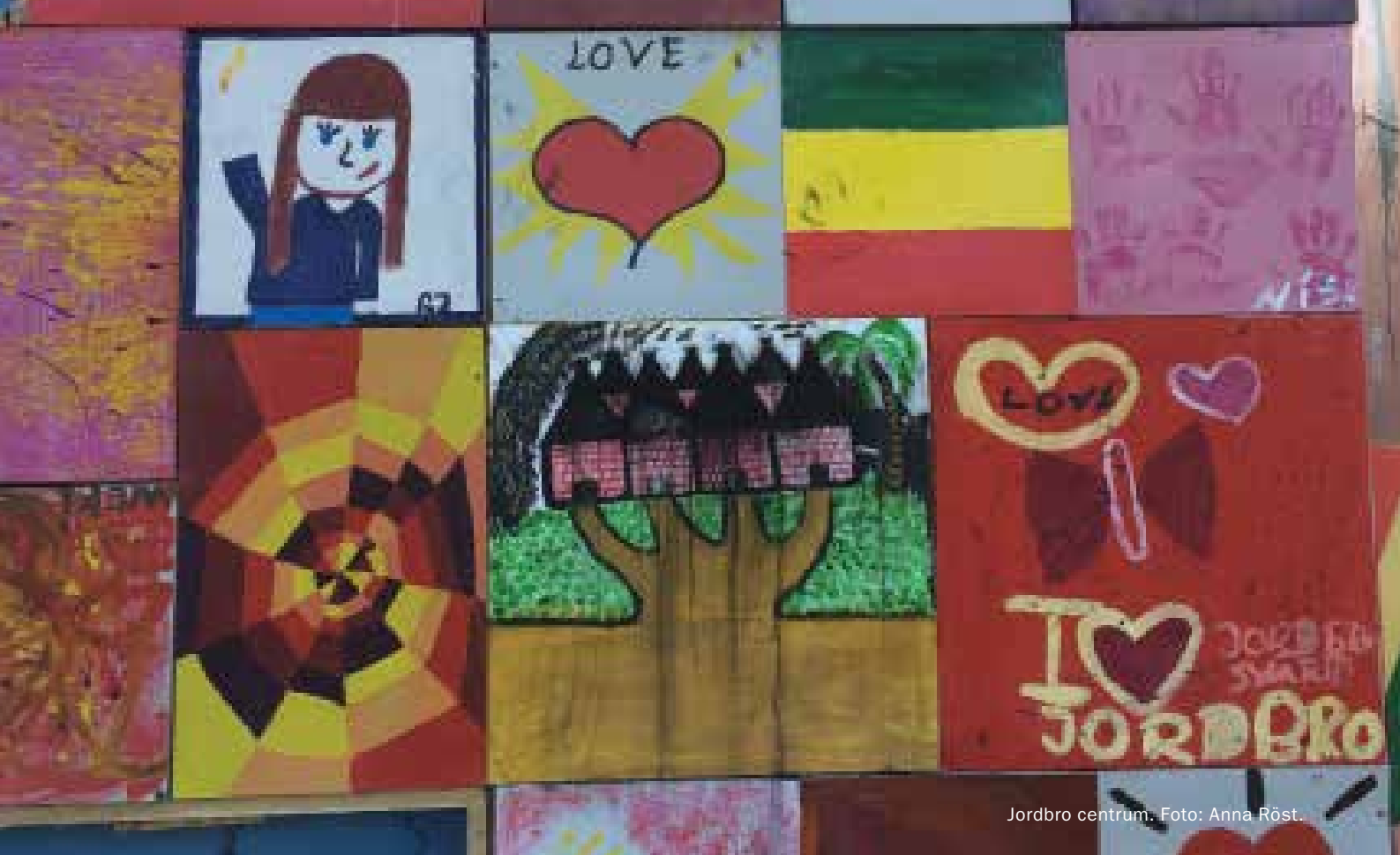
Jordbro centrum.