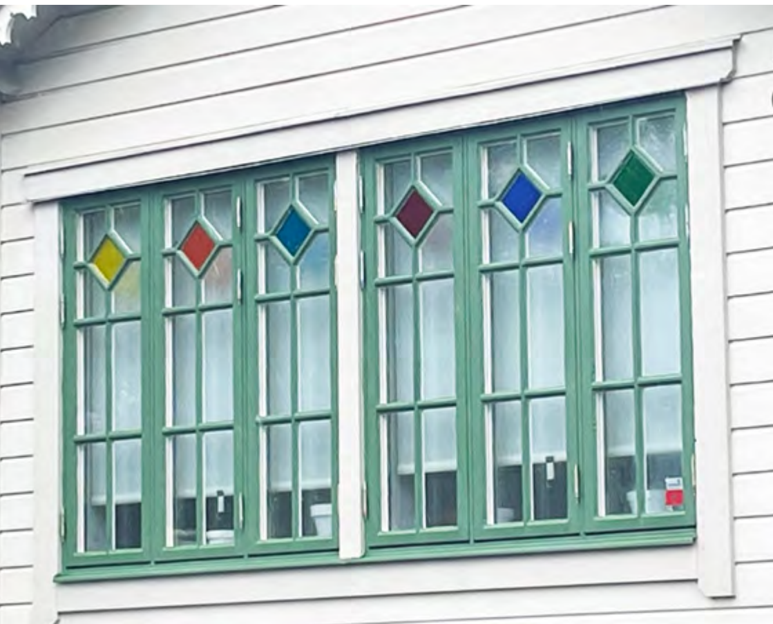
Nya fönster efter äldre förlaga.