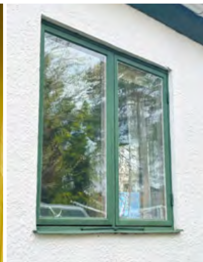
Bild vänster: Fönster från 1900-talets början i behov av omvårdnad.

Bild höger: Träfönster med enkla bågar från tidigt 1940-tal. Den inre rutan har bytts ut mot ett lågemmissionsglas medan den yttre rutan är ett maskindraget glas från tiden.