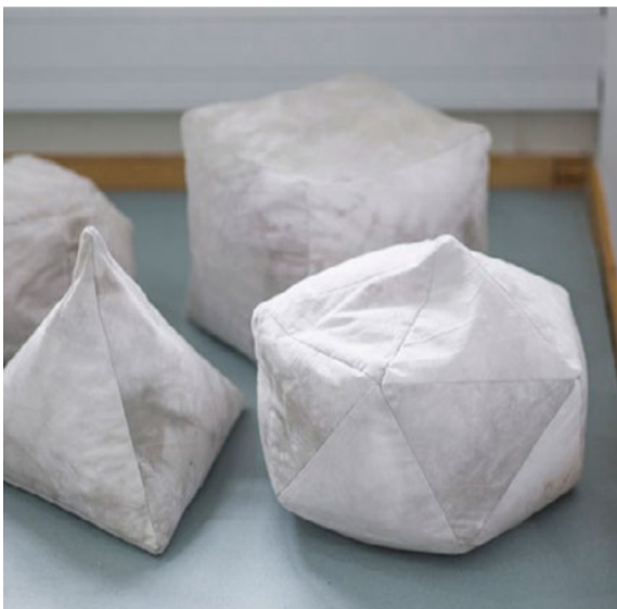
Verk av Jorun Jonasson.

Arrangör: Haninge Jazzklubb ABF Södertörn, Haninge kultur och Haninge Riksteaterförening.