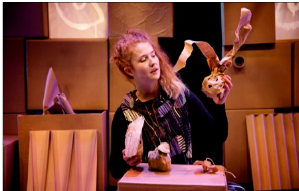
Råven i den kolsvarta natten.

Arrangör: Haninge kultur i samarbete med Muskö och Västerhaninge församling.