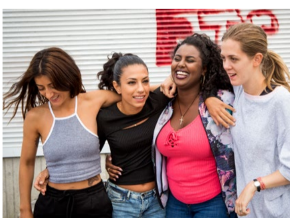
Dröm vidare.

Arrangör: Haninge kultur i samarbete med Haninge Riksteaterförening.