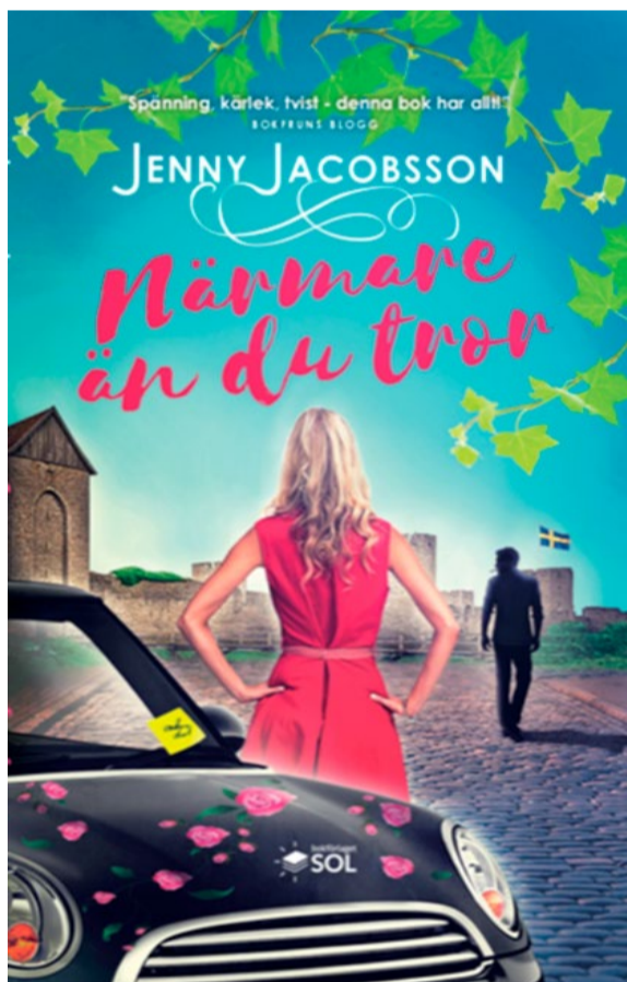
Bokomslag "Närmare än du tror". Bokförlaget SOL.

Arrangör: Haninge kultur och kulturambassadörerna i Haninge kulturhus.