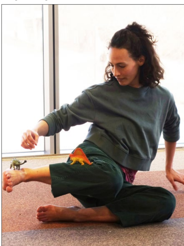
Läsa Röra.