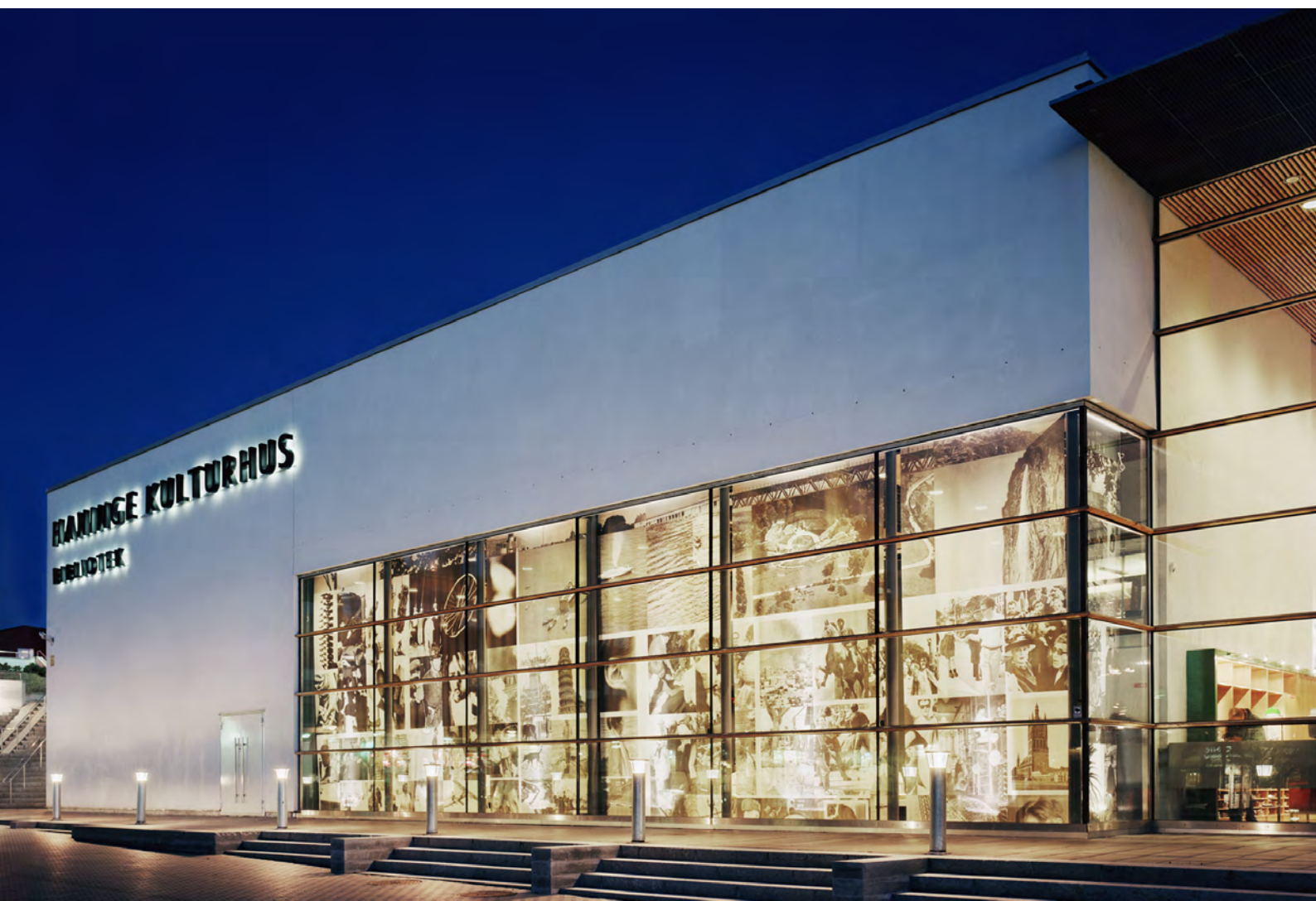
Haninge kulturhus.

MÅL 7-9 Konstpolitisk dimension – Professionella konstlivet och kulturarbetare Den konstpolitiska dimensionen fokuserar på konstnärliga uttryck som en viktig drivkraft för kreativitet. För att konsten ska bli en utmanande och dynamisk kraft krävs förutsättningar för konstnärer att kunna verka och bo i Haninge. I dimensionen ingår även kulturarvsfrågor. Ansvaret för kommunens konstpolitik ligger hos kultur- och demokratinämnden.