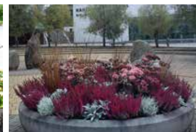
Höstfärgning på Poseidons torg