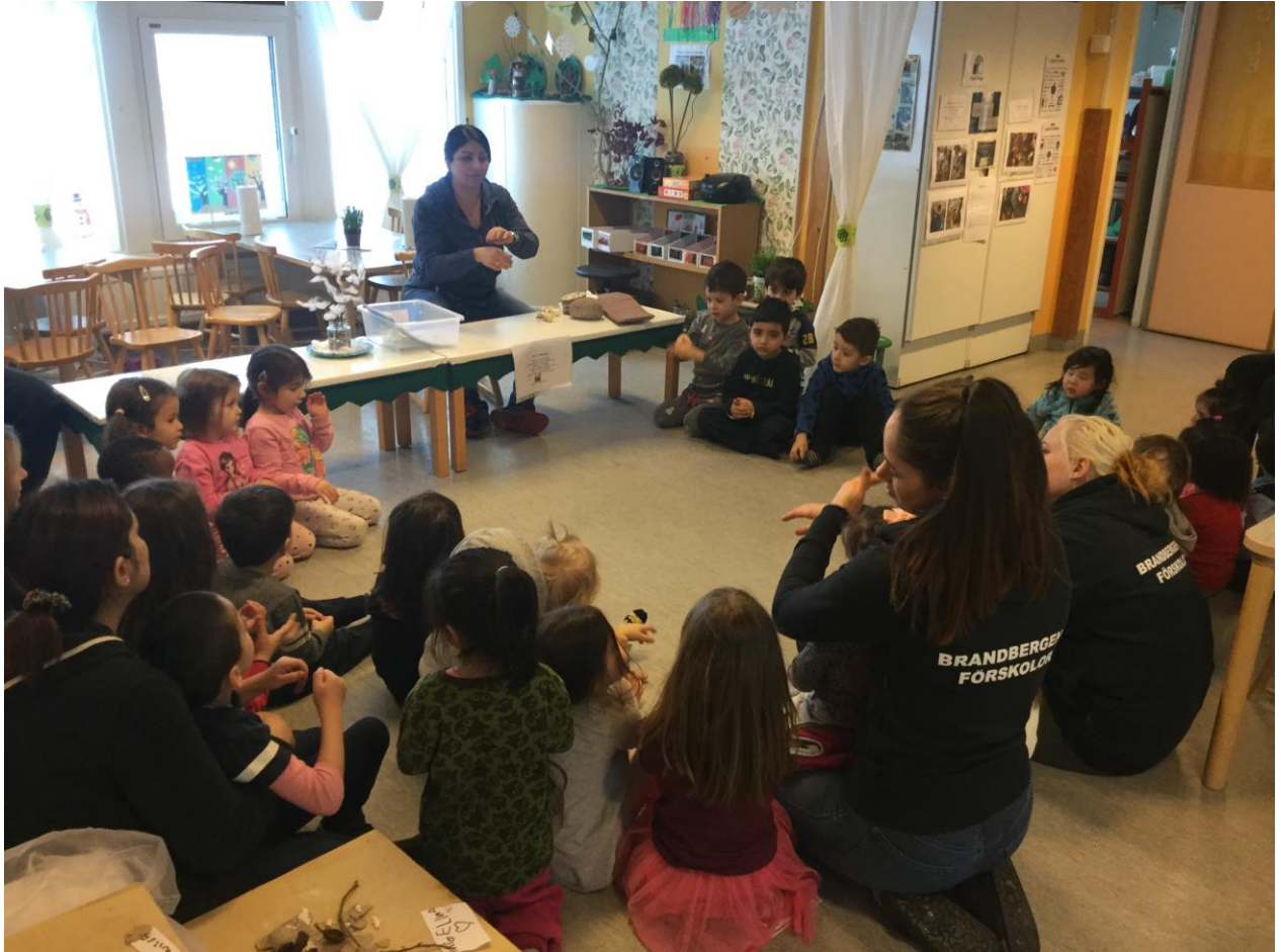
Sångsamling tillsammans med Humlan, Myggan och Myran