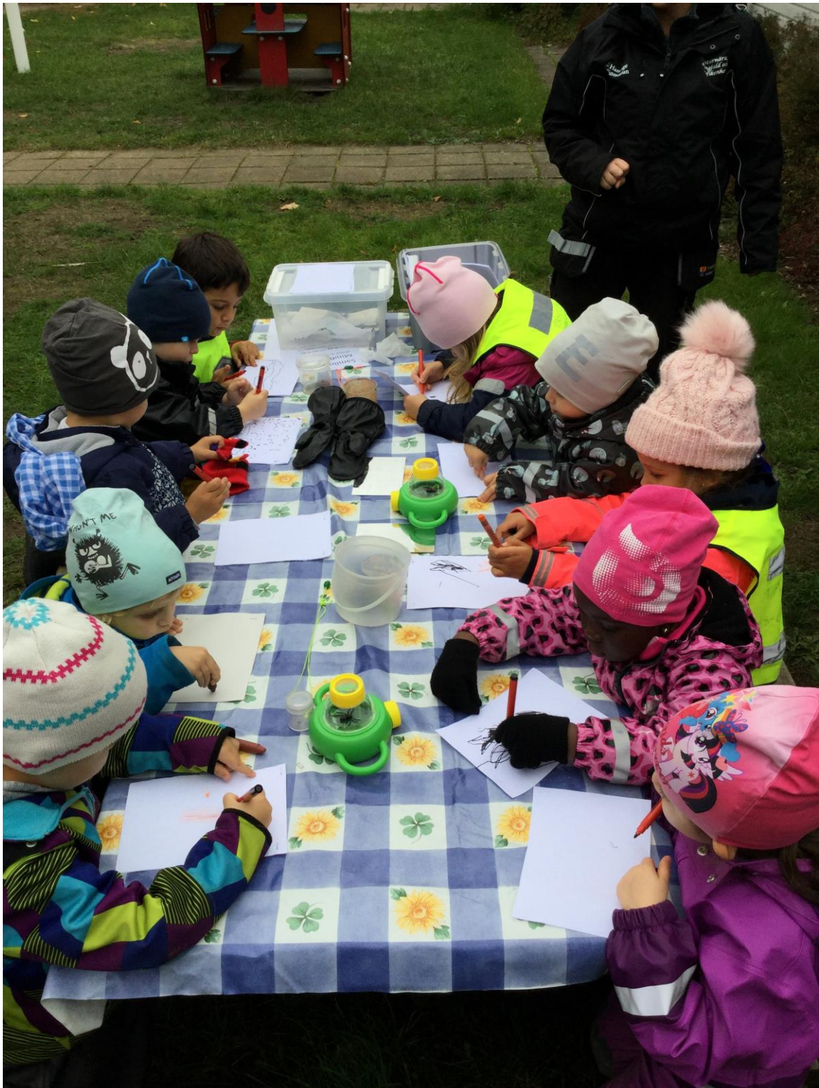
Här arbetar de barn som är med i miniflagg med att avbilda spindlar på papper