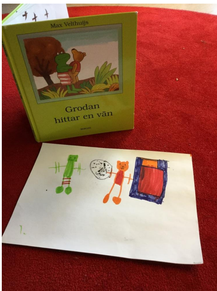
Barnet har ritat grodan och dennes nyfunne vän

Förskolan använder även kompisböcker som Palm och Sollenberg skrivit om barns rättigheter. Böckerna skapar samtalsunderlag med barnen oavsett ålder. Böckerna om Pino och Babblarna fungerar också som underlag för att samtala och dramatisera utifrån de olika diskrimineringsgrunderna. Även olika tv-program och filmsnuttar såsom Kloka Ugglan, kompisproblemet från UR.se och Stopp min kropp används för att på ett varierat sätt skapa förståelse och intresse för samtal om de olika grunderna.