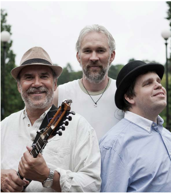
Ale Möller Trio.

Arrangör: Haninge kultur, Haninge Riksteaterförening och ABF Södertörn i samarbete med Stallet – världens musik.