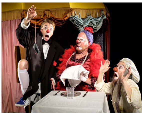
Hasta la Pasta.