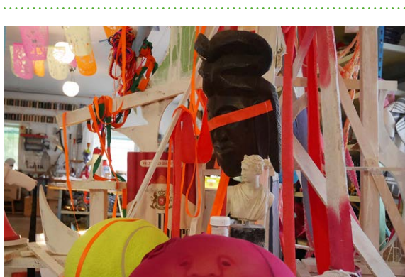
Big Bang med Jonas Liveröd. Foto: Jonas Liveröd