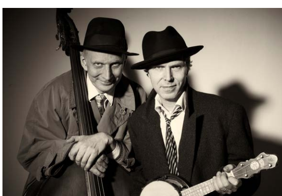
Bröderna Bågart.

Arrangör: Haninge kultur, Haninge Riksteaterförening, ABF Södertörn och Mötesplats Jordbro.