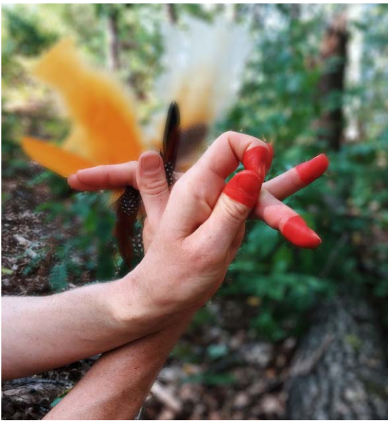
Indisk dans och storytelling.

Arrangör: Haninge kultur. Med stöd av Stockholms läns landsting och Stockholms Stads kulturförvaltning.