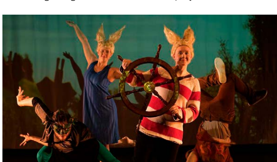
Fjäderkungens rike.

I samarrangemang med Tromäki Dance Company.