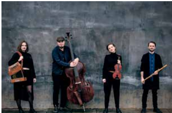
Floating Sofa Quartet.

Arrangör: Haninge kultur, Haninge Riksteaterförening och ABF Södertörn i samarbete med Stallet – Världens musik.