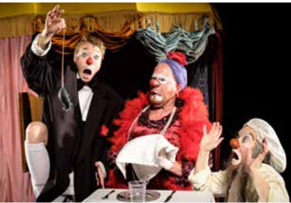
Hasta la Pasta.

Arrangör: Haninge kultur och Haninge Riksteaterförening.