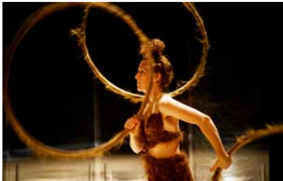
Rockringsakt Hairly tales.

Arrangör: Haninge kultur, Haninge kvinno- och tjejjour, ABF Södertörn och Haninge Riksteaterförening.