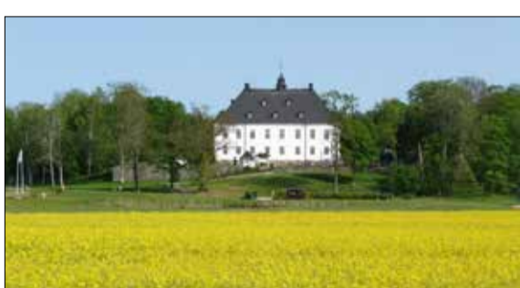
Årsta slott.

Arrangör: Årstasällskapet för Fredrika Bremerstudier i samarbete med ABF Södertörn och Haninge kultur.