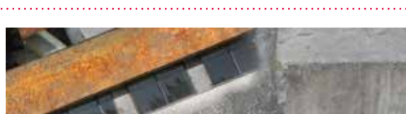
Reflexive Perception.