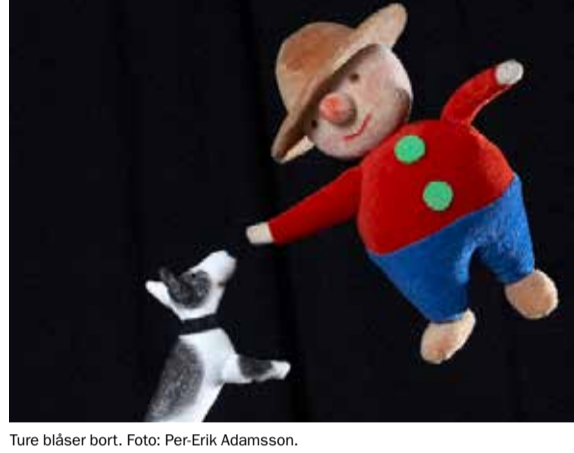
Ture blåser bort.

Arrangör: Haninge kultur i samarbete med Muskö och Västerhaninge församling.