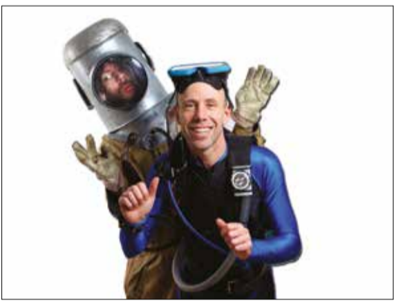
Vattenmannen och speed.

Arrangörer: Haninge kultur och Haninge Riksteaterförening med stöd av Länsmusiken i Stockholm.