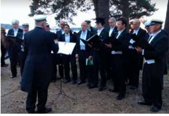
Manskören Birger.

Arrangör: Manskören Birger i samarbete med Haninge kultur.