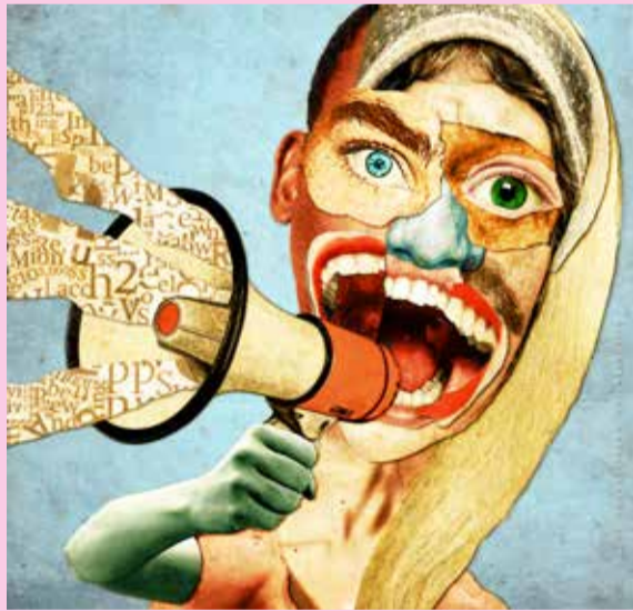
Kultur och demokratidagar. Illustration: Mats Persson.