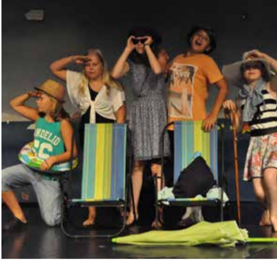
Kollo i Jordbro.

Arrangör: Jordbro Världsorkester i samarbete med Haninge kultur.