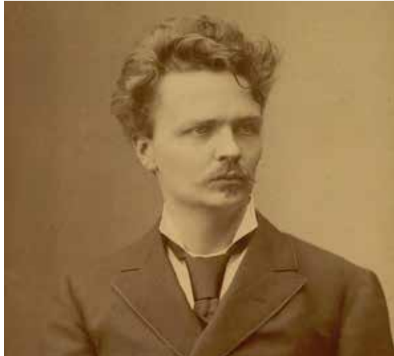
August Strindberg.