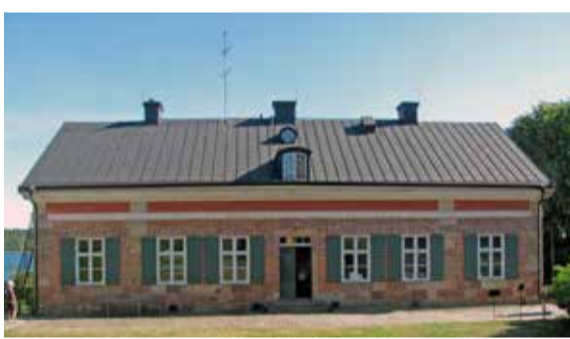
Tullhuset på Dalarö.

Huvudarrangör: Dalarö hembygdsförening. Medarrangör: Haninge kultur.