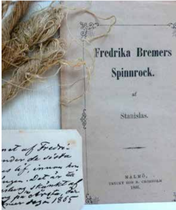
Fredrika Bremers museum.

Arrangör: Årstasällskapet för Fredrika Bremerstudier i samarbete med ABF Södertörn och Haninge kultur.