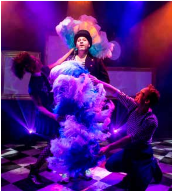
Lilla trollflöjten.

Arrangör: Parkteatern, Kulturhuset/Stadsteatern och Haninge kultur i samarbete med Haninge Riksteaterförening och teaterföreningen Ormen med stöd av Stockholms läns landsting.