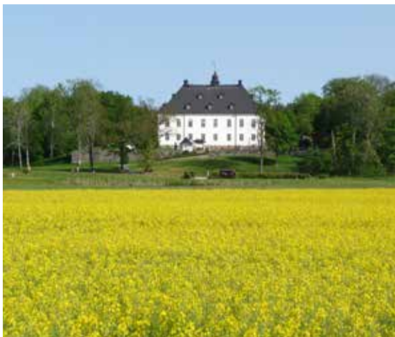
Årsta slott.

Arrangör: Haninge kultur och Årstasällskapet för Fredrika Bremerstudier i samarbete med ABF Södertörn.