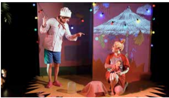
Panik på playan.

Arrangör: Haninge kultur och Haninge Riksteaterförening.