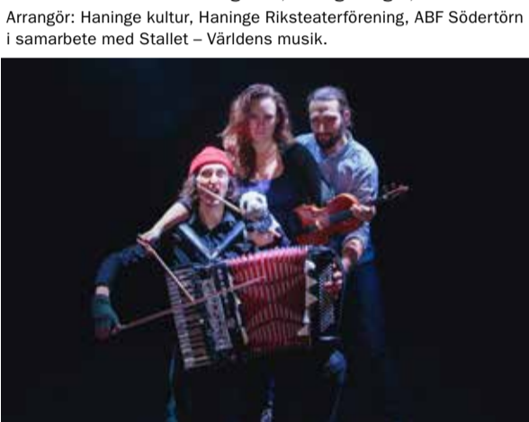
Trio Katastrofa.

Arrangör: Haninge kultur, Haninge Riksteaterförening, ABF Södertörn i samarbete med Stallet – Världens musik.