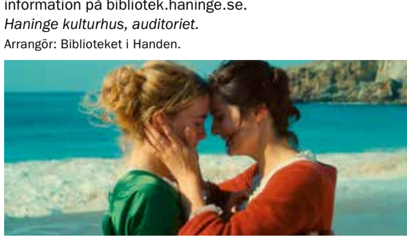
Porträtt av en kvinna i brand.