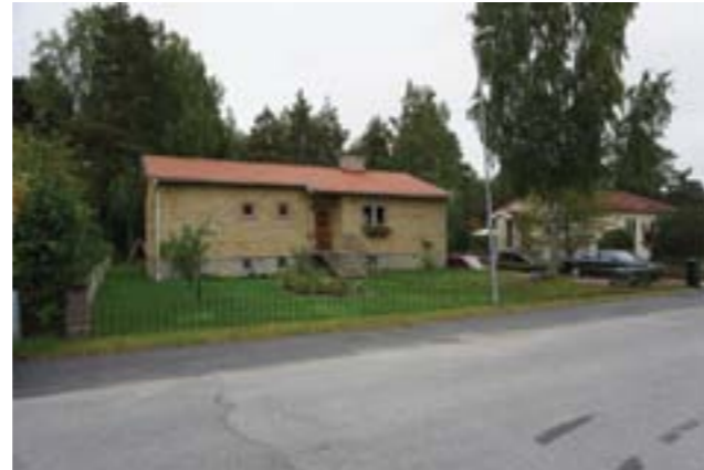
Vendelsö 7:97.

Villa i en våning med källare, uppförd efter ritningar daterade 1956. Karaktäristiskt är byggnadens fasad i gult tegel, källare med garage, sadeltak, trappa med smidesräcke, ursprunglig dörr, fönstrens form och placeringar samt staketet mot gatan.