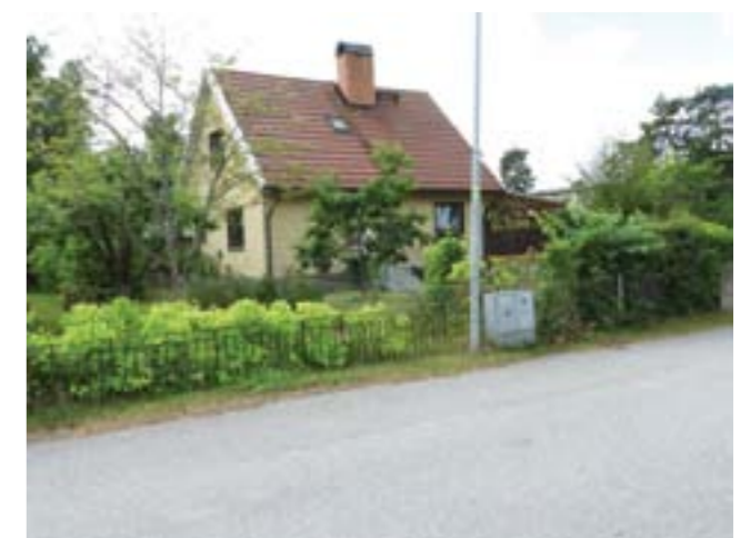
Vendelsö 7:84.