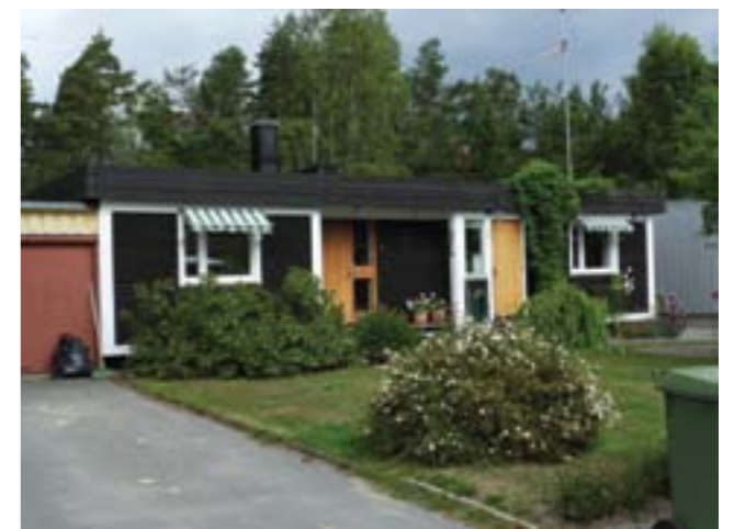
Exempel på WP-villor i Ramsdalen som har kvar den ursprungliga karaktären.