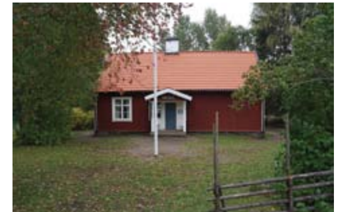
Svartbäckens skola, numera skolmuseum.

Svartbäckens skola är ett välbevarat exempel på hur landsbygdens skolhus ofta utformades vid tiden kring 1800-talets mitt. Byggnaden är det äldsta skolhuset i kommunen och har ett samhälls- och socialhistoriskt värde då den kan berätta om skolsystemets utveckling. Ingen skolundervisning har bedrivits i byggnaden sedan 1932, men läget intill en aktiv skolmiljö ger den ett kontinuitetsvärde.