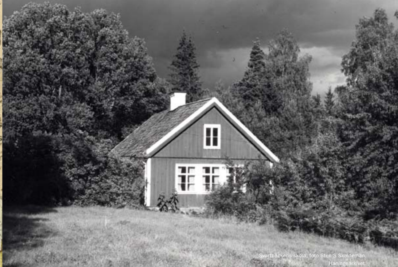
Svartbäckens skola, foto Sten S Skaldeman, Haningearkivet.

husförhållanden från 1881-1885 anges Johan som ägare till Ramsdalen. Gården ska ha rustats upp efter friköpandet och det nuvarande bostadshuset stod klart 1914. På karta från år 1883 anges både Ramsdalen och Svartbäck som frälsehemman. Ramsdalen 1 2 eller, som det senare kom att kallas, Fredrikslund, avskiljades från stamfastigheten 1889 men anges även som avstyckad först år 1909, då under benämningen Ramslund. Svartbäckens skola invigdes 1847 och lades ned 85 år senare, år 1932. I byggnaden finns numera ett skolmuseum.