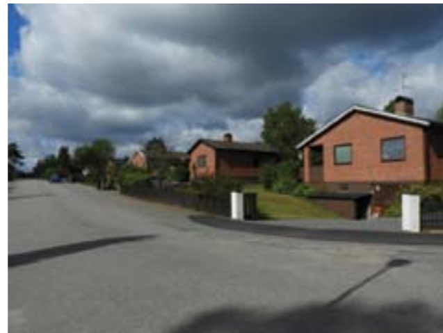
Vendelsö 7:113, 7:114, 7:115.

Tre småhus på Lisebergsvägen. Byggnaderna ritades av Stramithus, A. B. Slöörs maskiner 1957 och fick väggar i materialet stramit, en typ av halmplattor, och fasader i rött tegel. Karaktäristiskt är vidare byggnadernas form, källarvåning med garage, flacka sadeltak, skorstenarnas placering, brunmålade fönstersnickerier och ursprungliga dörrar, garageposter och fönster där sådana finns kvar.