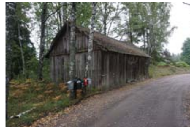
Boningshus och torklada vid Ramsdalen.