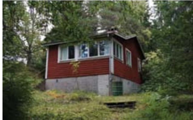
Gudö 3:321.

På Gudö 3:321 (3o) finns en sportstuga med källarvåning, väggar klädda med stockpanel, ursprungliga fönster, trappa med smidesräcke och skorsten med dekorativa detaljer.