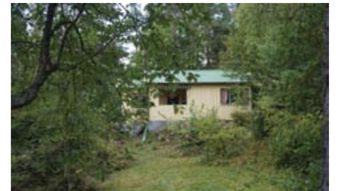
Gudö 3:326.