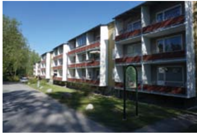
En av byggnaderna på västra sidan om Vendelsö skolväg. De utanpåliggande balkongerna med betongskärmar gör att balkongerna dominerar fasaden.