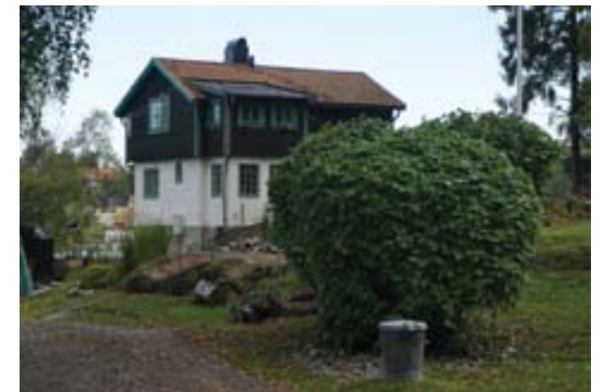
Gudö 3:333.