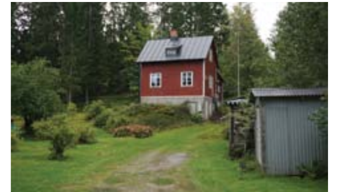
Gudö 3:68.

Gudö 3:326 (3m) är en sportstuga med den typiska öppna altanen. Väggarna är klädda med locklistpanel och sadeltaket med korrugerad plåt.