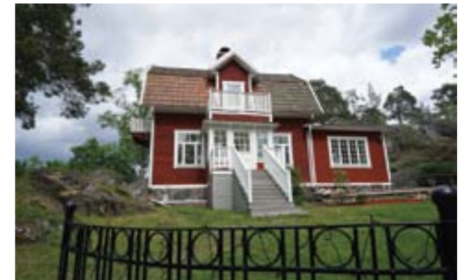
Vendelsö 3:78.

Vendelsö 3:78 (3d), en av de tomter som styckades av och såldes 1908. Villan är högt belägen i terrängen. Naturstenssockel, liggande träpanel, fönster med småspröjsad övre del och brutet sadeltak klätt med tegelpannor är karaktäristiskt.