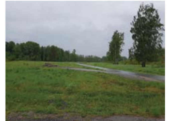
Det öppna landskapet vid Signeborg.