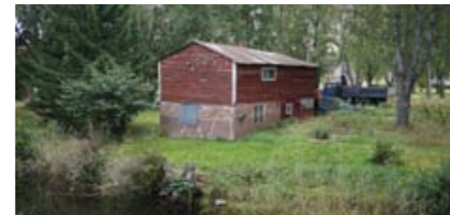
Ovan: Torklada med de karaktäristiska vädringsluckorna Tvättstuga på Gudö 3:274 3. Th, ovanifrån: Signesborg, Gudö 3:26, Gudö 3:11, Gudö 3:3