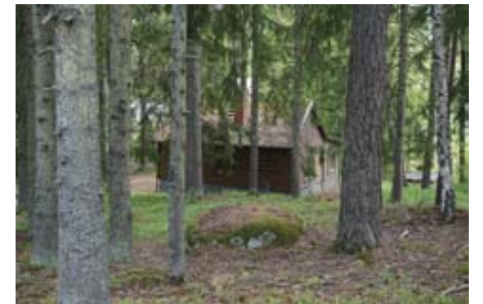
Tutviken 1:39.

Tutviken 1:39 (3t) - Sportstuga som nästan döljs av tomtens alla tallar. Karaktäristiskt är den brunmålade stockpanelen med gröna detaljer, fönsterform och placering, pappklätt sadeltak och den höga skorstenen.