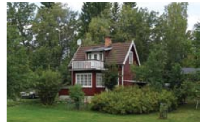
Gudö 3:110.