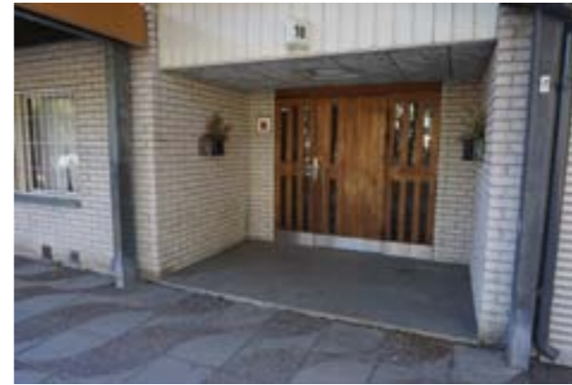
Entré till flerbostadshus, tidstypiskt indragen från fasaden och med ursprungliga dörrar.