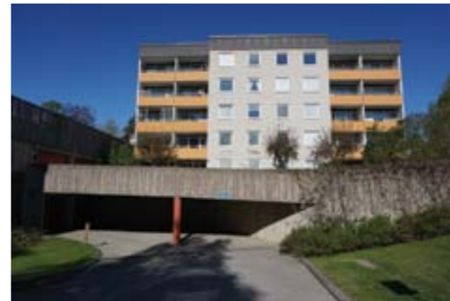
En av byggnaderna uppförd på 1970-talet, med tidstypisk utformning och detaljer som balkongfronter i orange plåt. Garageinfart med fasad av betong.