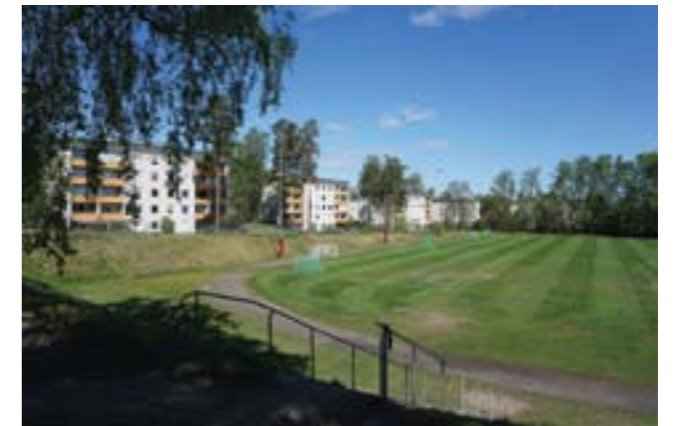
1970-talets bebyggelse i Sågen. Byggnadernas placering och höjd anpassades efter platsens befintliga vegetation, bl a tallar som syns på bilden. I förgrunden syns Haningevallen.