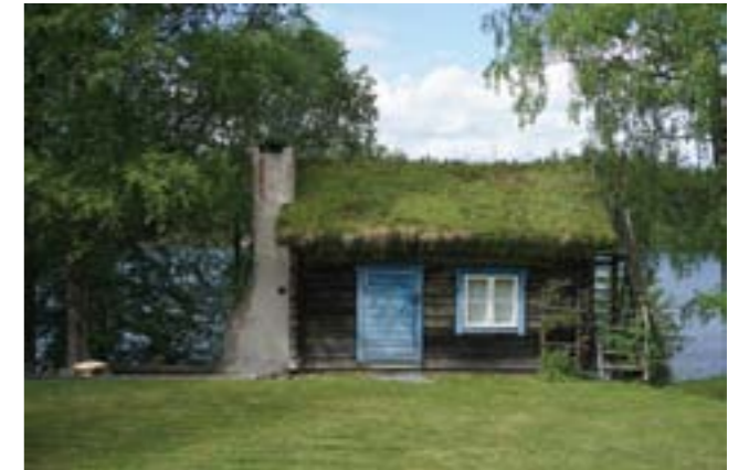
Tutviken 1:29.

Tutviken 1:29 (3s) - Liten timrad stuga med utanpåliggande murstock och grästäckt tak vid Långsjöns strand.