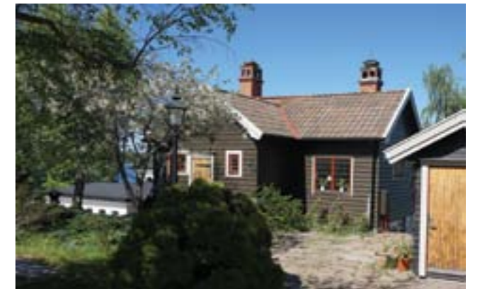
Vendelsö 19:1.

Vendelsö 19:1 (3e). Brunmålad stockpanel, blyspröjsade fönster, tegelklätt sadeltak och skorstenarnas dekorativa utformning är viktiga för byggnadens karaktär.