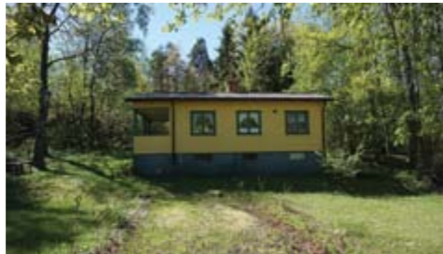
Sportstuga med den typiska stockpanelen och öppen altan, Dalen. Tomten har en långsmal form och naturmarken med många träd är till stor del bevarad (Vendelsö 3:47).