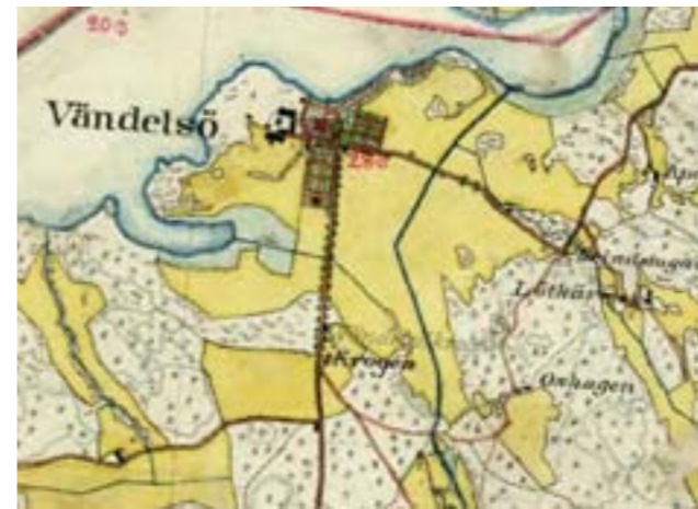
Till vänster: Huvudbyggnaden på Vendelsö gård användes som skola 1916-1920. Ovan: Häradsekonomska kartan, 1901-06. Till höger: Vendelsö gård var kraftigt förfallen när den revs 1984.

Idag finns endast den södra flygelbyggnaden bevarad från säteriet. Den används som bygdegård. Den östra delen av trädgården finns kvar som en öppen gräsbevuxen yta. Vid slutningen mot Drevvikens finns rester av den engelska park som anlades där. Från den handelsträdgård som bedrevs under en stor del av 1900-talet finns en trädgårdsmästarebostad, pannhuset till ett växthus och några ekonomibyggnader kvar. Den gamla landsvägens sträckning öster och söder om Vendelsö gård finns bevarad, liksom en del av den allé som har kantat vägen sedan sent 1800-tal. Sedan sent 1900-tal är platsen där Vendelsö gårds manbyggnad och ekonomibyggnader stod bebyggd med villor och radhus. I Vendelsö gårds direkta närhet finns ett fåtal villor från tidigt 1900-tal, bland annat ovan nämnda Stora Alsvik (Vendelsö 3:982) samt en villa i två våningar som ligger i den skarpa kurvan mellan Vendelsö allé och Vendelsö gårdsväg (Vendelsö 3:724).