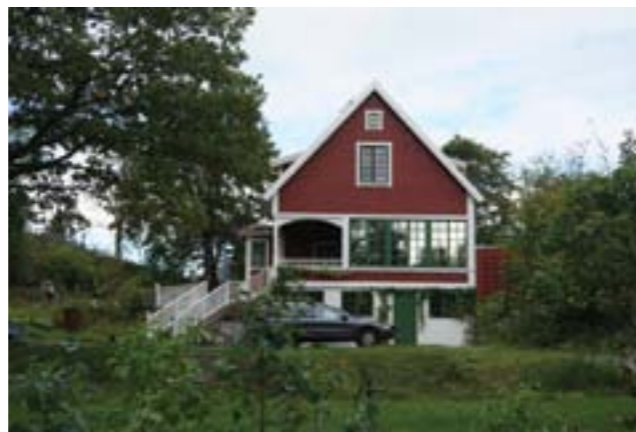
Gudö 3:64.

Stora tomter med byggnaderna indragna från vägen är typiskt i området. Ett exempel är Gudö 3:68 (3j). Viktigt för byggnadens karaktär är den liggande träpanelen, ursprungliga fönster, sadeltak, källarvåning samt byggnadens enkla uttryck och fasad utan tillbyggnader mot vägen.