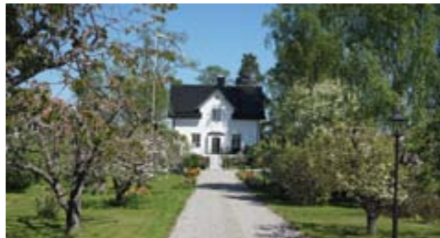
Vendelsö 3:57, Östra Strandvägen.

Vendelsö 3:57 (3c) har den avlånga formen på fastigheten bevarad, med en rak grusgång kantad av fruktträd som leder fram till den vitputsade villan. Byggnaden är förändrad med bl a ändrat takmaterial.