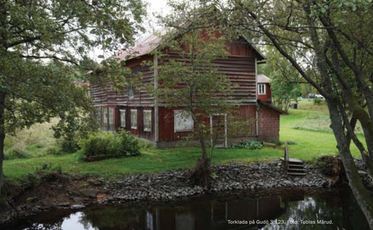
Torklada på Gudö 3:123.