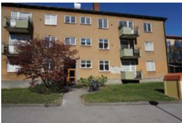
Byggnaden har en tidstypisk utformning med bl a putsad fasad och balkonger med sinuskorrugerad plåt och räcken i smidesjärn.