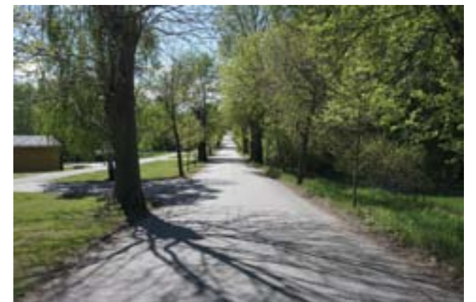
Vägen söderut från Vendelsö gård, delvis kantad av allén från sent 1800-tal.