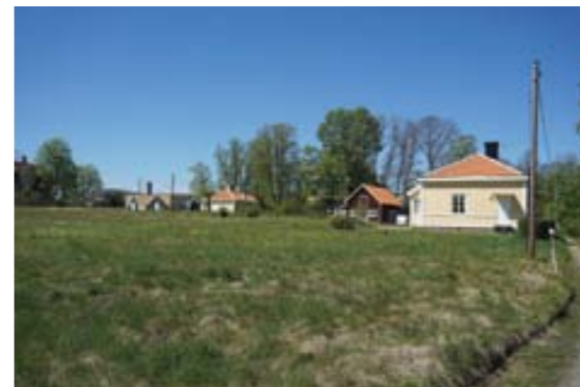
Trädgårdsmästarebostaden från 1920-talet och övriga bevarade byggnader. Den öppna gräsyta var tidigare den östra delen av trädgården vid Vendelsö gård.