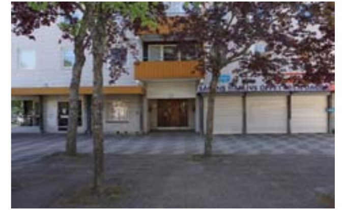
Sågens centrum med butiker i bostadshusets bottenvåning. Trädplantering och markbeläggningen är viktiga miljöskapande inslag.