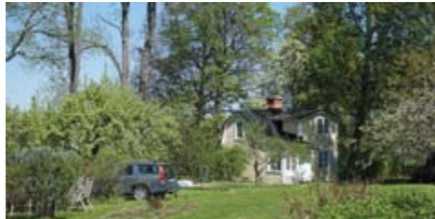
Vendelsö 3:55, Östra Strandvägen.

Vendelsö 3:55 (3a) styckades av 1908 och såldes till hattmakaren Johan Sigfrid Karlsson och snickaren Karl Johan Karlsson, Stockholm. Viktigt för villans karaktär är väggarna klädda med liggande gul träpanel, plåttäckt mansardtak, spröjsade fönster och skorsten med utkragat krön samt läget en bit in i trädgården. I trädgården finns fruktträd.