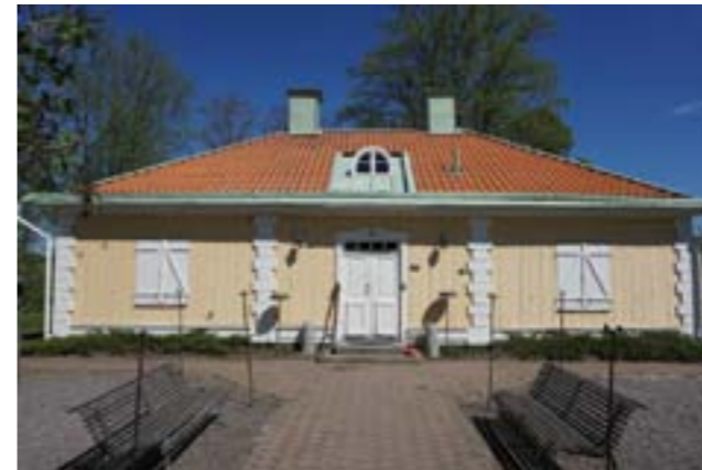
Den södra flygeln som uppfördes under tidigt 1800-tal. Idag fungerar den som bygdegård.