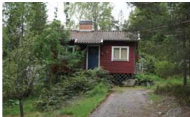
Gudö 3:445.

Gudö 3:445 (3q) - Stuga som bland annat karaktäriseras av väggarna klädda med stockpanel, sadeltak klätt med enkupigt tegel, trappa med smidesräcke samt fönstrens form och placering. I trädgården finns bland annat syrener och sparad naturmark med berg i dagen och tallar.