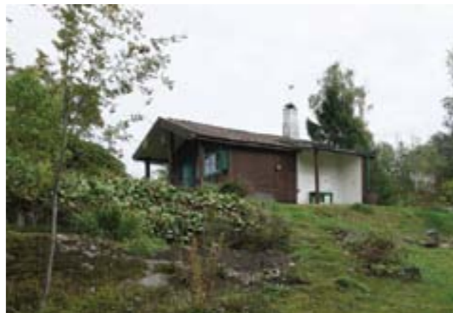
Gudö 3:478.

En sportstuga, troligen uppförd 1917 finns på Gudö 3:478 (3p). Liggande brun stockpanel, grönmålade detaljer, tegelklätt sadeltak, profilsågade snickerier och hög vitputsad skorsten med dekorativa detaljer är karaktäristiskt.