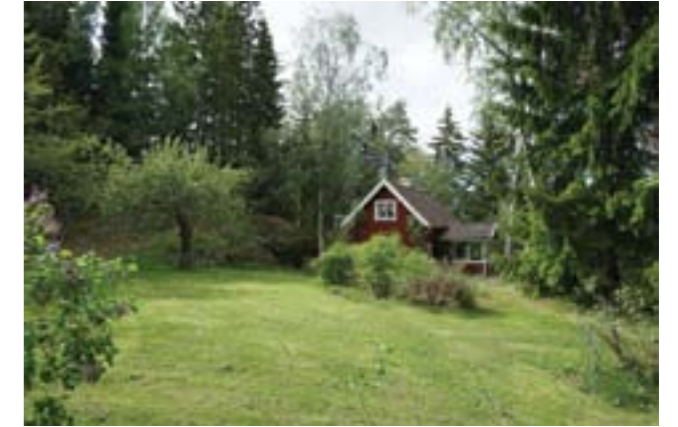
Tutviken 1:3.

Tutviken 1:3 (3r) - tomten avstyckades 1925 och bebyggdes med en stuga med liggande panel och vitmålade detaljer, sadeltak klätt med tegel, och farstuvist med svarvade stolpar. På den stora tomten finns fruktträd och syrener.