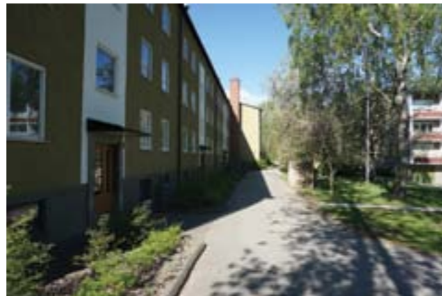
Trapphusen är markerade genom vita fält i fasaden.