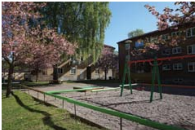
Lekplats mellan flerbostadshusen.

Karaktäristiskt för rekordårens bostadsområden är att bebyggelse och grönområden planerades som sammanhängande områden och att allt mer hänsyn togs till barns behov och säkerhet.