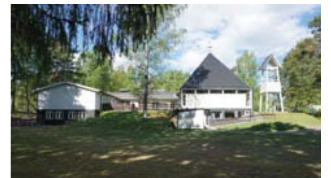
Vendelsö kyrka från 1967.

Kyrkan var ursprungligen rödfärgad, men omgestaltades 2005 och fick då den nuvarande vita färgsättningen. En klockstapel står nordväst om kyrkobyggnaden.