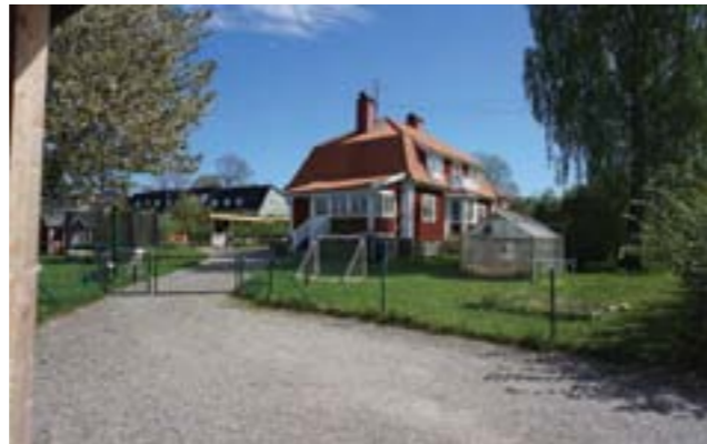
I miljön kring Vendelsö gård finns några villor från tidigt 1900-tal, här Stora Alsvik (Vendelsö 3:982).

Allén längs landsvägen är skyddad som biotop enligt miljöbalken 7 kap. 11 § som anger att det inte får inte bedrivas verksamhet eller vidtas åtgärder som kan skada naturmiljön, i det här fallet allén.