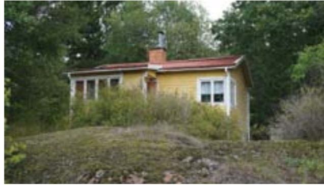
Gudö 3:331.

En sportstuga högt belägen på tomten finns på Gudö 3:331 (3n). Karaktäristiskt är altanen, stockpanelen och fönster över hörn.