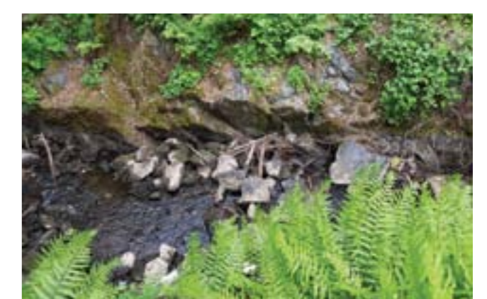
Miljön kring det gamla kvarnområdet.