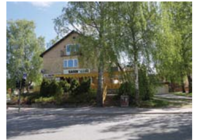
Det första flerbostadshuset som uppfördes i Sågen.