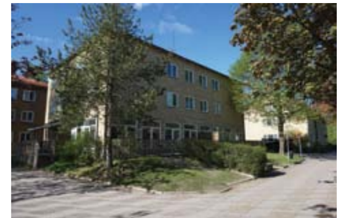
Byggnad med verksamhetslokal i bottenvåningen.