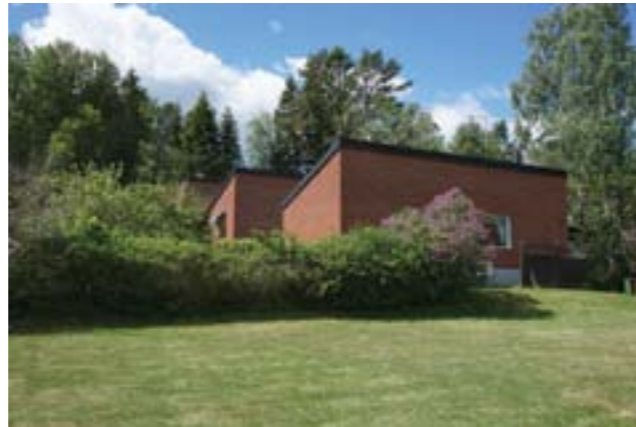
Grindstuvägen 68-80, Vendelsö 3:1232-3:1238. Välbevarade kedjehus med röda tegelfasader och tidstypiska detaljer som smidesräckan och skärmtak över entréer.