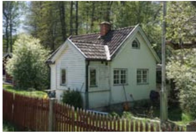
Stuga längs med Hagtornsvägen, Dalen. Spjälstaketet har ett högt miljöskapande värde (Vendelsö 3:1213).

På fastigheten Gudö 3:64 (3i) finns en villa med utformning typisk för tidigt 1900-tal gällande bland annat färgsättning och småspröjsade fönster. Tomten är kuperad och avgränsas mot vägen av en syrenhäck.