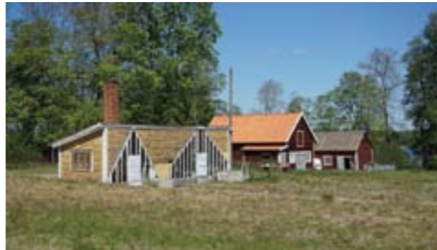
Byggnad med spår i fasaden av tidigare växthus samt ekonomibyggnader från tiden som handelsträdgård.

PBL 2 kap. 6 §, PBL 8 kap. 14 § och PBL 8 kap. 17 §. Förutom de generella skydd som PBL, tillsammans med PBF, MB och KML omfattar så ska miljön, inklusive bebyggelsen, i egenskap av att den är klassad som särskilt värdefull handläggas enligt PBL 8 kap. § 13 och PBL 9 kap. § 4d.