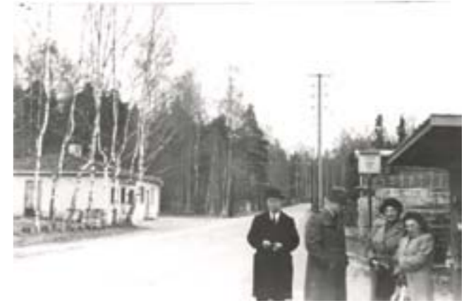
Sågen 1949.

Vid Gudöans södra strand finns en koncentrerad kulturmiljö präglad av bebyggelse, blandbruk och småindustri bevarad från första hälften av 1900-talet. Det är en miljö som på många sätt är typisk för Haninge under perioden. Här finns det största antalet bevarade torkklador i Haninge och Stockholms län. Tvätterinäringen var den enskilt viktigaste näringen för Österhaninge, möjligen för hela Haninge, under första hälften av 1900-talet. Här finns ytterligare bebyggelse som redovisar småjordbrukets behov av variation och tillvaratagande av inkomstmöjligheterna i form av jordbrukets ekonomibyggnader, en före detta mekanisk verkstad och rester av äldre bryggor vid åstranden, tillsammans med de äldre bostadshusen. Genom området gick tidigare den gamla landsvägen vars upphöjda vägbank ännu tydligt syns löpa fram till brofästet vid ån. Anknypningen till kommunikationerna, landsvägen, järnvägen och färjetrafiken är ytterligare ett inslag som på ett pedagogiskt sätt redovisar en typisk etablering av bebyggelse i Haninge.