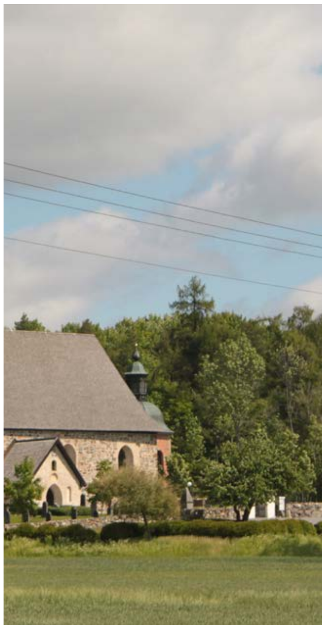
Österhaninge kyrka.

I PBL 8 kap. 13 §, det s k Förvanskningförbudet bestäms att byggnader, bebyggelseområden och allmänna platser som är särskilt värdefulla från historisk, kulturhistorisk, miljömässig eller konstnärlig synpunkt inte får förvanskas. Förvanskningförbudet gäller vid alla ändringar, interiört och exteriört, och oavsett om ändringen är bygglovs- eller anmälningspliktig. Rivning av byggnad är dock inte att ses som förvanskning eftersom byggnaden försvinner. Förvanskningförbudet är dock inte ett förbud mot förändring, utan skyddar enbart de egenskaper som utgör det särskilda värdet. Vid prövning bör det klarläggas om en föreslagen åtgärd förändrar byggnadens karaktärsdrag eller skadar någon av de egenskaper som ligger till grund för byggnadens eller områdets kulturvärden.