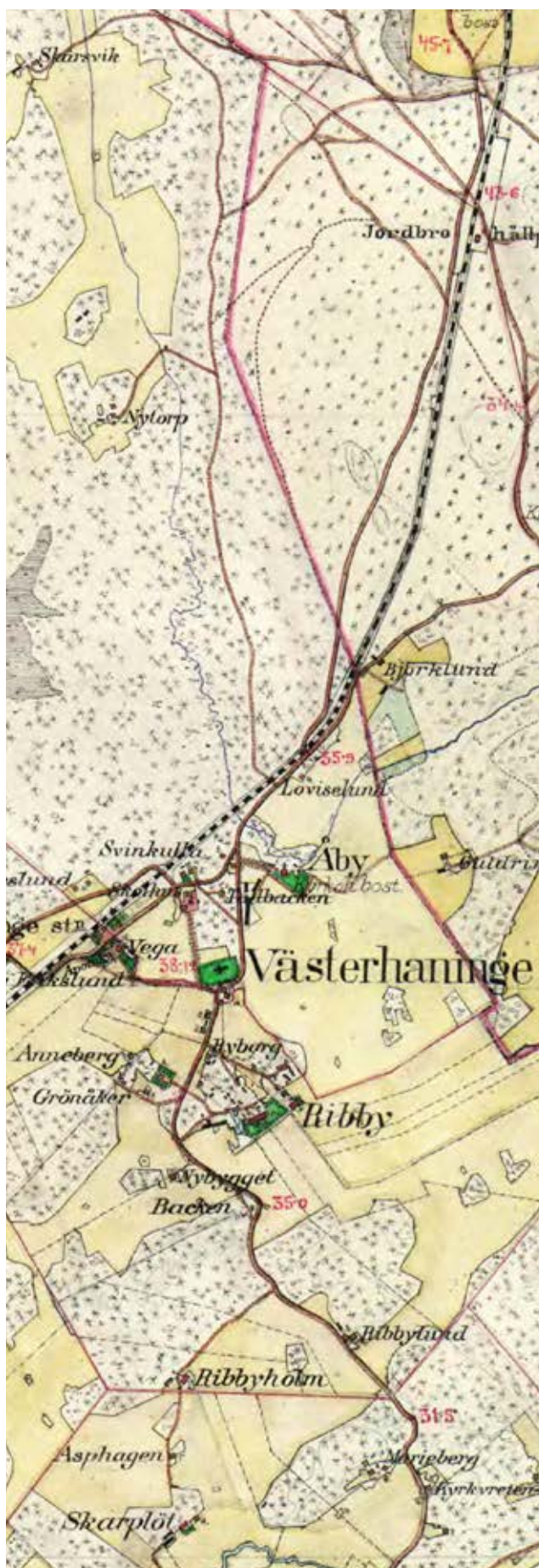
Häradsekonomiska kartan från 1901-1906.