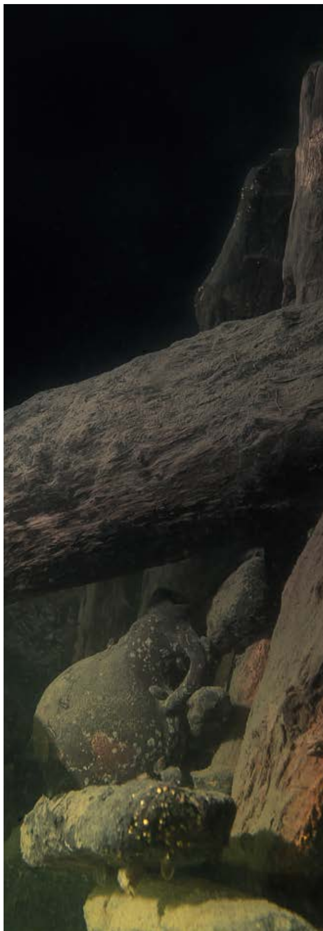
Bartmankrus vid vrak intill Dalarö.

Fornlämningar och fornfynd behandlas i kulturmiljölagens andra kapitel. Fornlämningar och det omgivande fornlämningsområde som hör till fornlämningen (det område som krävs för att bevara fornlämningen och ge