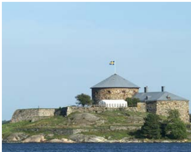
Dalarö skans.

I Haninge kommun finns 3662 registrerade fornlämningar och övriga kulturhistoriska lämningar (2017-12-29). Bland dessa finns fyndplatser, boplatser, gravar, runstenar, vrak på havets botten och mycket annat. De finns i Riksantikvarieämbetets söktjänst Fornsök: www.raa.se/fornsok Information om hur det går till när en fornlämning berörs av arbete finns på Länsstyrelsens webbplats.