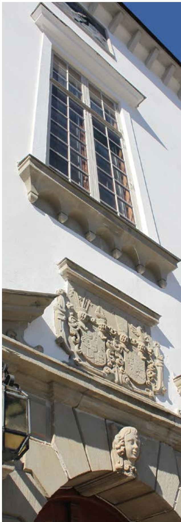
Årsta slott.

I formuleringen tidigare samhällsförhållanden ligger att det handlar om förfluten tid. Att en verksamhet fortfarande är i drift hindrar dock inte att den kan belysa tidigare förhållanden.