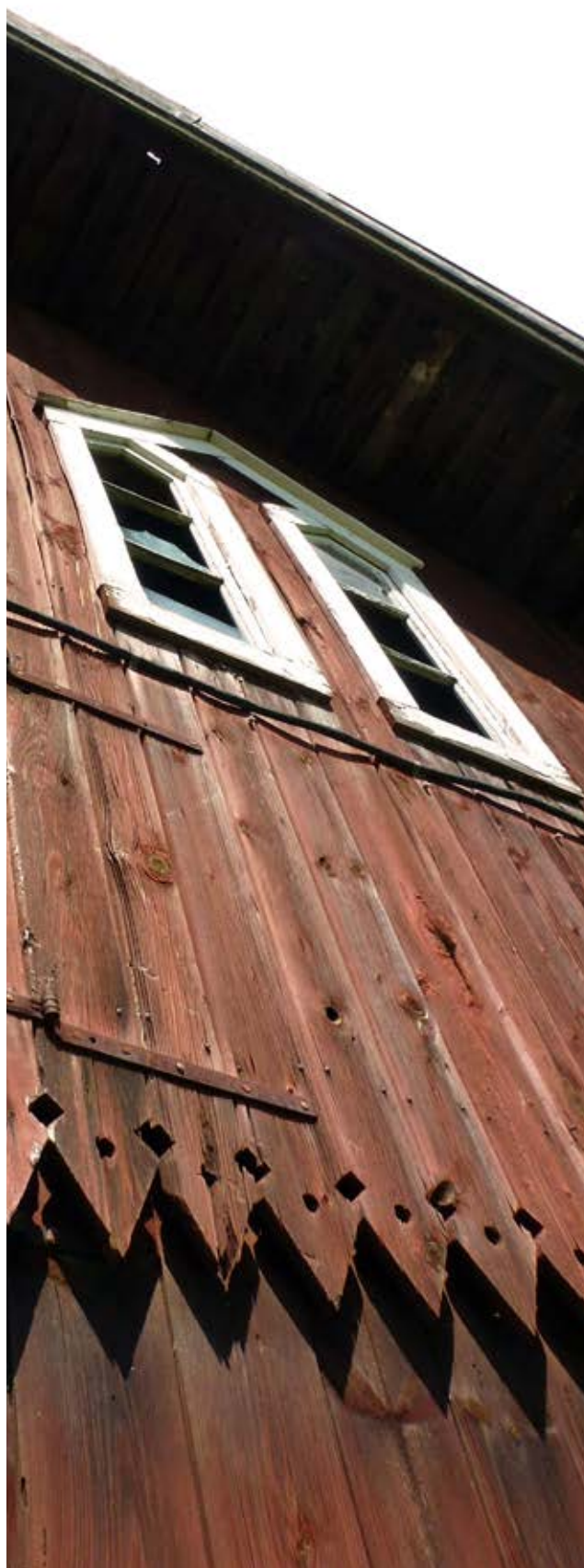
Ekonomibyggnad på Arbottna, Muskö.

Du som är fastighetsägare är skyldig att underhålla dina byggnader, och underhållet ska ske med hänsyn till byggnadernas kulturhistoriska värden. En byggnads karaktär