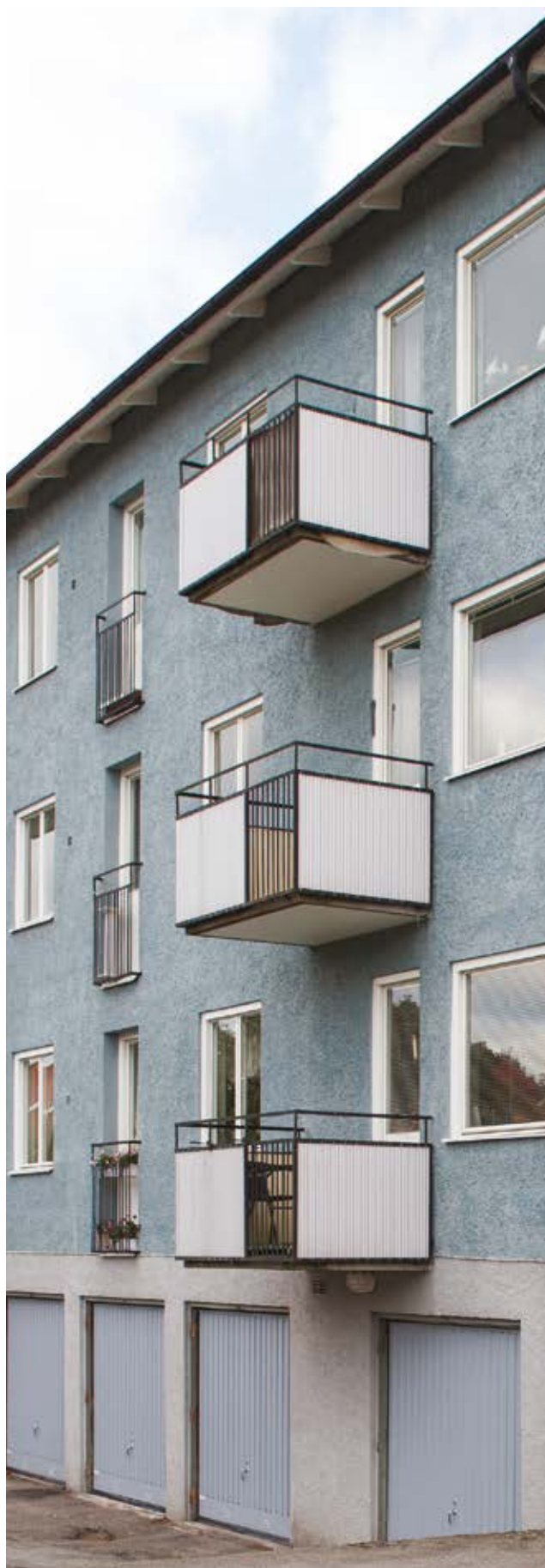
1950-talsbebyggelse i Handen.