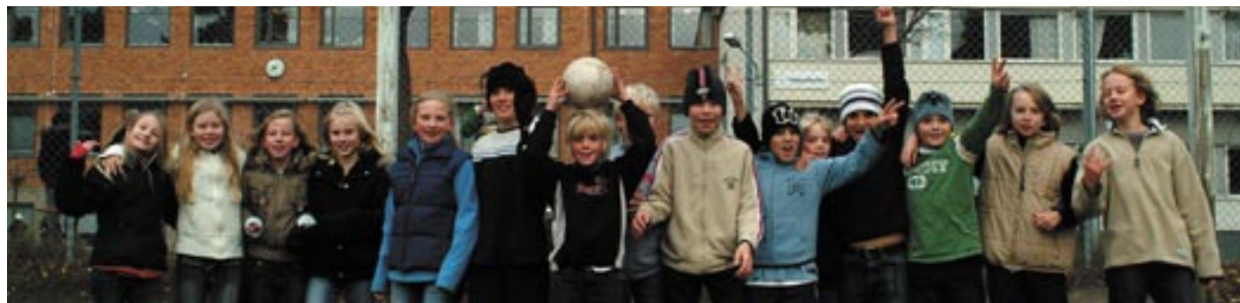
Kunskapsmål. Snart får alla barn i Haninges skolor och förskolor ett eget konto i "Den öppna skolan". De här eleverna går i Hagaskolan.