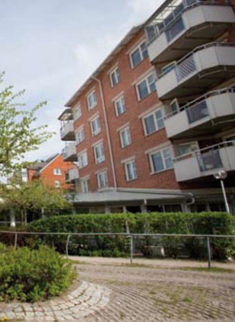
Tunet på Hagagården, Vendelsö