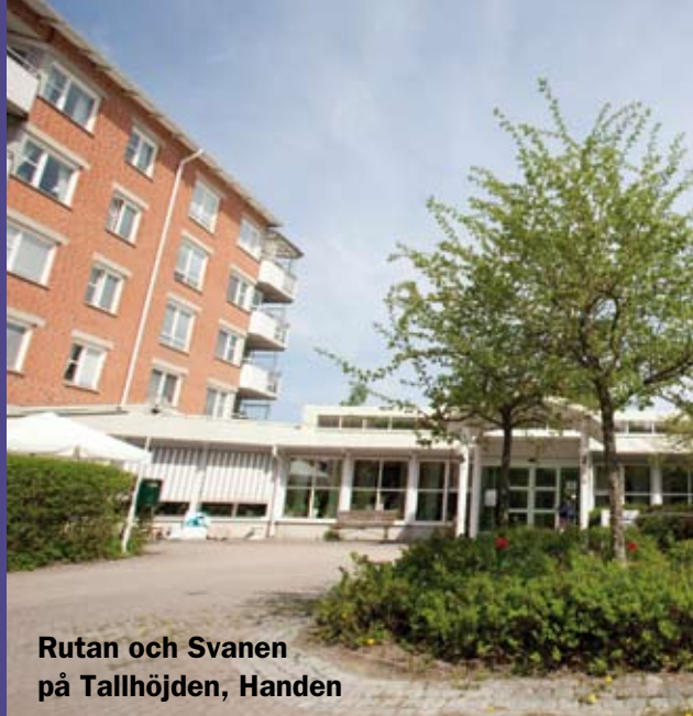
Rutan och Svanen på Tallhöjden, Handen