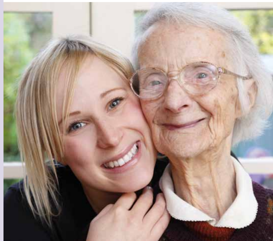
Foto: Leif Johansson/bildarkivet.se m. fl. Grafisk produktion: Åva Group, Mars 2011.