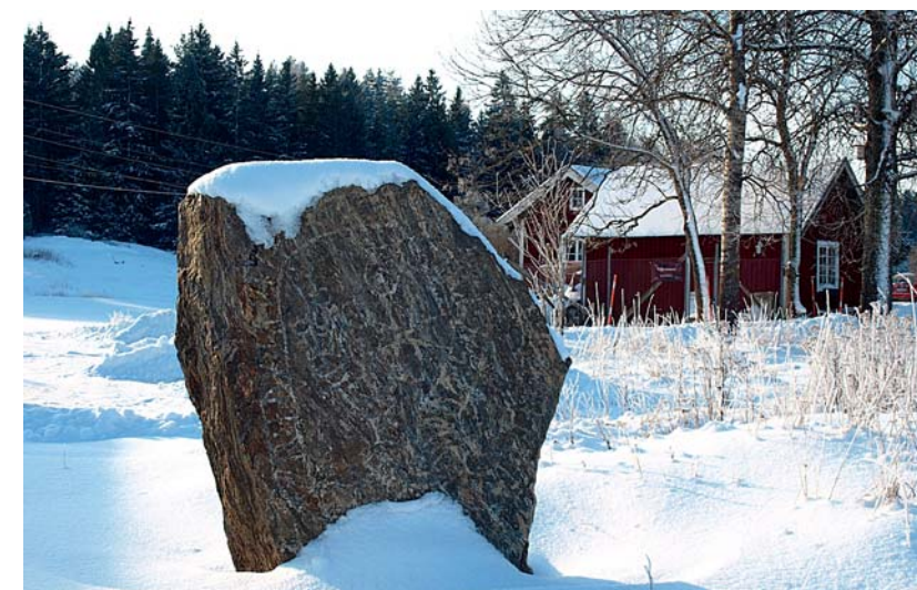
Sönderås, Ålvsjön. Naturen och Berntes runsten 8 2011

Men några är definitivt värda att besöka, till exempel vid Örnö, Lugnet, Övre Rudaljön och Gålgå eller varför inte den vid Skogsbän anses största kommungränsen.