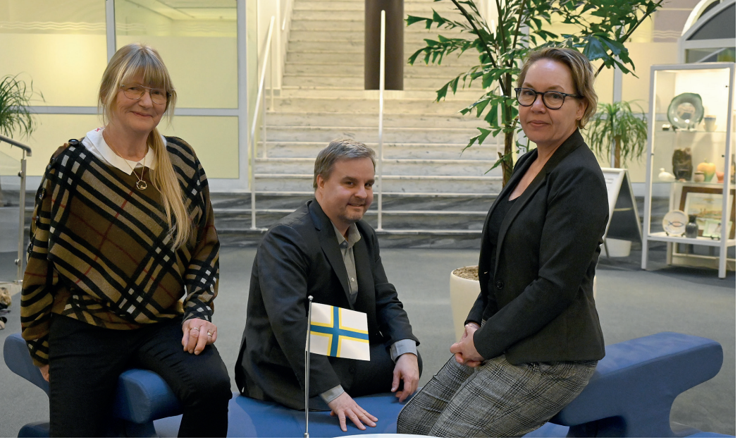
Kuva: Martin von Pfaler